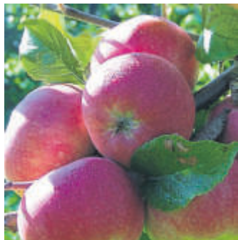
Mehr Obstbäume ist das Ziel der Aktion des Landschaftspflegeverbands.