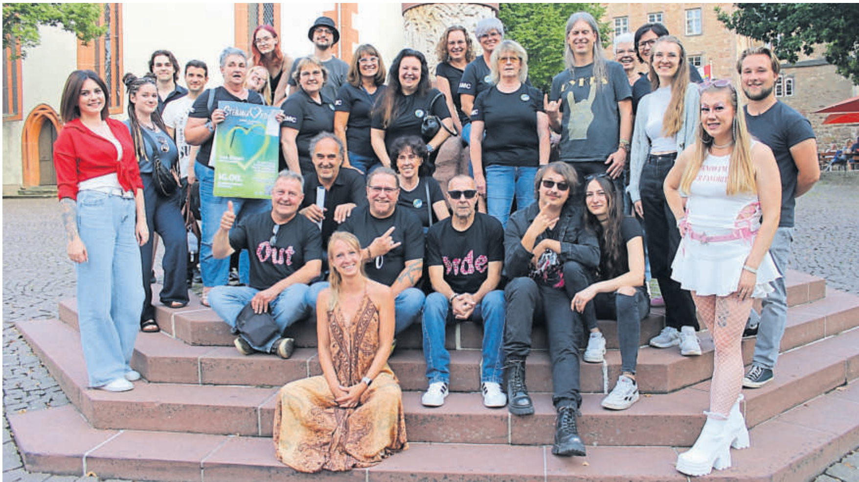
Eine bunte Truppe: Die Künstlerinnen und Künstler, die am 16. August im Freibad Steinau beim zweiten Steinauision Song Contest antreten.