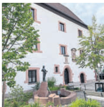
Das Bergwinkel-Museum hat wieder regelmäßig für Besucher geöffnet.

Jeden ersten und dritten Donnerstag im Monat von 16 bis 20 Uhr sowie jeden ersten und dritten Sonntag von 11 bis 15 Uhr