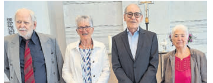
Sie feierten das Fest der Eisernen Konfirmation.