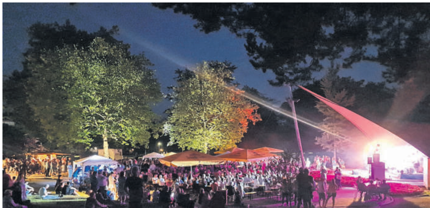
Das Kurparkfest in Bad Soden-Salmünster lädt mit viel Musik und guter Unterhaltung in entspannter Atmosphäre zum Verweilen ein.