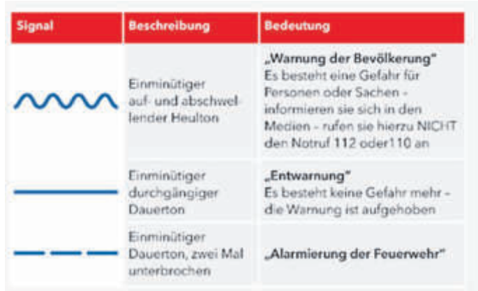
Die verschiedenen Warntöne und ihre Bedeutung.

Besonders herausragend ist die neue Vielseitigkeit der Sirenen. Neben dem bekannten Signal für den Feueralarm können nun mehrere verschiedene Warnsignale gesendet werden, die gezielt auf unterschiedliche Gefahrensituationen hinweisen. Um die Funktionalität überprüfen zu können, wird es künftig jeden ersten Samstag im Monat gegen 13.40 Uhr einen Probealarm geben. Die analog angesteuerten E57 Sirenen wurden bereits abgeschaltet. BWB