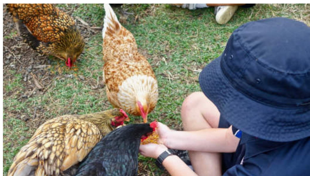
Tiere hautnah erleben. Das ist beim Hoftag in Marjoß am 21. September möglich.

Kunden ein Abo abschließen können und dann pro Woche sechs frische Bio-Eier an einer von mehr als 20 Abholstellen im Kreis beziehen können. Vor einigen Jahren wurde auf dem Hofgut auch ein Naturerlebniszentrum etabliert, das Erwachsenen, Jugendlichen und Kinder die Abläufe im Ökosystem nahebringt. Zahlreiche Kurse und Workshops wie Esel-Trekking, Körbe flechten oder Seminare zur Honigbiene laden dazu ein, selbst aktiv zu werden und die Natur zu erleben. Überdies ist das Hofgut Marjoß Mitglied im Projekt „Lernfeld Landwirtschaft“ des Kreises und bietet Kita- und Schulkindern die Möglichkeit, die Bildungsmöglichkeiten zu nutzen, die ein Bauernhof bietet, der auf ökologische Weise wirtschaftet. BWB