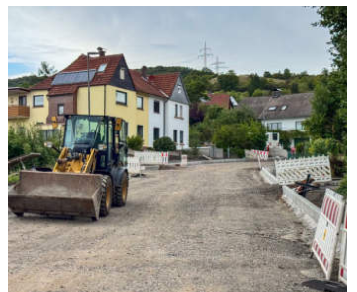
Hessen Mobil saniert die Ortsdurchfahrt Elm bis zum Zementwerk seit Mai 2024 grundhaft.