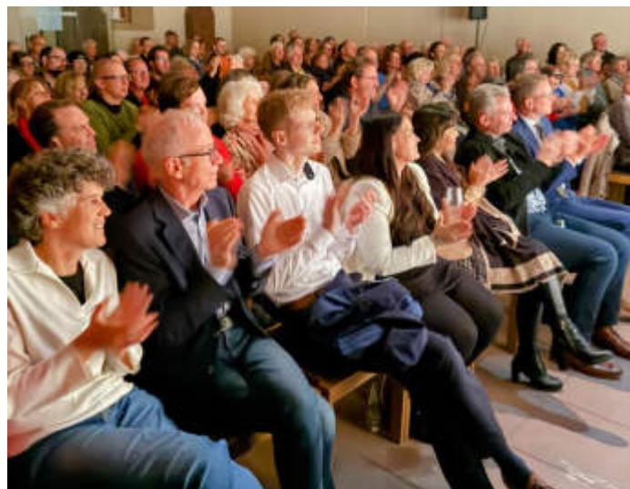
Die Akteure zogen das Publikum ab der ersten Minute in den Bann.

Gustave springt letzten Endes dem Tod noch einmal von der Schippe – es wartet einfach noch zu viel Leben auf ihn. Viele wichtige Botschaften