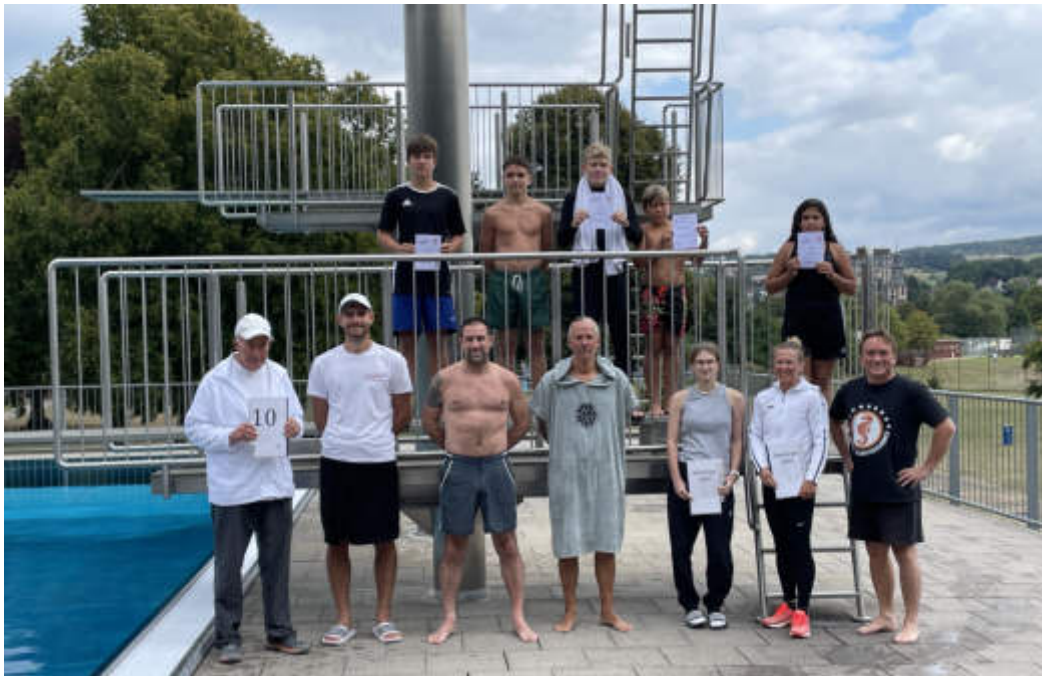
Das Foto zeigt einen Teil der Teilnehmer und Organisatoren nach dem Wettkampf.