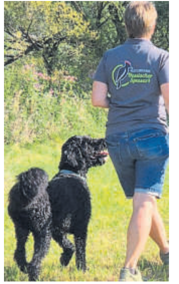
Die Teilnehmenden der Naturparkführung mit Hund dürfen mit ihrem Vierbeiner den Spessartwald erkunden.

Auch tierliebe Menschen ohne eigenen Hund sind herzlich eingeladen. Treffpunkt ist um 14 Uhr auf dem Parkplatz zwischen Workwearstore Strauss und der Eisernen Hand an der B276 zwischen Wirthheim und Bad Orb. Die Wanderung dauert rund zwei Stunden auf einer Wegstrecke von fünf Kilometern. Die Teilnahme kostet für Erwachsene 3 Euro, Kinder sind kostenfrei. Eine Anmeldung ist unbedingt erforderlich, per E-Mail an info@naturpark-hessischer-spessart.de , telefonisch unter (06059) 90 67 83: BWB