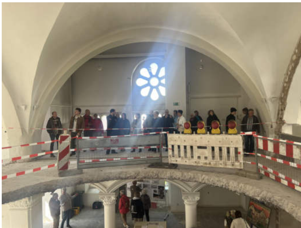
Der Vorstand der Freunde der Synagoge in Schlüchtern hatte zum Tag des offenen Denkmals in die Synagoge und das Rabbinerhaus eingeladen. Die Resonanz war stark.

Besonders beeindruckend war eine starke Gruppe von Besuchern aus Frankreich,