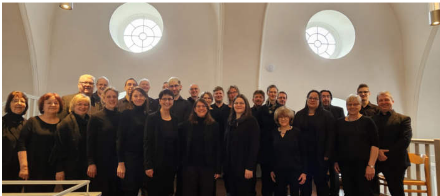
Unsere Aufnahme zeigt das Vokalensemble Schlüchtern. Der Klangkörper feiert sein 25-jähriges Bestehen.