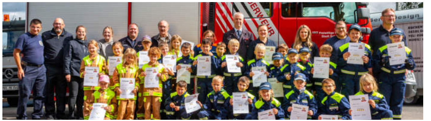
Unsere Aufnahme zeigt die glücklichen Kinderfeuerwehren mit erworbenen Taten.