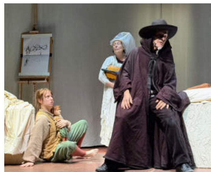
Der junge Held begegnet dem Tod höchstpersönlich ebenso wie seiner wahnsinnigen Schwester Dementia.

Kampf mit dem Tod lernt der neugierige Gustave, dass auch dunkle Tage oder gar die Begegnung mit dem Tod zum Leben, das immer lebenswert ist, dazu gehören.