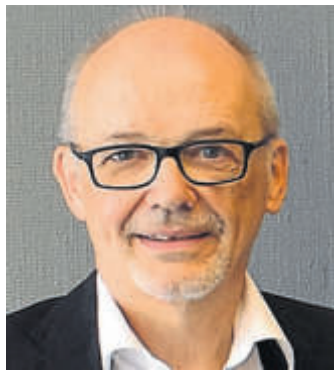
Erhard Belz.