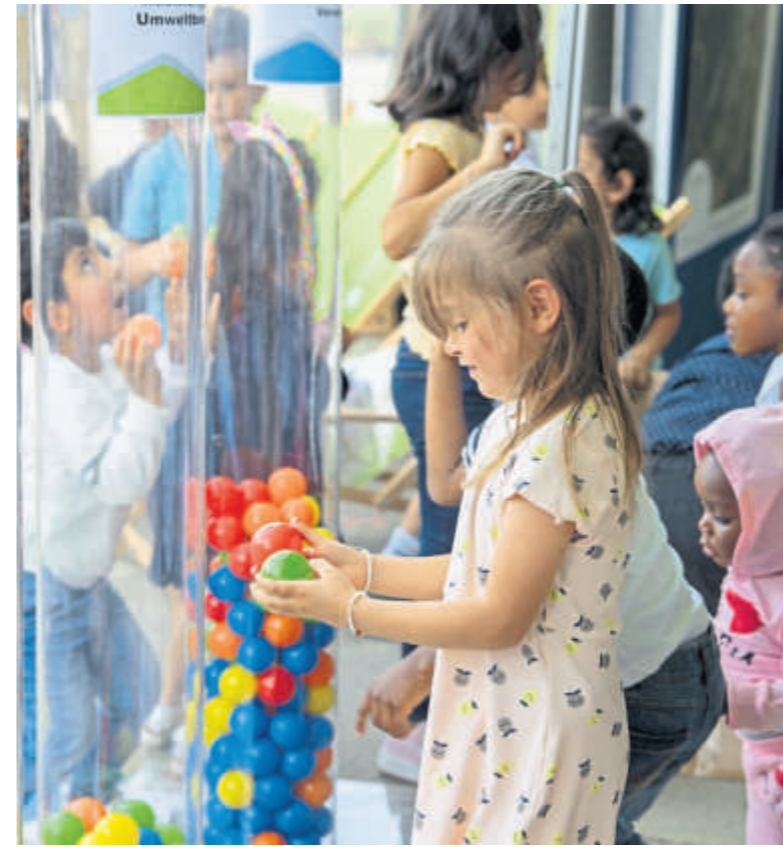
Anhand von bunten Bällchen konnte abgestimmt werden, was einem am wichtigsten ist: Nachhaltigkeit, wirtschaftliche Stabilität, Aufenthaltsqualität oder gesellschaftliche Teilhabe.