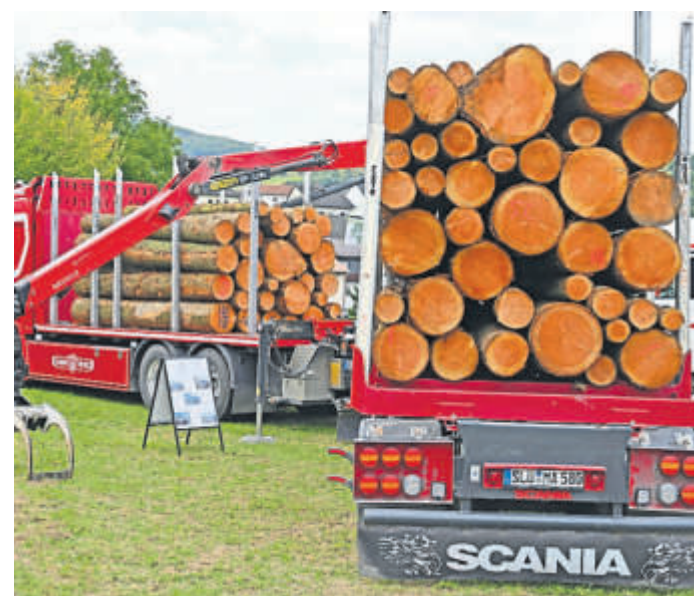
Beeindruckend für viele Besucher waren die riesigen Holztransporter.