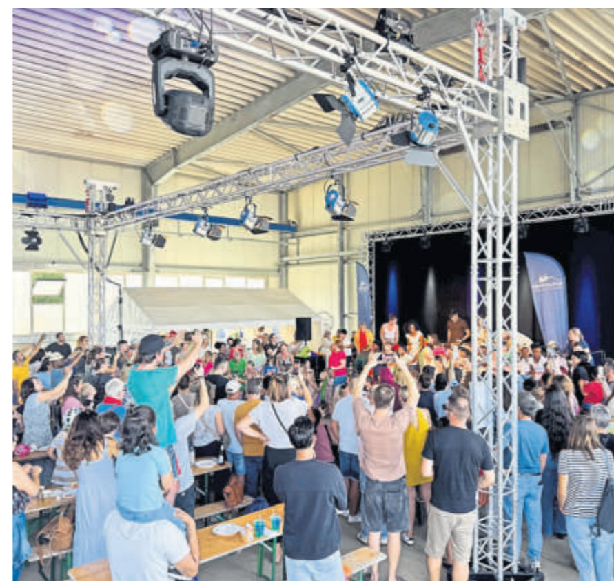
Es war mächtig was los, als fast 60 Kinder der Schlüchterner Kitas ihren großen Auftritt hatten.