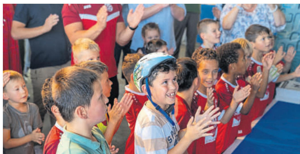
Viel Spaß hatten die Kleinen, aber auch die Großen, beim geglückten Weltrekordversuch im „Rückwärts klatschen“.