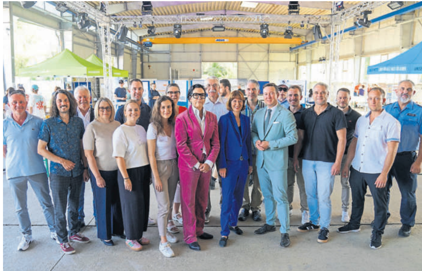
Sie alle haben zum Gelingen dieses besonderen Tages beigetragen.