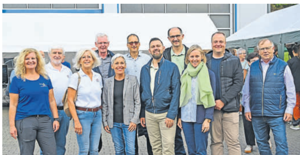
Rund um die Eröffnung entstand diese Aufnahme von prominenten Besuchern.