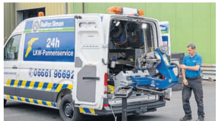
Die Aufnahme zeigt eines der neun Pannenfahrzeuge der Firma.