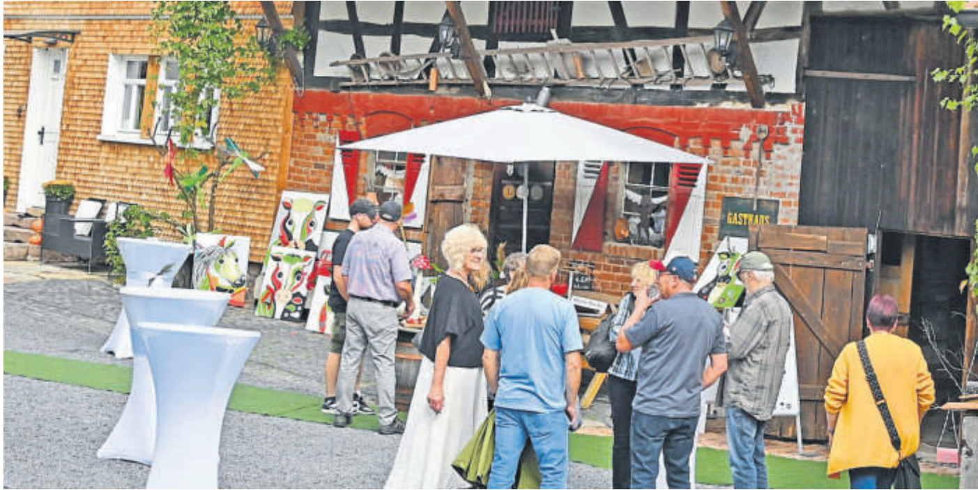
Einer der fünf Standorte war der Hof der historischen Biemühle.