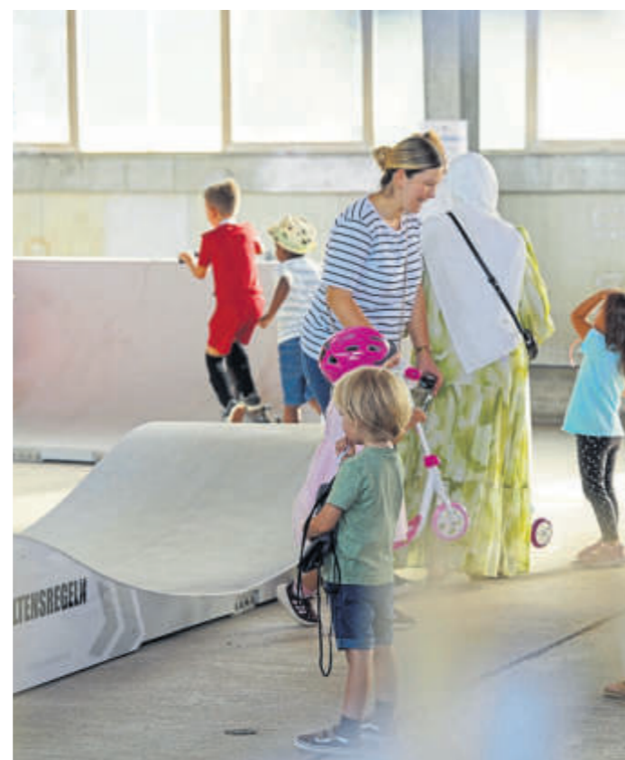
Auf und neben dem Pump Track war von mittags bis abends immer etwas los.