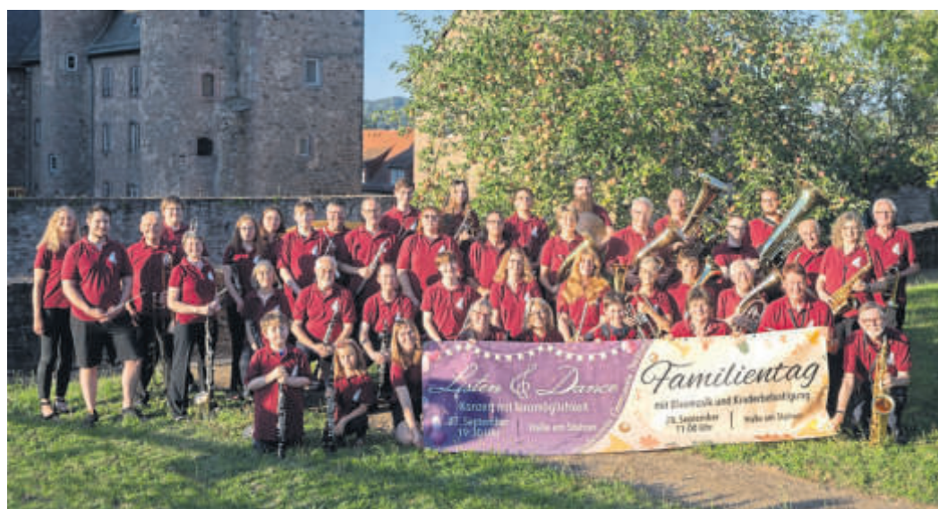
Der „Musikverein Germania“ Steinau feiert 120-jähriges Bestehen.

Kulinarisch versorgt werden die Gäste von einer Metzgerei und einem Kuchenbuffet der Vereinsfrauen. Für Kinder gibt es ein Karussell, eine Hüpfburg und einen Spieleparcours. BWB