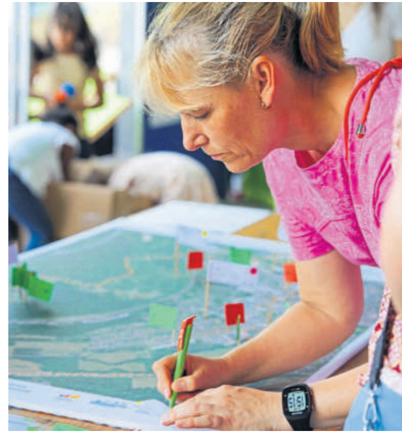
Beim Förderprogramm „Sozialer Zusammenhalt“ soll das Quartier gemeinsam mit den Menschen entwickelt werden. Deshalb wurden Ideen und Verbesserungsvorschläge gesammelt.