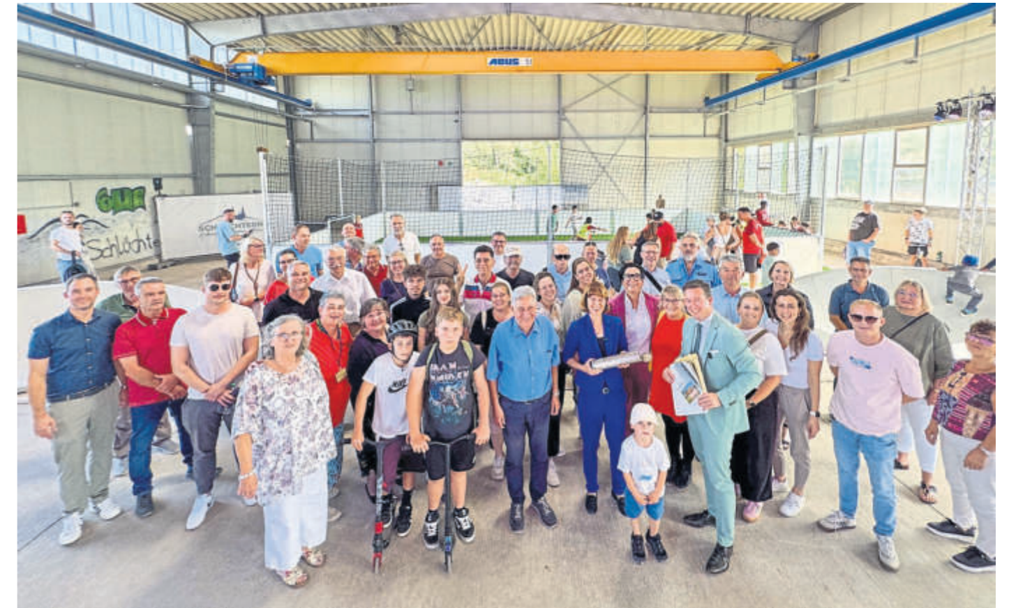
Nach der Podiumsdiskussion wurde die Zeitkapsel geöffnet, die während der Bauarbeiten auf dem ehemaligen Vogt-Areal gefunden wurde. Ministerin Heike Hofmann entdeckte darin Werbeflyer aus den 90er Jahren.