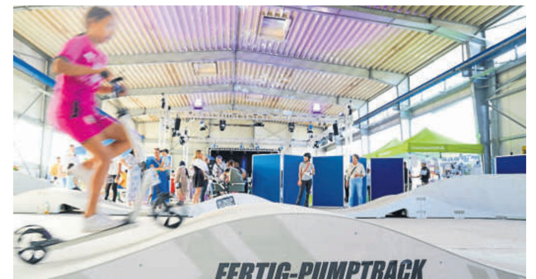
Ob mit Scooter, Fahrrad, Inline-Skates oder zu Fuß: Der Pump Track wurde fleißig genutzt.