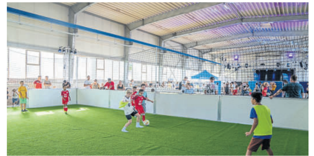
Das Soccerfeld wurde von der SG Schlüchtern betreut – und rege genutzt.