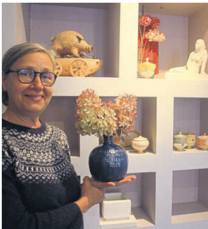
Die Katharinenmarktmeisterinnen-Vase gab es beim Vorstellungabend als Willkommensgeschenk.