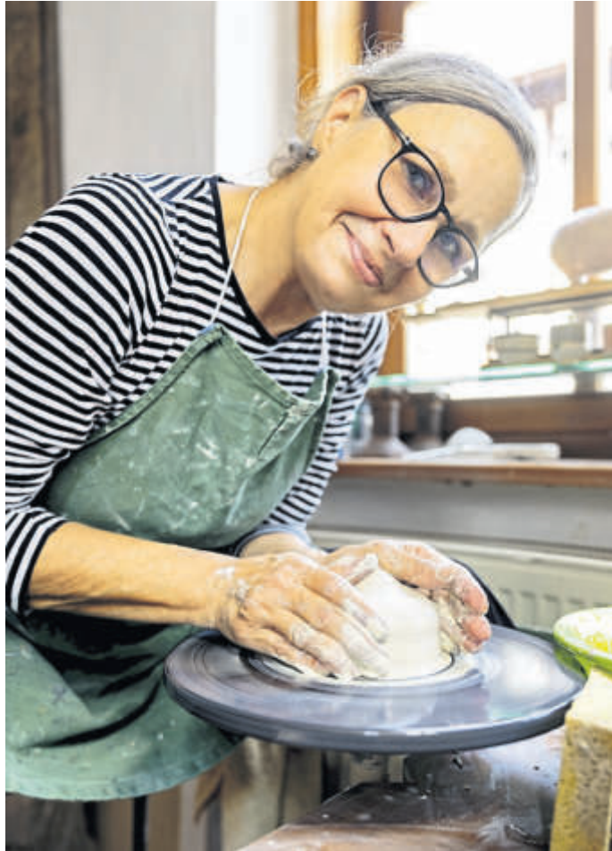
Die Katharinenmarktmeisterin 2025 freut sich nach eigener Aussage „von Herzen auf die Markteröffnung“.

Nach der Wende sei sie über Schwarzenfels, Ahlersbach und Schlüchtern – bekannte Künstlerkolonien – in den Bergwinkel gekommen und 2014 nach Steinau gezogen. Dort habe sie in der Brüder-Grimm-Straße 64 eine geräumige Werkstatt gefunden. „Hausnummer 64. Willkommen in meiner schöpferischen, verträumten und geheimnisvollen Märchenwelt. Wenn ich aus dem Fenster schaue, thront genau über mir am Rathaus die Figur des Töpfers. Das war für mich ein gutes Zeichen dafür, dass ich