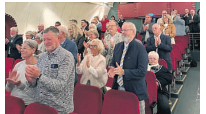
Herzlich begrüßten die geladenen Gäste die neue Katharinenmarktmeisterin.

Das Töpferhandwerk sei im Übrigen 2025 zum Weltkulturerbe ernannt worden, betonte sie und auch, wie dankbar sie sei, nunmehr Teil dieser besonderen Gemeinschaft und Verbundenheit sein zu dürfen. „Wo gehöre ich hin?“, habe sie sich als zugezogene Steinauerin lange Zeit gefragt. Diese Frage dürfte an jenem Freitagabend für sie und alle anwesenden Gäste beantwortet sein. AL