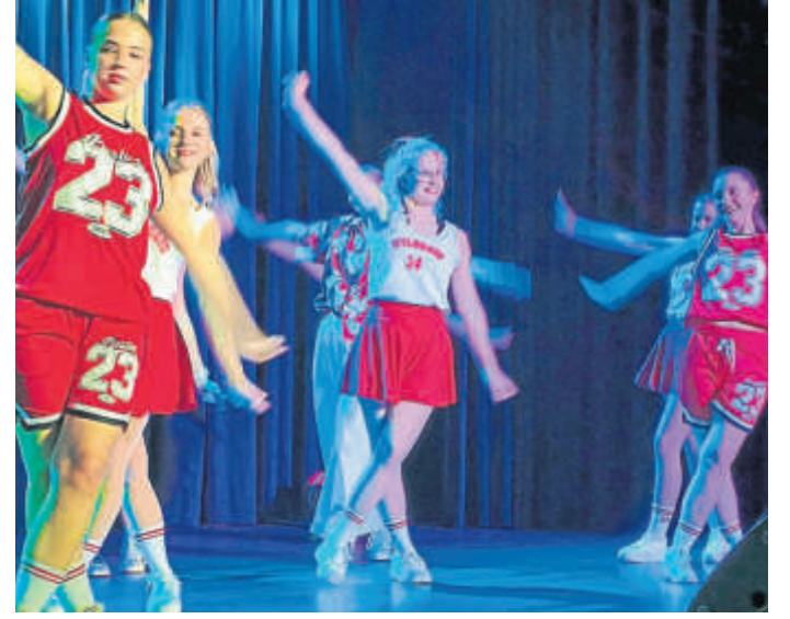
Die Junior-Dance-Crew zeigte den „Highschool Musical“-Tanz.

te-Markt-Präsidenten, dessen Mitglieder eine „Stadtverliebtheit ausstrahlen, die ansteckt“. Danach steckte er Schäfer den kleinen Stadtschlüssel an und meinte: „400 Leute gucken zu, aber wir haben auch das gut hinbekommen.“