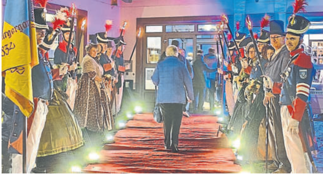
Die Historische Bürgergarde empfing die Gäste stilecht vor der Stadthalle.