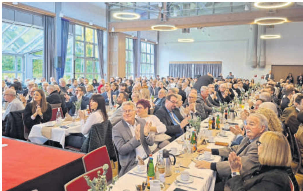
350 Gäste verfolgten interessiert das Geschehen auf der Bühne.