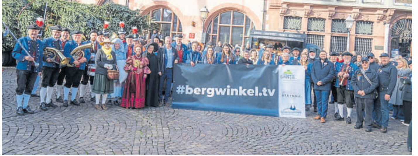
Der Bergwinkel war mit einer starken Delegation vertreten, als der Weihnachtsbaum aufgestellt wurde.