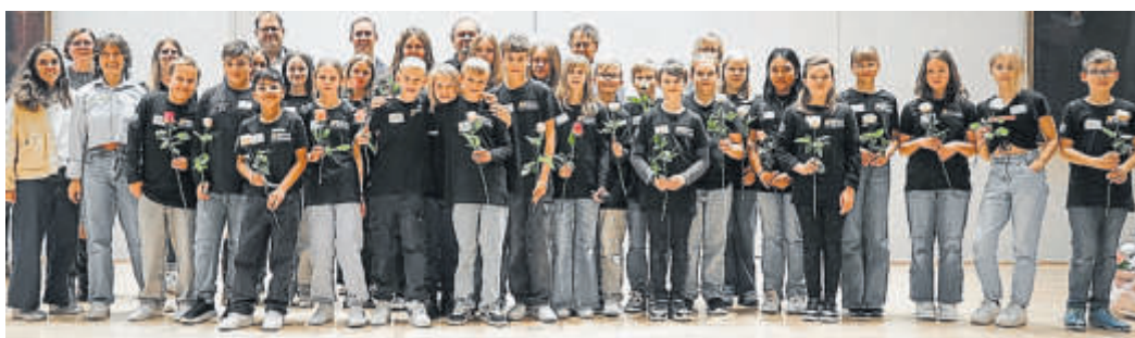
Groß war die Freude bei der Zertifikatsübergabe an die Stadtschule Schlüchtern im Saal der Justus-Liebig-Universität Gießen.

„Das Zertifikat ist ein Auftrag und eine Auszeichnung zugleich“, so die Schulleitung der Stadtschule. Die Stadtschule setzt damit ein starkes Zeichen für die Bedeutung von Kultur als Motor für Kreativität, Persönlichkeitsentwicklung und gemeinschaftliches Lernen. BWB