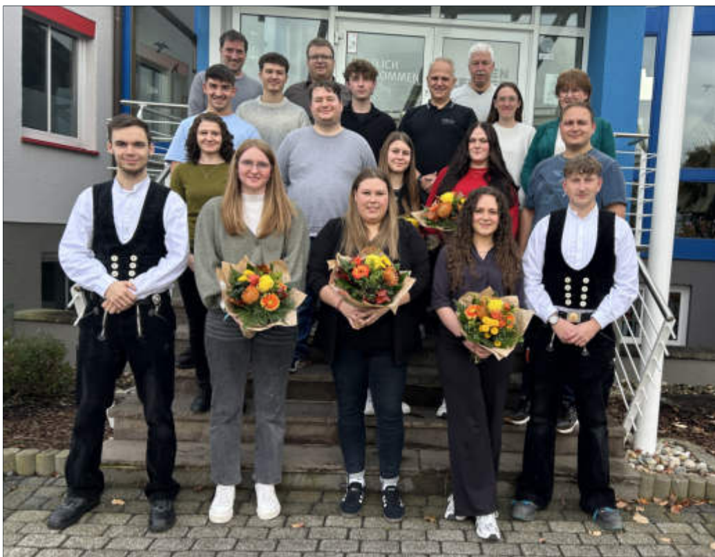
14 Auszubildende haben ihre Ausbildung bei Bien-Zenker abgeschlossen.