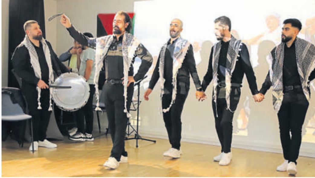
Einem tieferen Einblick in die palästinensische Kultur lieferte die Gruppe „Ram Troupe Ramez Mahmoud“ mit landestypischem Tanz und Musik.

Die Schlüchterner Ärztin berichtete von ihren eigenen palästinensischen Wurzeln. Ihre Eltern wurden von dort