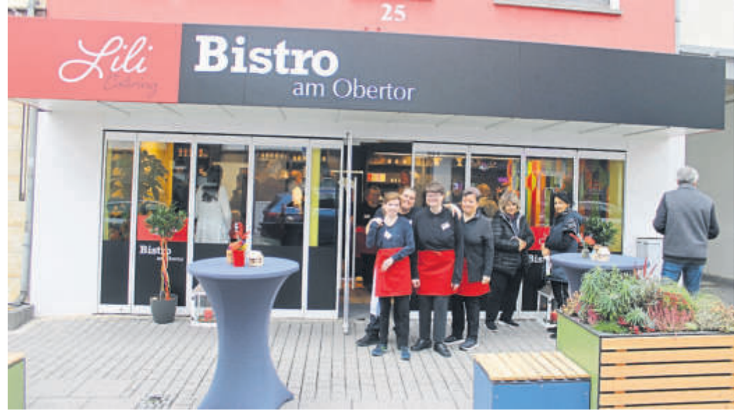
Das Bistro mit seinen rund 25 Plätzen bereichert die Obertorstraße.