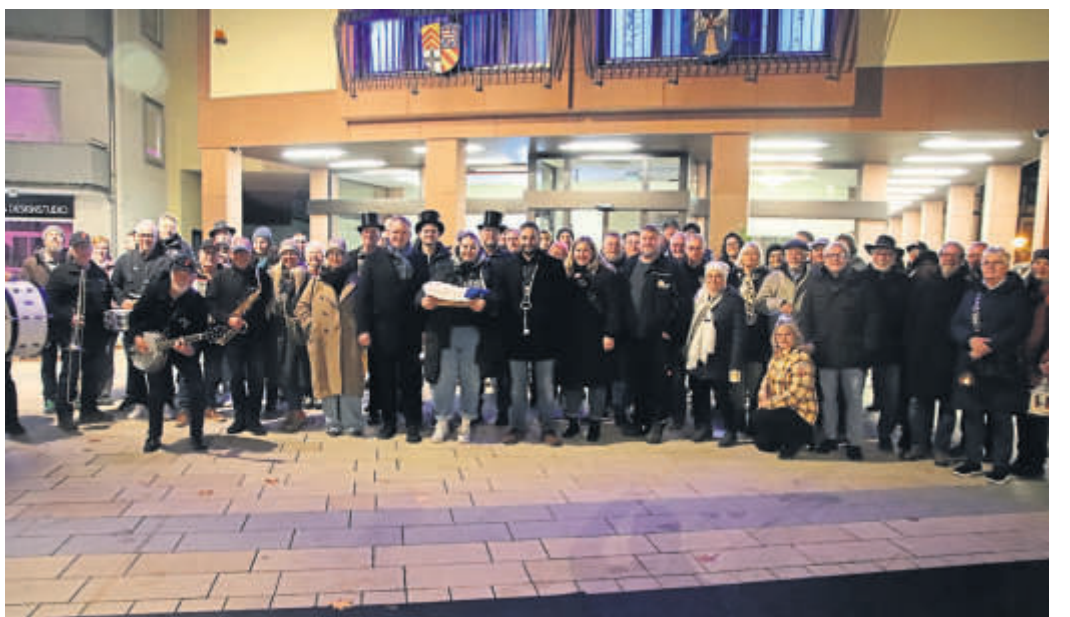
Rund 80 Stammtischbrüder und -schwestern nahmen am Trauerzug zur Beerdigung des Schlüchterner Kalten Marktes teil.

die schönen Höhepunkte Revue passieren: Schlüchterner Abende, Eröffnung, Leierspruch, Lampionumzug und Stammtisch-Eröffnung. Schließlich das ernüchternde Fazit von Hagemann: „Zähneklappern, Wegeschrei! De Kalle Moat – er ist vorbei. Es war – das ist uns allen klar – der schönste Kalle Moat vom ganzen Jahr.“ Die Zeremonie mündete in den gemeinsamen Gesang von „Schnaps, das war sein letztes Wort...“ Doch weil der Abend nicht nur mit Trauer enden sollte, ging es anschließend zum Tröster zurück in den „Hausmann“, wo mit fröhlichen Liedern noch lange gar nicht so traurig gefeiert wurde.