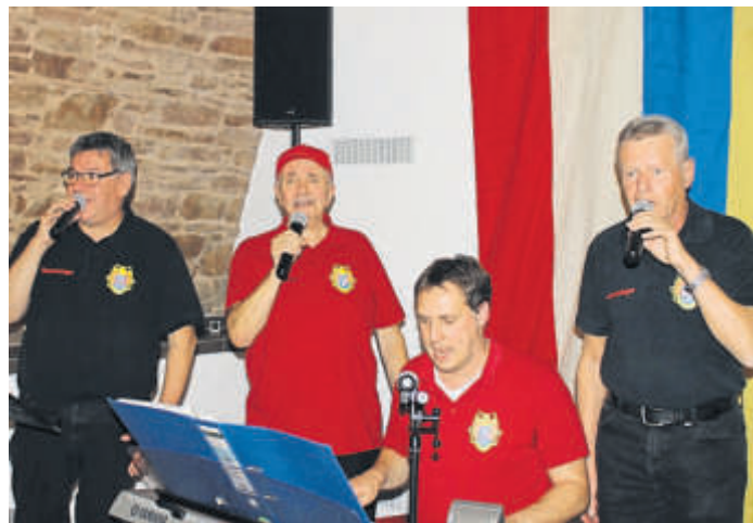
Die Bänkelsänger sorgten musikalisch für eine gute Stimmung beim Kommersabend.