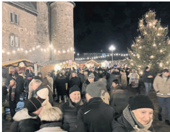
Zum Weihnachtsmarkt in Steinau ist der Schlosshof stets ein beliebter Treffpunkt.

rungen durch das ehemalige Wohnhaus der Familie Grimm, Märchenerzählungen laden zum Zuhören ein.