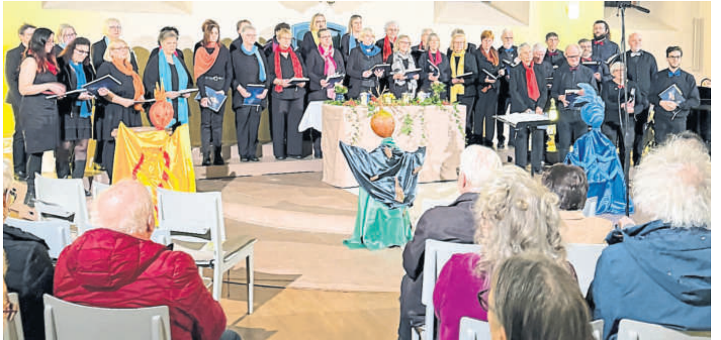
Ein besonderes Konzert des „Chores auf Zeit“ der Chorgemeinschaft Vorwärts erlebten die Besucherinnen und Besucher in der Reinhardskirche in Steinau.