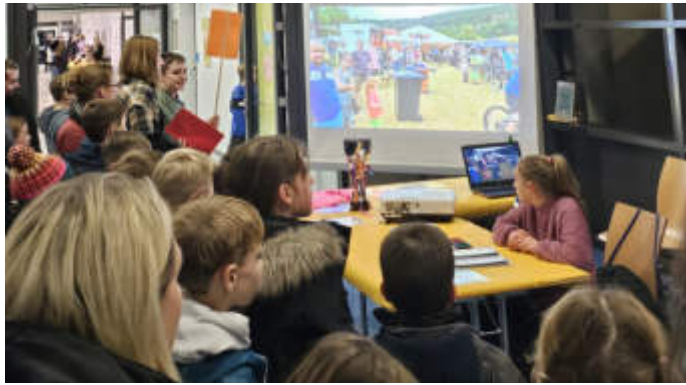
Durch Mitmachangebote können die „Noch-Grundschüler“ unter anderem das Profilangebot des kommenden Jahrgangs 5 kennen lernen.