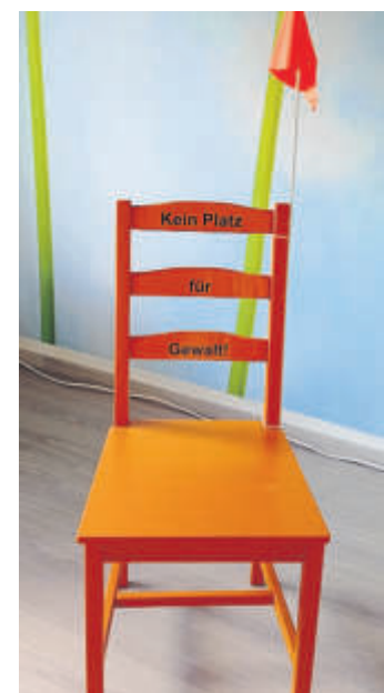
Kein Platz für Gewalt steht auf der Lehne des orangefarbenen Stuhls geschrieben.