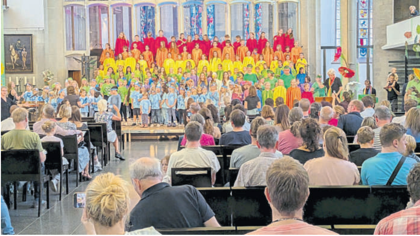
Beim Regenbogenlied schlüpfen die Kinder blitzschnell in bunte Tücher und verwandelten die Bühne in einen leuchtenden Regenbogen.