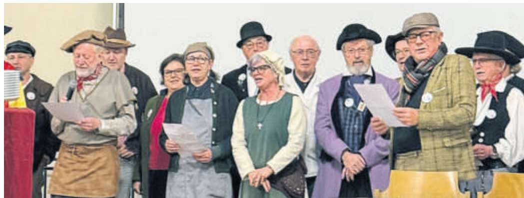
Zum Ausklang des Heimatabends stimmten die Katharinenmarktmeisterinnen und -meister das „Kathreimoadslied“ an.