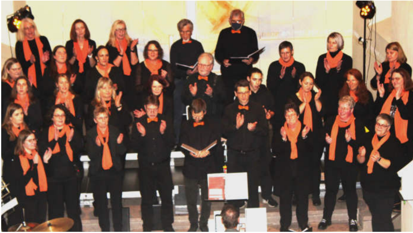
Der Wallrother Gospelchor „New Spirit“ gefiel mit seinem Konzert in der örtlichen Kirche.