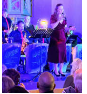
Die Caravan Big Band begeisterte in der Katharinenkirche.