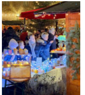
Viele hübsche Dinge gab es an den Holzbuden.