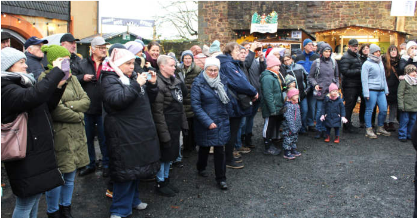
Viel Betrieb herrschte beim Schwarzenfelser Weihnachtsmarkt im Burghof.