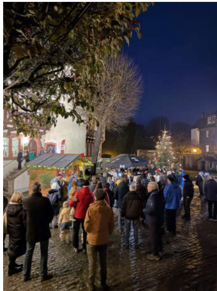
Nach einigen Jahren Pause war der Amtshof in diesem Jahr wieder in das Marktgeschehen eingebunden.

Noch viel mehr weihnachtliche Stimmung kam beim Weihnachtskonzert der Teilnehmer des „Steinauvison Song Contest“ auf (Bericht folgt) – ein sicherlich ganz besonderer Abschluss eines gut besuchten Weihnachtsmarktes voller Neuerungen und ersten Malen. AL