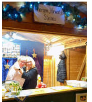
Die Chorgemeinschaft Vorwärts sorgte für das leibliche Wohl.