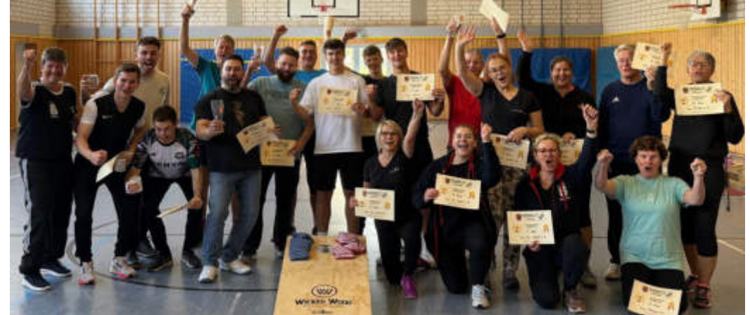
Mächtig viel Spaß hatten die Teilnehmerinnen und Teilnehmer am ersten Cornhole-Vereinsturnier beim TV Salmünster.