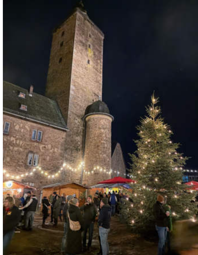
Lichterglanz und weihnachtliche Stimmung erfüllten den Schlosshof.