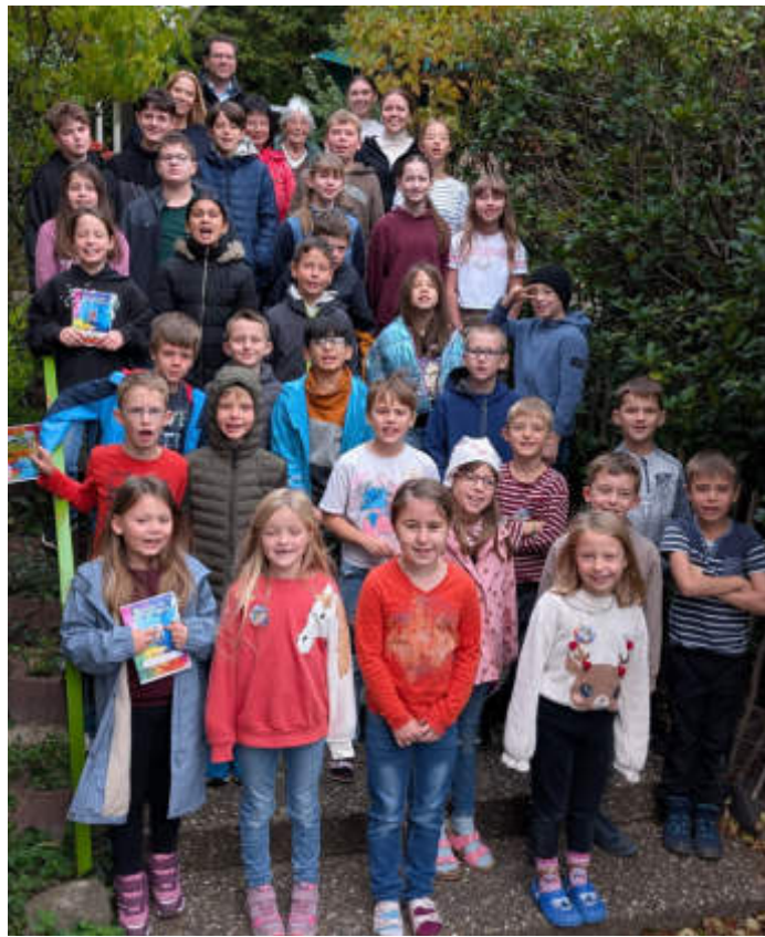
An der Kinderfreizeit nahmen 32 sechs- bis zwölfjährige teil.