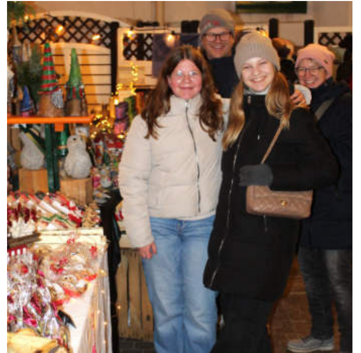
Viel Spaß hatten diese Besucher an den weihnachtlichen Ständen im Keller des Marstalls.