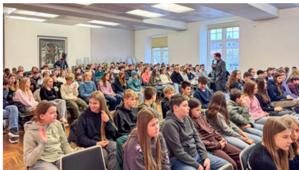
Die Veranstaltung wurde in zahlreiche Klassenzimmer gestreamt. Insgesamt nahmen knapp 800 Kinder und Jugendliche am Schülertalk teil.