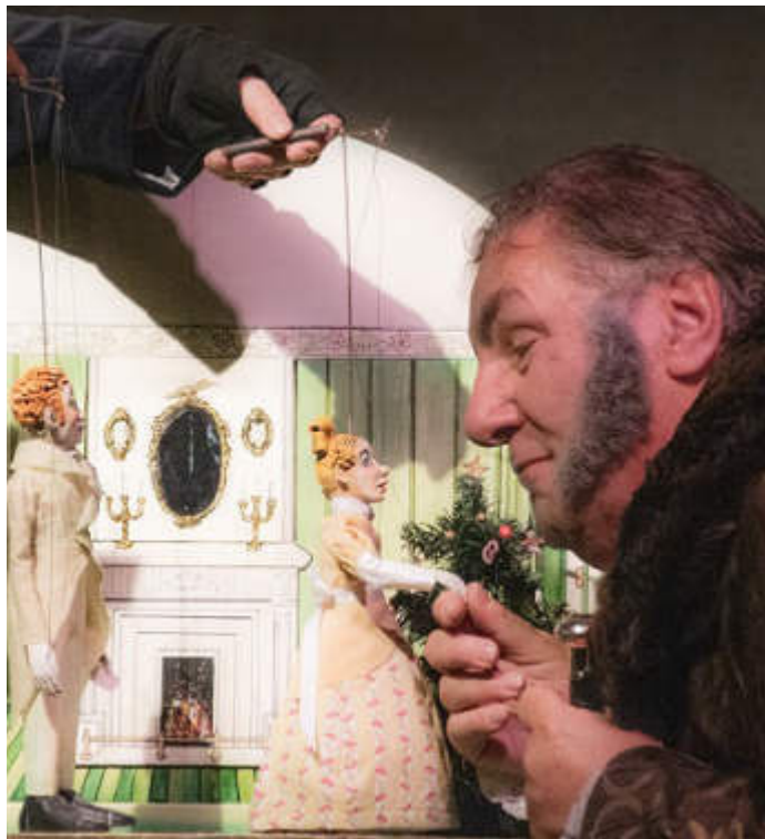
Mittlerweile eine beliebte Tradition in Steinau: Das Theatrium zeigt „A Christmas Carol“.

Die Vorstellungstermine sind: Samstag, 13. Dezember, 20 Uhr; Sonntag, 14., 16 Uhr; Freitag, 19., 20 Uhr; Samstag, 20., 20 Uhr und Sonntag, 21. Dezember, 16 Uhr. Der Eintritt kostet 20 Euro, ermäßigt 16 Euro. Tickets gibt es unter www.theatrium-steinau.re-servix.de , telefonisch unter (069) 90 283 986 sowie an allen Reservix-Vorverkaufsstellen. BWB