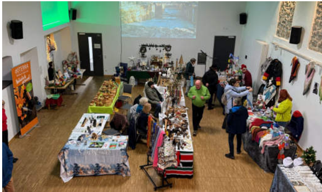
Liebevoll dekoriert präsentierte sich der Bereich mit den Verkaufsständen.

SALMÜNSTER – Manche Kleinode liegen so versteckt, dass es sich zu Beginn gar nicht erahnen lässt, welch zauberhaftes Geschehen hinter Toren und Gemäuern auf die staunenden Besucher wartet. Und in der Tat konnte sicherlich der ein oder andere Besucher nur staunen, als er sich auf dem traditionellen Adventsmarkt im Schleifraschhof in Salmünster wiederfand. Nicht nur erstrahlte der historische Hof im schönsten Lichterglanz, sondern auch gab es jede Menge zu entdecken. Zwischen den alten Fachwerkhäusern und bedeutsamen Gemäuern reihte sich Bude an Bude - und ob der Auswahl an angebotenen Köstlichkeiten war es kein Leichtes sich für eine der Gaumenfreuden zu entscheiden. Liebevoll dekoriert präsentierte sich der Innenhof – ein jeder Besucher merkte sofort, dass hier viel Leidenschaft und Engagement seitens des Orga-Teams und den anwesenden Vereinen und Gewerbetreibenden im Spiel waren. Selbst die Jugendfeuerwehr war mit einem eigenen Stand vertreten und punktete mit selbstgemachten Schokocrossies. Wer noch auf der Suche nach kleinen Präsenten war, der konnte sich im Generationentreff inspirieren oder gar beraten lassen und selbst Kunsthandwerkern bei der Arbeit zusehen.