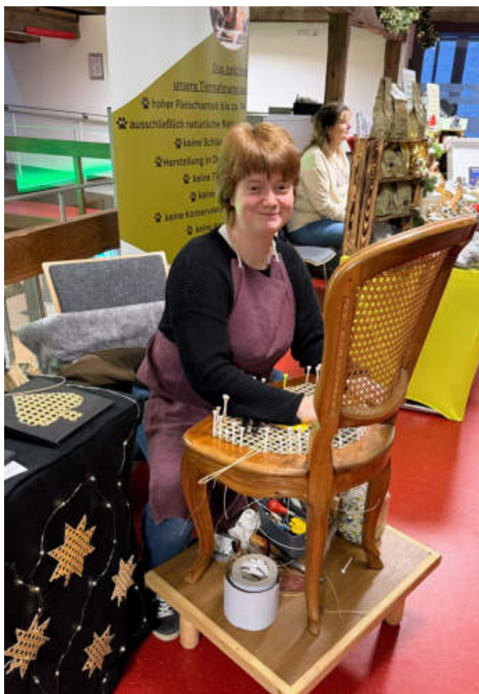
Die Besucher konnten Kunsthandwerkern bei der Arbeit zusehen..

Orchester zu sehen war. Hierzu mussten die Besucher weit ihre Köpfe recken, um zu erkennen, dass sich das Orchester hinter den Fenstern neben dem Treppenturm verbarg. Doch nicht nur erklangen aus dem historischen Gebäude die schönsten Töne, sondern auch erstrahlte dieses mit Einbruch der Dämmerung in den hübschesten „Fassadenfarben“. Auch außerhalb des Hofes gab es für die Besucher so Manches zu entdecken. So lud das Heimatmuseum in die „Plätzchenbackstube“ ein und auch führte ein Schmied seine Künste vor. AL