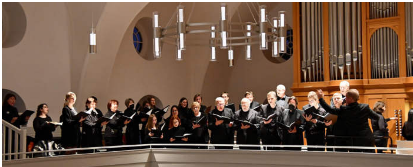
Die ersten drei Kantaten aus dem Weihnachtsoratorium werden in der Stadtkirche St. Michael erklingen.