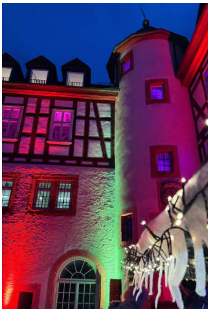
Der historische Hof strahlte im schönsten Lichterglanz.