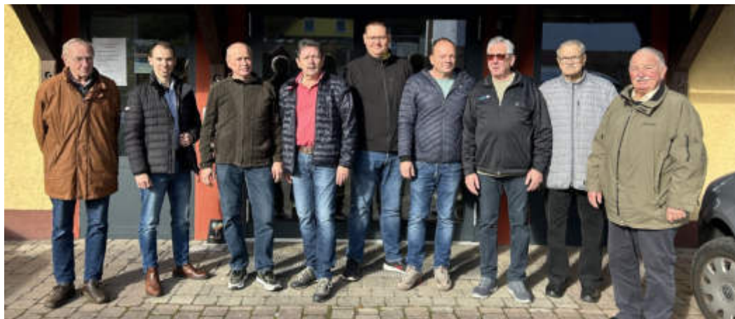
Die CDU-Fraktion war unterwegs in den Sinntaler Ortsteilen.