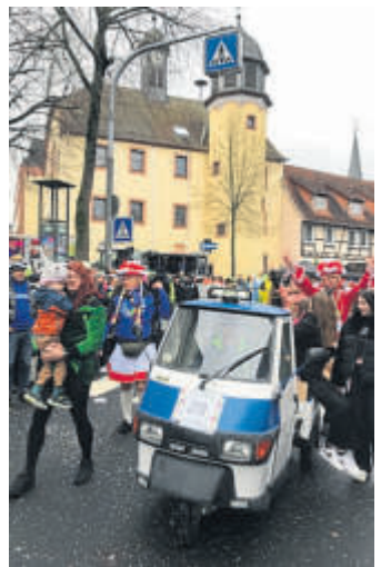
Der SCC steuert auf die närrischen Höhepunkte zu.

Anwohner werden gebeten, ihre Häuser mit Luftballons und Luftschlangen zu dekorieren und so Schlüchtern noch bunter zu machen. Es wäre zudem schön, wenn die