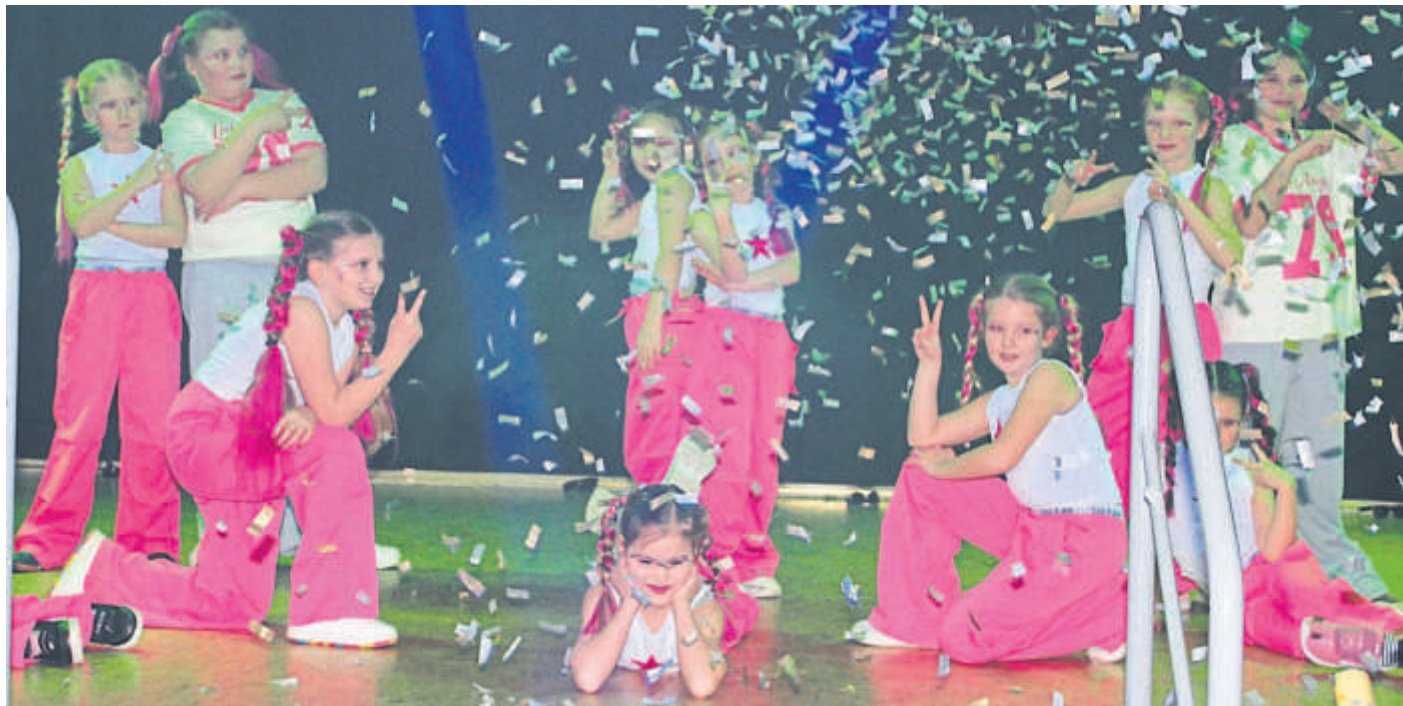
Die „Zeller Kids“ präsentierten sich zum Auftakt des Showtanzabends in Oberzell.