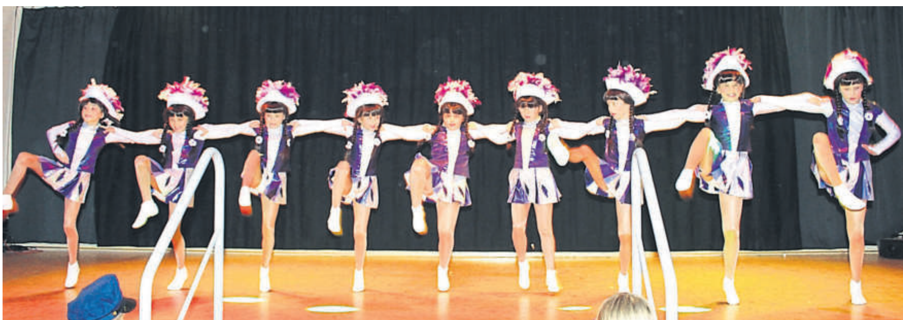
Einen zackigen Gardetanz zelebrierte die Jugendgarde des TV Sterbfritz.

Zeller Kids Oberzell, Jugendgarde Sterbfritz, Dance Fire Oberzell, The new generation Weichersbach, DäänSins Schönderling, Fearless Weichersbach, Schoppegranaten Löschenrod, Sinergy Jossa, Blue Diamonds Heubach, Blue Magics Heubach, Wild Angels Oberkalbach, Gemischtes Hack Mottgers, RiednRockets Riedenberg, 9/10/22er Lütter, Feinschliff Mittelkalbach, Jamnots Huttengrund, Chopperklopper Hintersteinau, Zells Angels Oberzell, Thekentornados Rothemann, Männerballett Freiensteinau, Rhöngarde Eiterfeld, Flotte Spritzer Niederkalbach, Flying Steps Oberzell. FWG