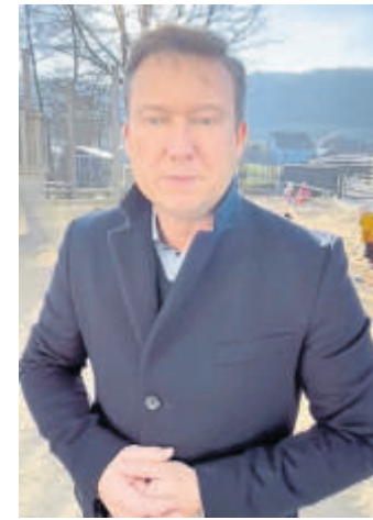
Das Bild stammt aus dem Video auf Social Media, in dem der Bürgermeister die Lage erläutert.

Die Stadt Schlüchtern wird die Menschen über weitere Entwicklungen über die Presse und auf Social Media auf dem Laufenden halten. BWB