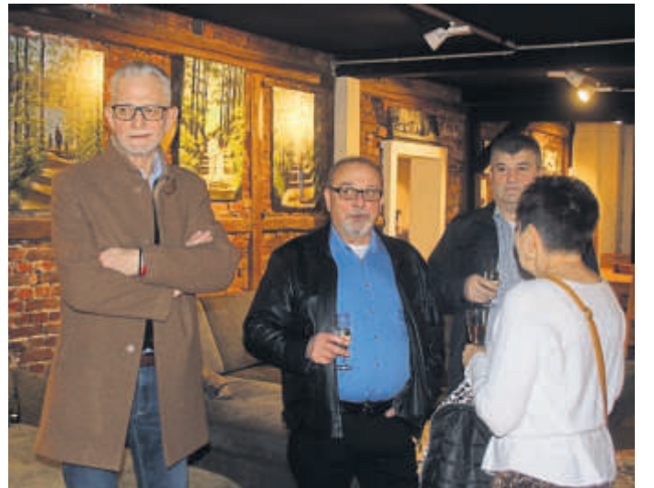
Es waren Bilder zu sehen, die Fragen stellen und Antworten geben.

mich besonders. Wenn ich ein markantes Gesicht sehe, lässt es mich nicht mehr los. Ich versuche hinein zu schauen und meine Eindrücke in Acryl festzuhalten“, verrät die Künstlerin. CS