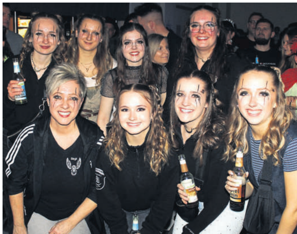
Die Oberzeller „Flying Steps“, die das mehr als fünfstündige Programm mit einem anspruchsvollen Showtanz beendeten, erfrischten sich mit kühlen Getränken.

Münder der meist weiblichen Akteure. Immer wieder gab es verdienten, donnernden Szenenapplaus. FGW