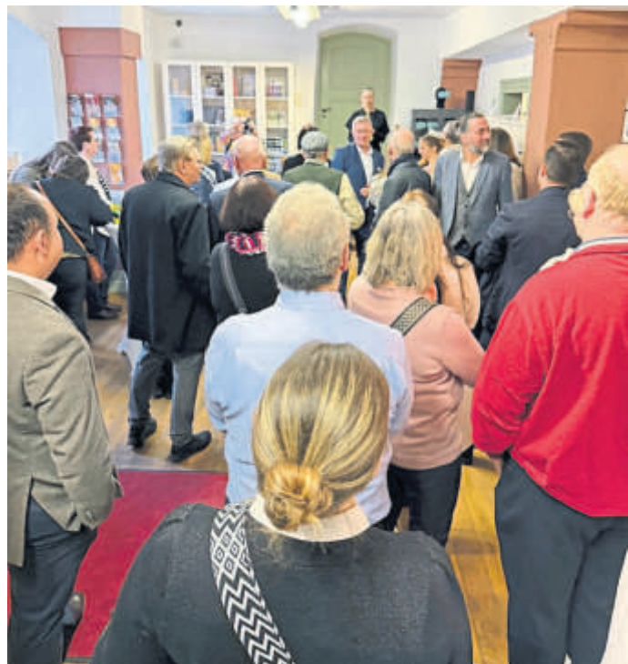
Der Neujahrsempfang fand in den Räumen des Brüder Grimm-Hauses statt.