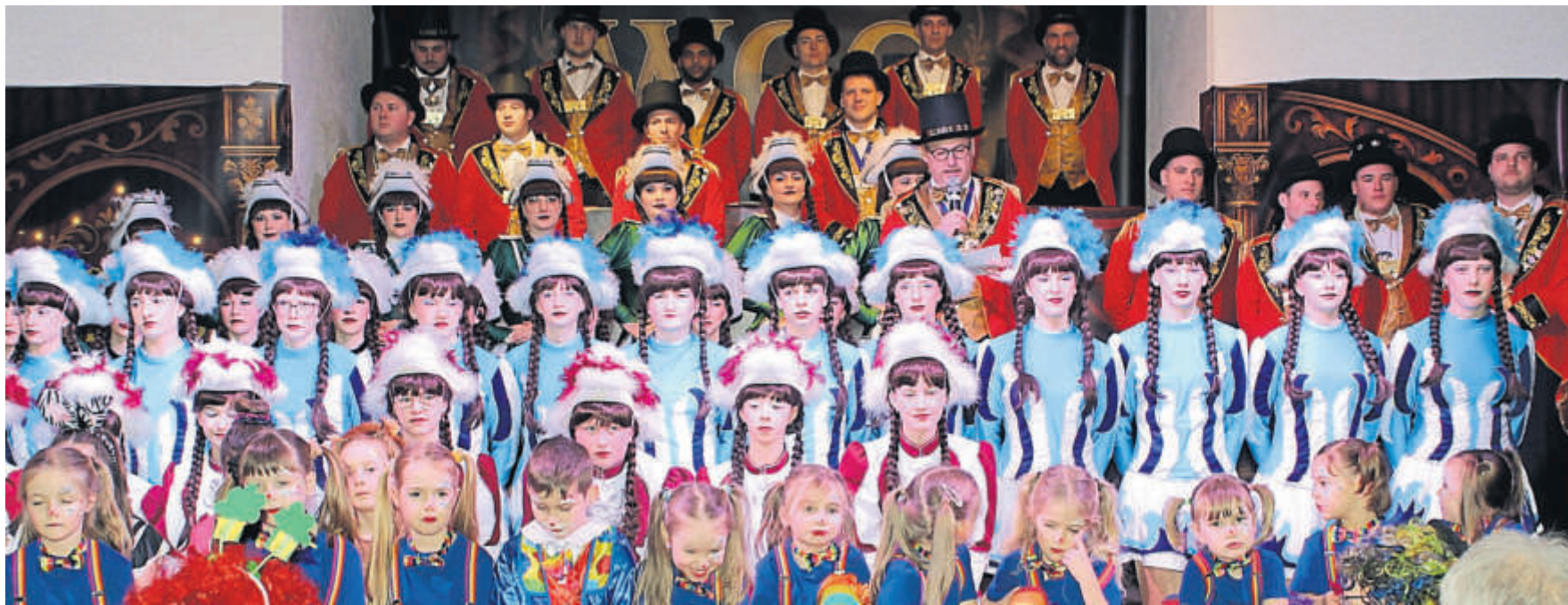
Die Aktiven des Wallrother Carnival-Clubs nahmen zu Beginn der Kräppelsitzung im Saal des Landgasthofes Druschel Aufstellung.

Unterwegs zu einer Beerdigung waren „Hermann & Gerda. Ausführlich diskutiert wurde über die vorbereitete Grabrede. Sirenengeheul leitete den Auftritt der Feuerwehr ein, bei welchem es ein gewolltes großes Durcheinander gab. Einen stimmungsvollen Gesangsauftritt hatten die „Chor-dulas“-Damen. Ein Nachtwächter berichtete humorvoll über seine Aktivitäten. Alle Auftritte kamen beim begeisterten Publikum gut an und wurden mit viel Applaus belohnt. FGW