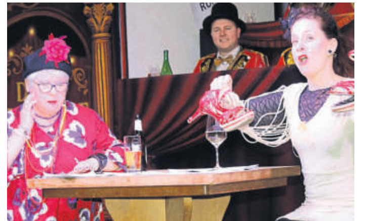
Die Landfrau und die Stadtfrau im Zwiegespräch.