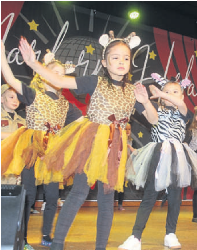
In entzückenden Kostümen gingen die Tanzlöwen aus Jossa auf Safari.