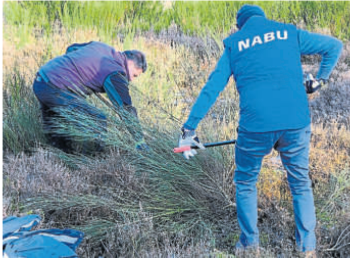
Der Ginster wurde entfernt, um ein Verbuschen der Fläche zu verhindern.

MERNES – Traditionell im Januar erklimmen Naturschützer den 465 Meter hohen Stacken bei Mernes. Viele von ihnen tragen dicke Arbeitshandschuhe und Astscheren, manche sehr große Gartensäcke. Und einige wenige sogar altertümlich anmutende Holzhacken, die seit mehr als 40 Jahren im Einsatz sind. Auf dem Berg angekommen ging es auch in diesem Jahr dem Ginster an den Kragen, um eines der letzten Wacholderheide-Vorkommen der Region vor der Verbuschung zu schützen. „Hier oben ist wirklich Ruhe und eine ganz andere Atmosphäre. Ich fühle mich fast wie in einem anderen Land. Die Landschaft sieht doch aus wie in Italien“, meinte Michel, der das erste Mal beim Arbeitseinsatz der NABU-Gruppe Mernes/Jossatal mit dabei war. Recht hat er. Auf der waldfreien, sandigen Bergkuppe ragen nur einzelne urwüchsige Wacholdergreise in den Himmel. Im Sommer stoben hier unzählige Blauflügelige Ödlandschrecken auf. Im Herbst erstrahlen die Flächen in den zarten Lila- und Rottönen der lichtergrünen Besenheide. Damit das so bleibt, entfer-