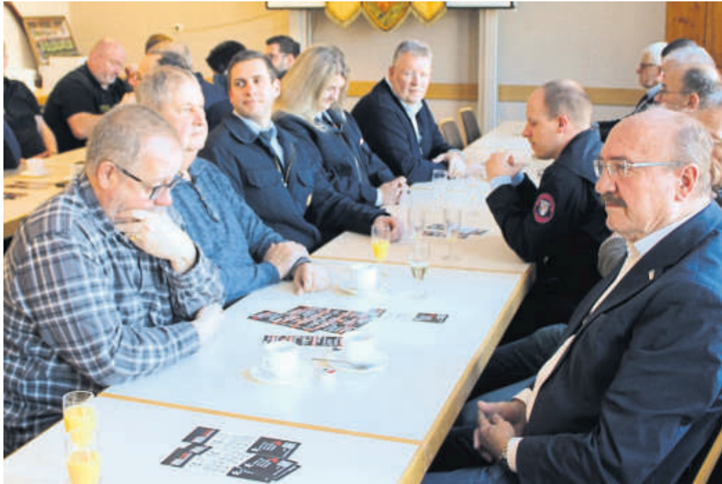
Einige Teilnehmer beim Neujahrsempfang des Feuerwehr-Unterverbandes Schlüchtern im Feuerwehrhaus in Niederzell.

Thematisiert wurde auch der schlechte Zustand des Unterverbands-Banners, welches über 50 Jahre alt ist. Als sichtbares Zeichen des Verbandes in der Öffentlichkeit solle das Banner erhalten