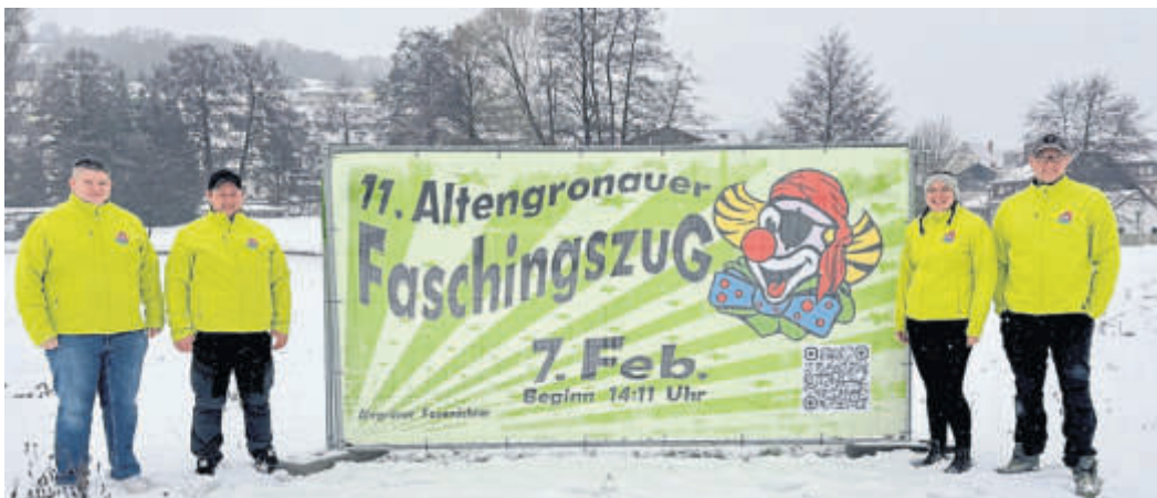
Die Alegrüner Fosenöchter laden Narren aus nah und fern für Samstag, 7. Februar, zum Faschingsumzug ein.

schmückte Festzelt zur großen Faschingsparty ein, bei der ausgiebig getanzt und gefeiert werden kann. Wichtig für alle Besucher ist hierbei der Hinweis, dass aufgrund behördlicher Auflagen eine Alters- und Ausweiskontrolle durchgeführt wird. Der Einlass zur Veranstaltung am Festplatz ist daher ausschließlich mit gültigem Ausweis möglich. BWW