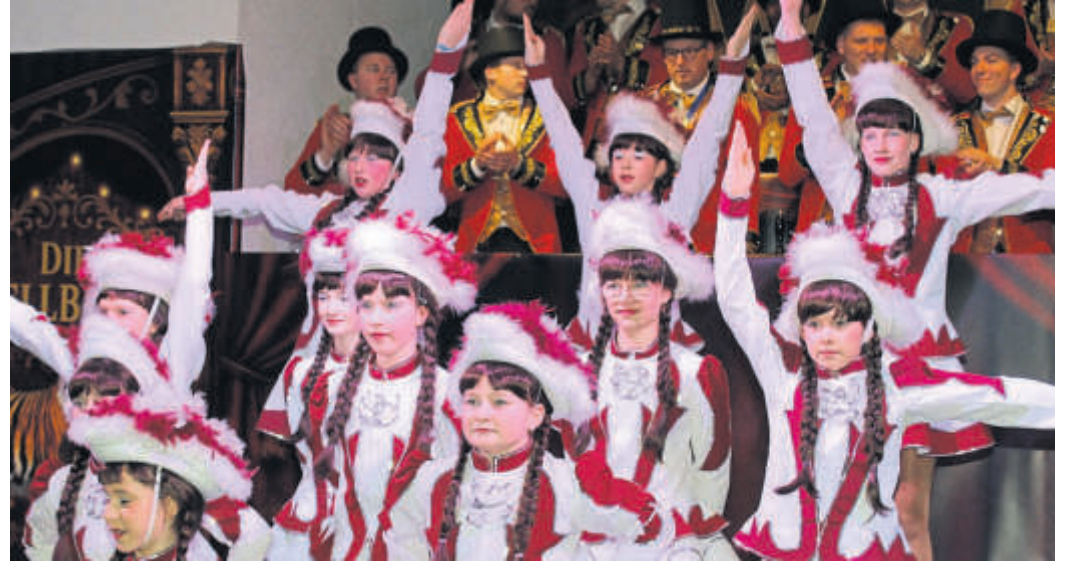
Die Konfetti-Garde überzeugte ebenso wie alle sieben Tanzgruppen des Wallrother Carnival-Vereins.