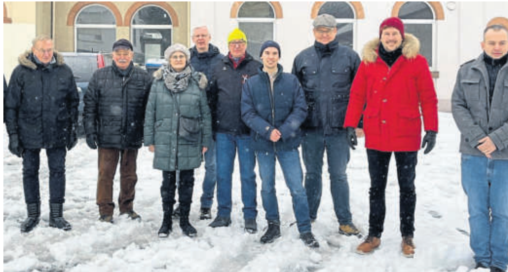
Bei Eis und Schnee setzte die CDU Sinntal ihre Ortsteilbegehungen fort und war in Mottgers, Sterbfritz und Weichersbach unterwegs.

In Sterbfritz stand vor allem die zeitnahe Inbetriebnahme des neuen Kindergartens im