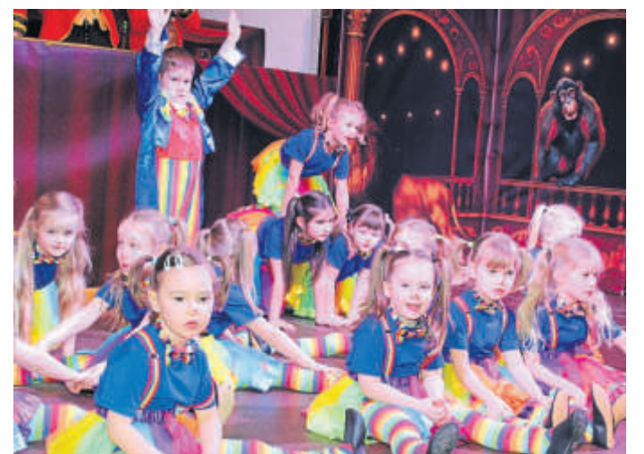
Gelungener Programmauftakt mit den „Mini-Hoppers“.