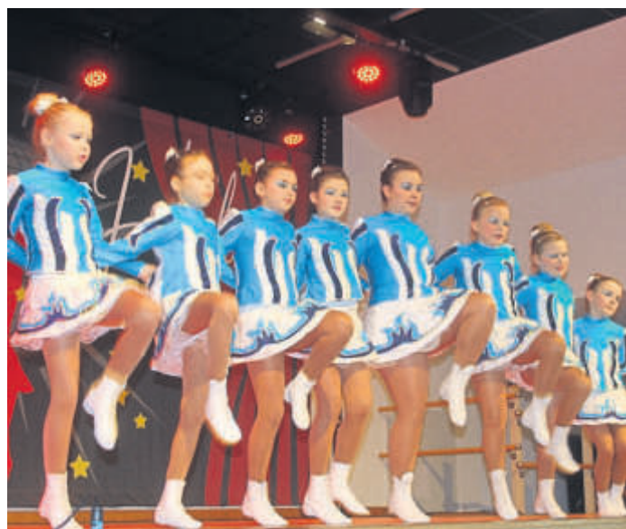
Die „Marborner Sternchengarde“ erfreute das Publikum mit einem Gardetanz.