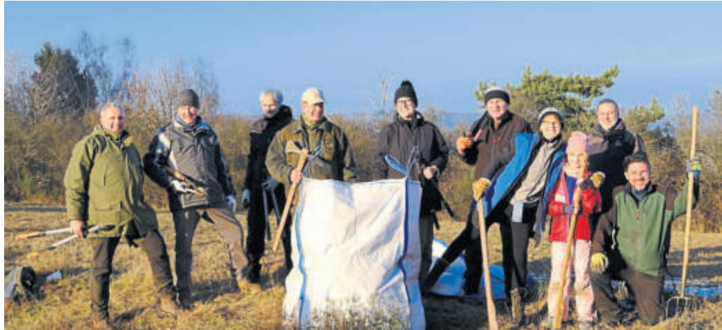
Seit mehr als 40 Jahren kümmern sich die Mitglieder des NABU Mernes/Jossatal um die wertvolle Wacholderheidefläche.