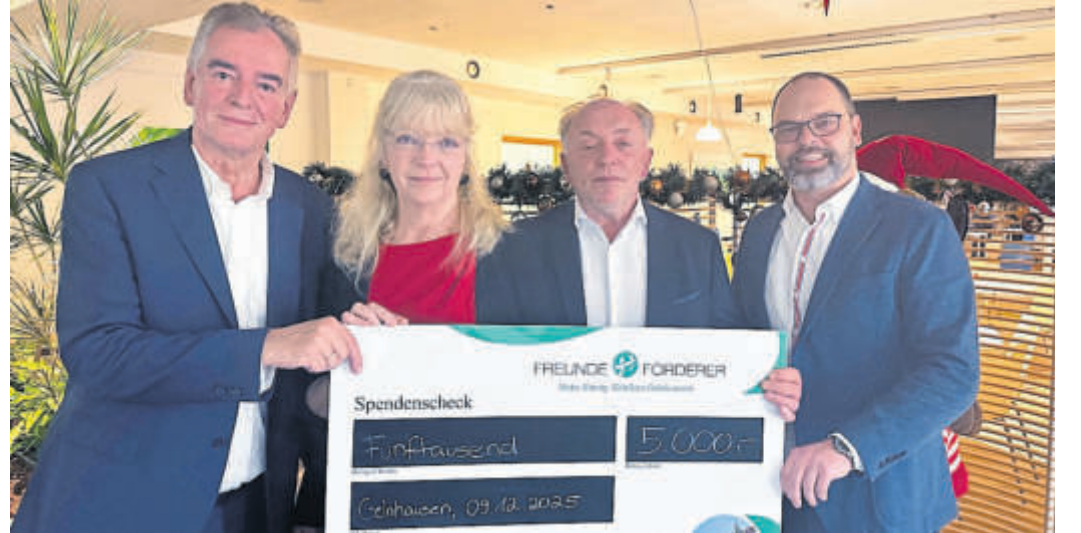
Mit 5.000 Euro die Palliativstation in Schlüchtern unterstützt

heit zu erobern. Das Programm dafür, so heißt es in der Pressemitteilung, beinhalte Ansätze, um die grundlegenden materiellen Probleme des Alltagslebens auf solidarische Weise und langfristig anzugehen – von den Mietkosten über eine menschenfreundliche Gestaltung des öffentlichen Raums bis zum Nahverkehrsangebot. Aber auch die Bildungs- und Kulturarbeit, sowie die Schaffung von Möglichkeiten zur politischen Mitwirkung gehören für den Ortsverband der Linken wesentlich zu dem, was eine Region lebenswert mache. BWB