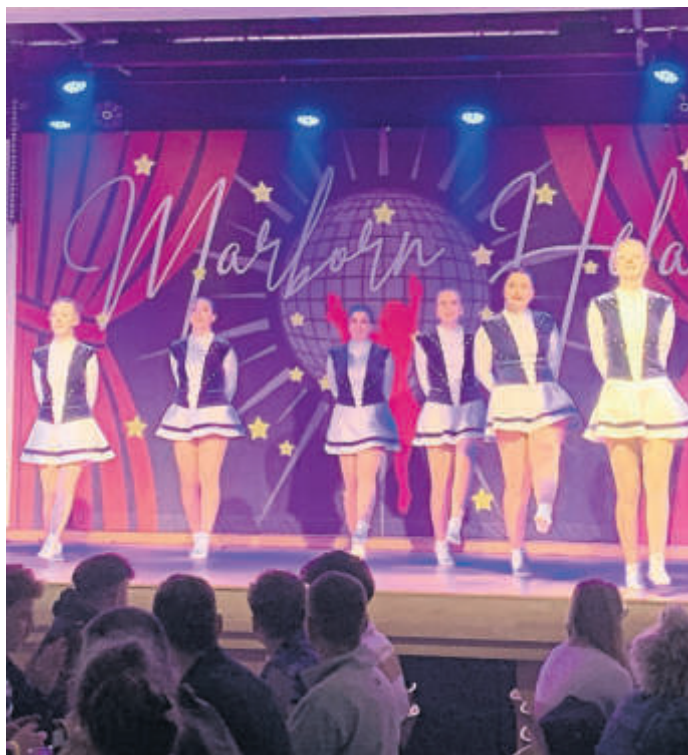
Die „Blue Diamonds“ vom Karnevalsverein Kikiriki Freiensteinau.

Die fünfstündige Abendveranstaltung mit über 20 Darbietungen war kaum zu toppen. Tanzmariechen, Männerballett und Garder- und Schautanz waren eine Werbung für den karnevalistischen Tanzsport. Inmitten von Alltag, Pflichten und Stress wird oft vergessen, was wirklich zu leben heißt. Der Tanz erinnert daran loszulassen, den Moment zu spüren. Wer die ausgelassene Stimmung in Marborn erlebt hat, kann nur zustimmen. CS