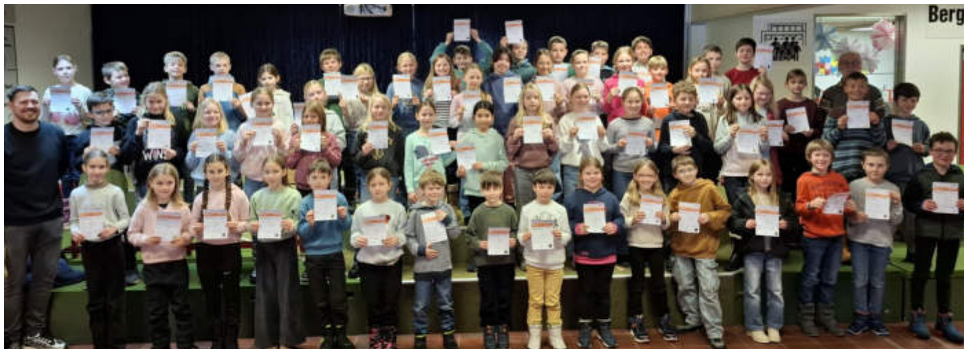
Fleißige Sportabzeichenabsolventinnen und -absolventen gab es im letzten Jahr an der Bergwinkel-Grundschule.