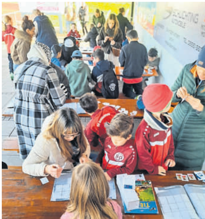
Auch die Mütter waren mit von der Partie und unterstützen die Kinder beim Einkleben der Sticker.