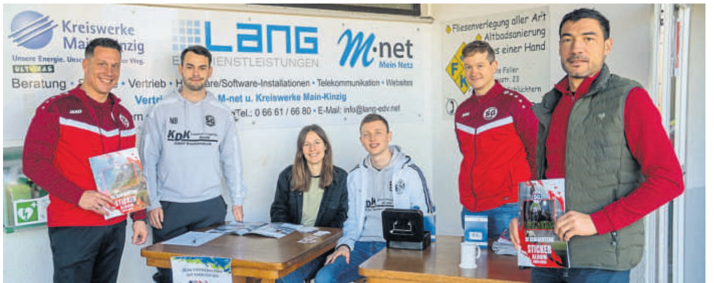
Große Freude herrschte bei SG-Mitgliedern und Besuchern über den gelungenen Startschuss für das Stickeralbum.