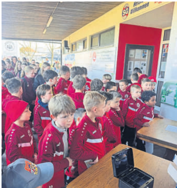
Ein großer Andrang herrschte beim Kick-off für das neue Stickeralbum auf der Auwiese.