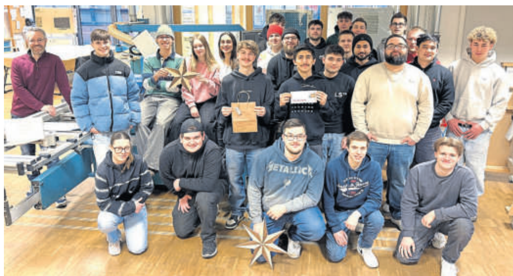
Die Tischler-Azubis freuen sich über ihre Auszeichnung als Publikumsliebbling und ihren Gewinn.