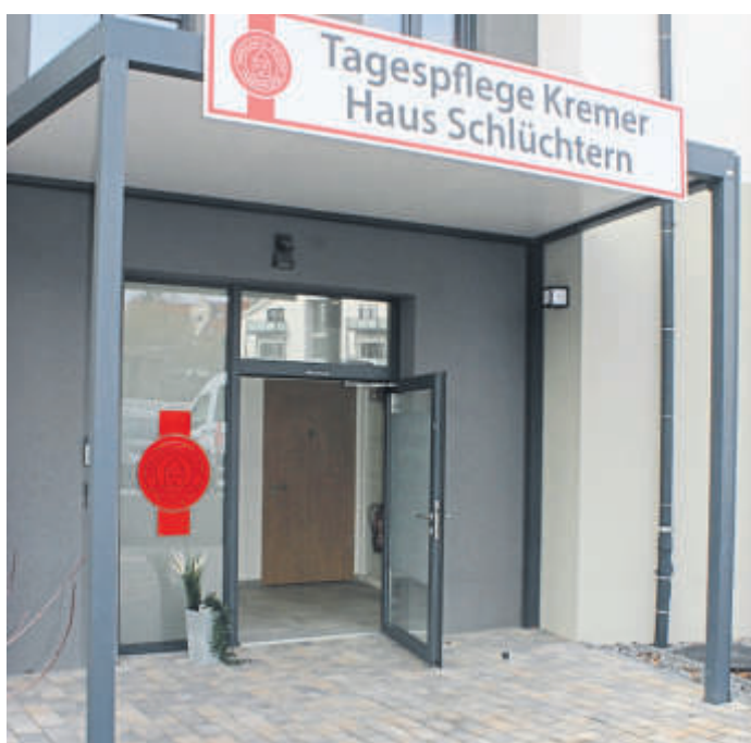
Der Eingang in der Elmer Landstraße 3.

und Beschäftigungen zählen zum Beispiel Zeitungsrunde, Seniorengymnastik, Spaziergänge, Gedächtnistraining, Bastelstunden oder Ausflüge in die Umgebung. Nach einer gemeinsamen Kochstunde folgt das Mittagessen und eine Ruhepause danach. Wer auch am Nachmittag weiterhin viel erleben will, kann am geplanten Nachmittagspro-