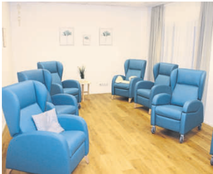
Ein Raum der Stille.

„Haus Schlüchtern“ kann in Schnuppertagen erlebt werden