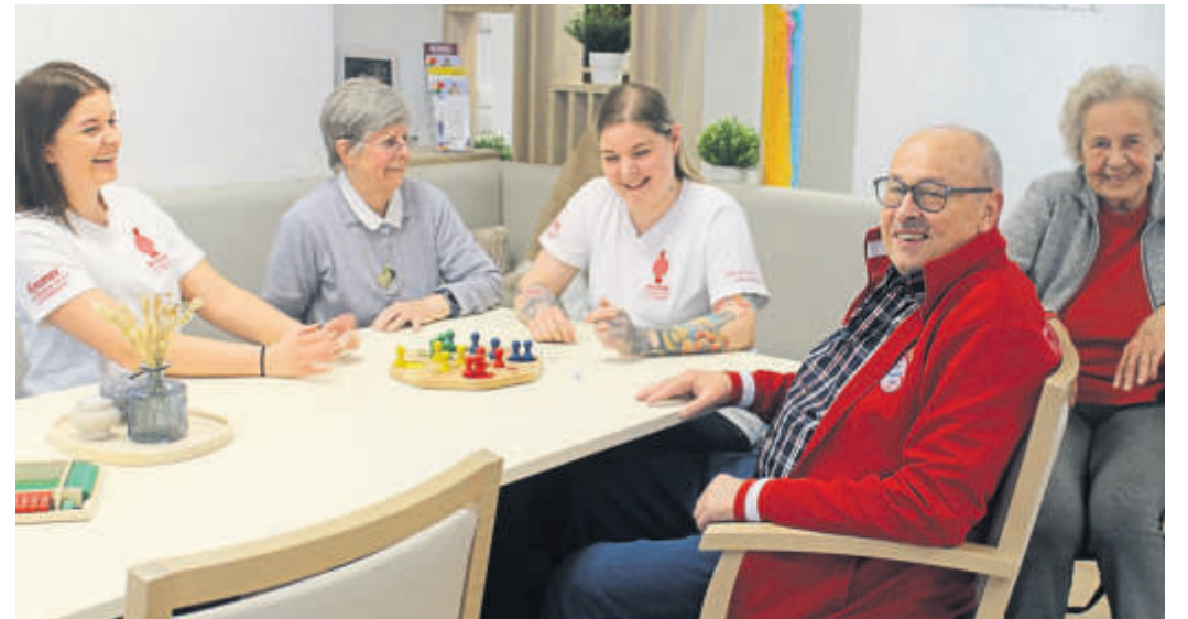
Im „Haus Schlüchtern“ erleben die Gäste Betreuung, Bewegung und Geselligkeit.

Eine Lösung bietet da die Tagespflege Kremer an: Die Betreuung im „Haus Schlüchtern“ läuft täglich nach klaren Strukturen ab. Tagsüber erleben die Gäste Betreuung, Bewegung und Geselligkeit, abends kehren sie zufrieden nach Hause zurück und können in ihrer vertrauten Umgebung, ihrem eigenen Bett schlafen. Die Tagespflegegäste werden am Morgen aus ihrer Wohnung abgeholt und in die Tagespflege gebracht. Hier können sie sich bei einem gemeinsamen Frühstück gemütlich unterhalten und entspannen in den Tag starten. Es folgt ein abwechslungsreiches Tagesprogramm, das von Pflegefachkräften und Betreuungskräften organisiert und durchgeführt wird. Zu den verschiedenen Freizeitaktivitäten