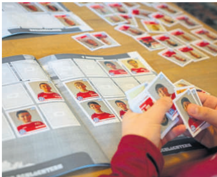
Insgesamt umfasst das Album 170 Sticker.

Erhältlich sind die Stickertüten bei Getränke Lambert, Tourismusbüro (beides Schlüchtern) und bei den Heimspielen der SG. BWB