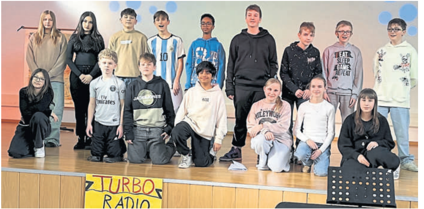
Seit Mitte Januar arbeiteten die Schülerinnen und Schüler im Unterricht intensiv an ihrer eigenen Live-Radio-Show, die dann in der in der Schulturnhalle über die Bühne ging.

WAHLERT – Die Zeit vergeht in Riesenschritten und damit nähert sich auch der Termin für das Fest „700 Jahre Wahlert“ am 13. und 16. Juni dieses Jahres. Seit einigen Jahren treffen sich verschiedene Arbeitsgruppen regelmäßig zur Planung des Festes mit einem abwechslungsreichen Angebot und Programm. Für das Fest soll Wahlert natürlich auch passend herausgeputzt werden. Deshalb lädt der Arbeitskreis 700 Jahre Wahlert für Samstag, 31. März, zum Arbeitseinsatz rund um das Gemeindehaus ein. Auf dem Plan stehen laut Pressemitteilung unter anderem die Reinigung und Teilrenovierung der Garagen, die Pflege der Gewächse am Hang und weitere Arbeiten. Der Arbeitseinsatz beginnt um 8 Uhr. Angesprochen sind vor allem Mitglieder der Vorbereitungsgruppen aber auch jede weitere helfende Hand ist willkommen. BWB