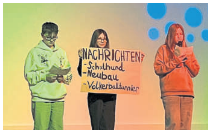
Nachrichten, Werbung, Wetterberichte – die Schülerinnen und Schüler entwickelten die Inhalte selbstständig.