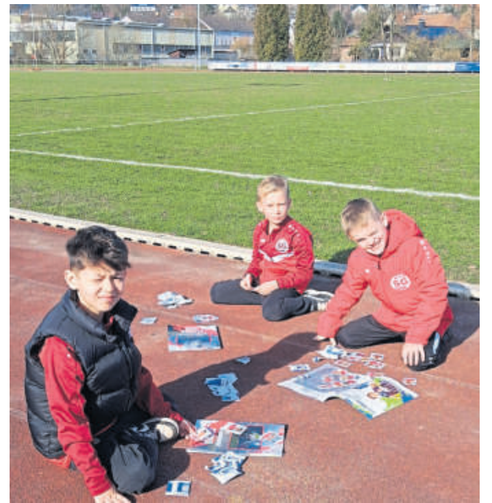
Die Tartanbahn eignete sich an diesem Tag hervorragend für das Sichten und Tauschen der Klebebilder.