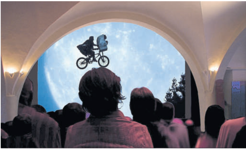
E.T. – Der Außerirdische (USA 1982, Regie: Steven Spielberg) lief im September 1997 in KuKi.

Und doch blieb die Geschichte präsent. Gleich im Eingangsbereich wird das Bewusstsein für die Geschichte dieses Ortes wachgehalten. Den Eintretenden und allen Besuchern des Filmkinotheaters soll spürbar werden, welche ursprüngliche Funkti-