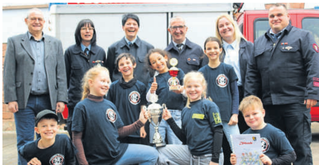
Die Feuerwehr Weichersbach stellte die beste Kinder-Mannschaft.