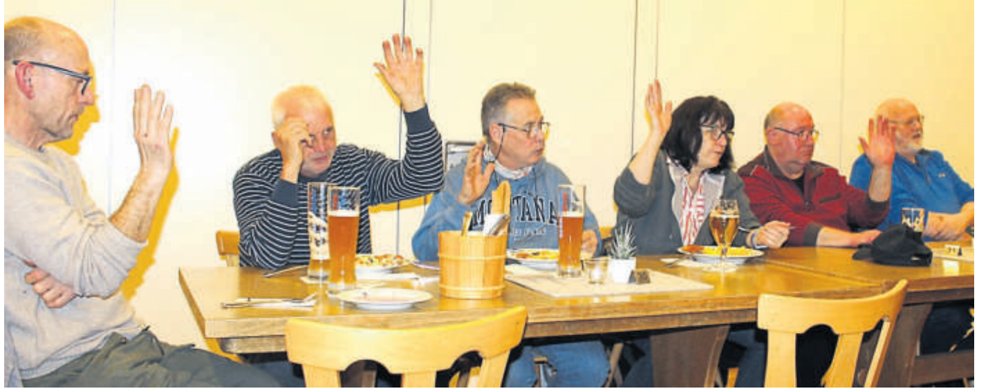
Die Mitglieder des Gewerbevereins Sinntal (unser Foto zeigte einige der Versammlungsteilnehmer) fassten einstimmige Beschlüsse.