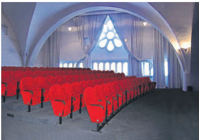
Die roten Sitze verbinden ehemalige Gäste bestimmt mit den vielfältigsten Erinnerungen.

Das Kuki zahlte Nutzungsentgelt pro durchgeführte Veranstaltung von je 80 DM