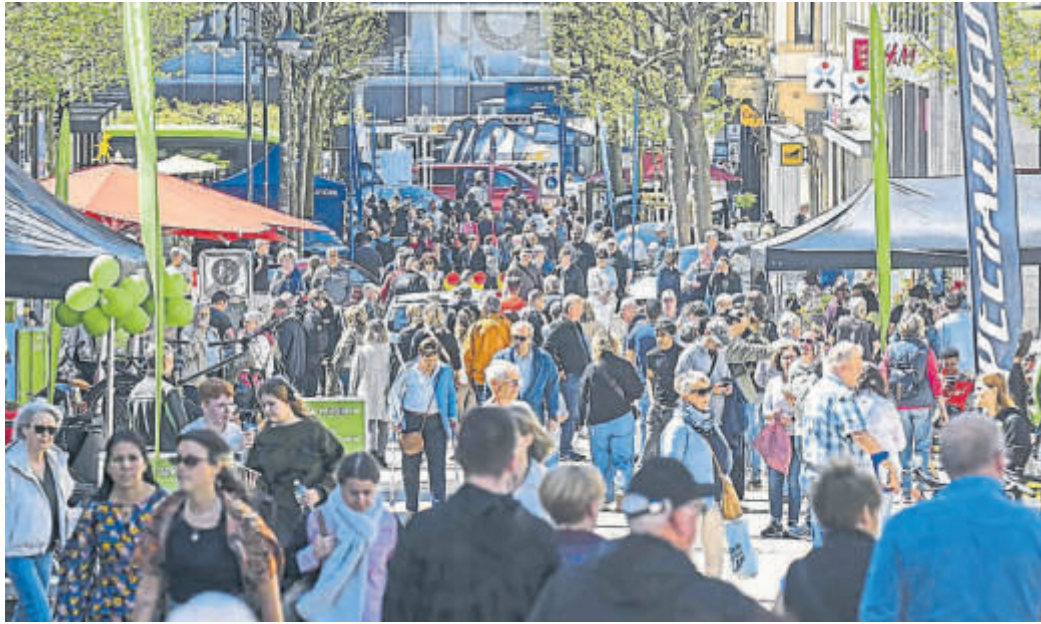
Tausende strömten bei der fulda.mobil.erleben 2025 durch die Fuldaer Innenstadt.

Die Fuldaer Zeitung ist mit einem eigenen Stand vertreten, beim Briefkastenwettbewerb beweisen die Messebesucher ihr Geschick und können so Karten für einen besonderen Lorient-Abend gewinnen. Für die jüngsten Gäste bietet eine Hüpfburg