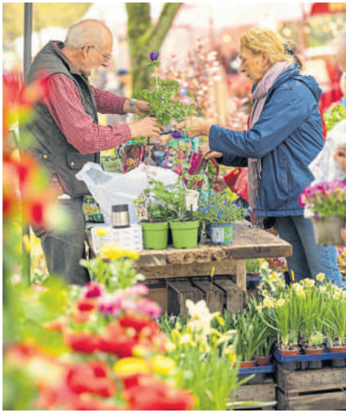
Zum Gartenfest Laubach dürfen sich Pflanzenliebhaber auf eine außergewöhnlich vielfältige Auswahl freuen.

gartenfestivals.de Telefon (0561) 40096160