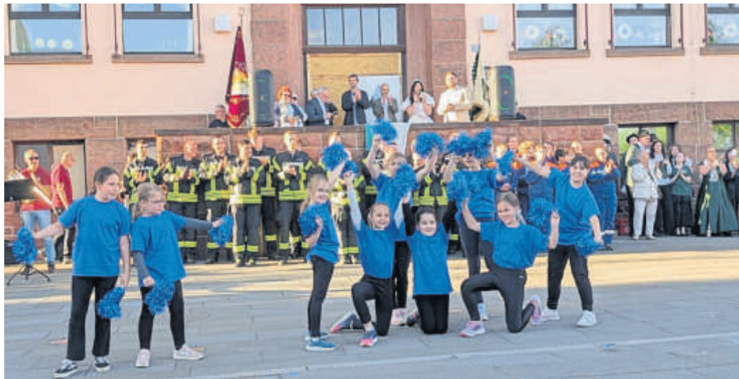
Tanzgruppen sorgten für die gute Unterhaltung der Gäste.

Die Maibaumaufstellung zeigte einmal mehr, wie lebendig das Vereinsleben in Bad Soden-Salmünster ist und wie wichtig solche gemeinschaftlichen Veranstaltungen für den Zusammenhalt vor Ort sind. Ein gelungener Abend, der allen Beteiligten und Gästen noch lange in Erinnerung bleiben wird. BWB