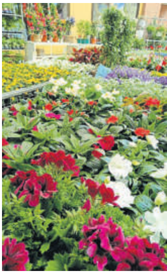
Eine tolle Farbenpracht – ob violett, rot, pink, gelb oder weiß – die Blumen leuchten in ihrer Vielfalt.