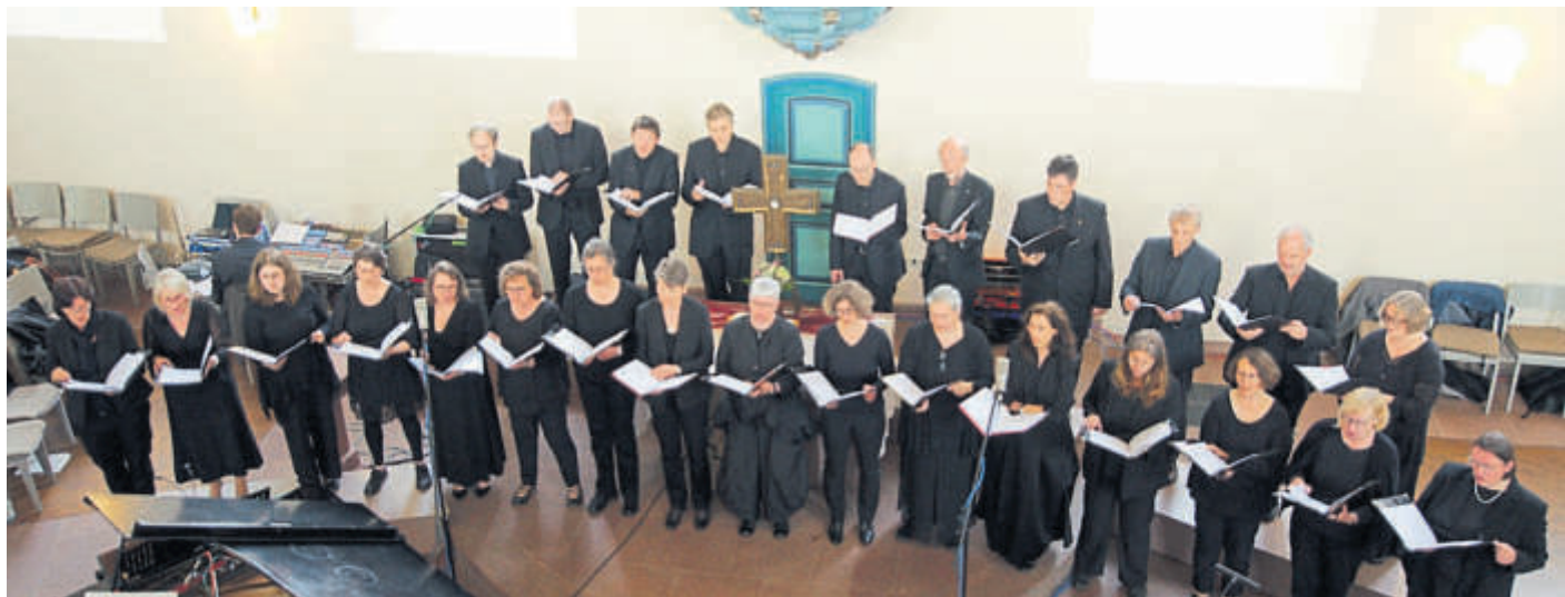
Der „Nord-Süddeutschen Kammerchor“ gibt am 17. Mai ein Konzert in der Reinhardskirche Steinau.