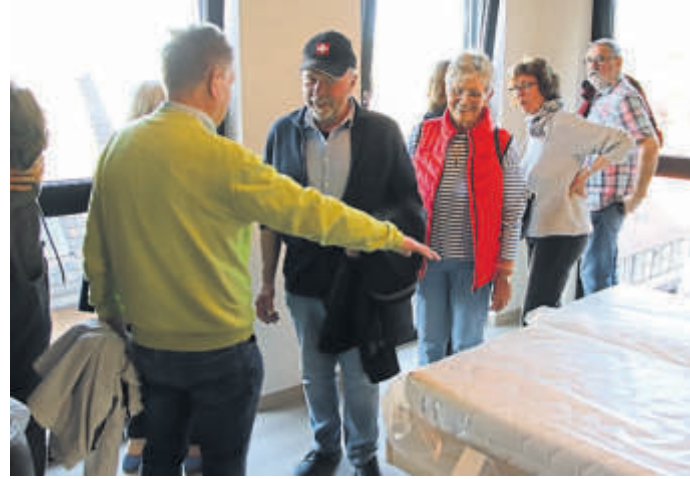
Erholenden Schlaf finden die Gäste in dem „Boarding Hotel“ über den Dächern von Schlüchtern.

In den Etagen eins und zwei, die beide mit einem Aufzug barrierefrei erreichbar sind, entstanden hoch-