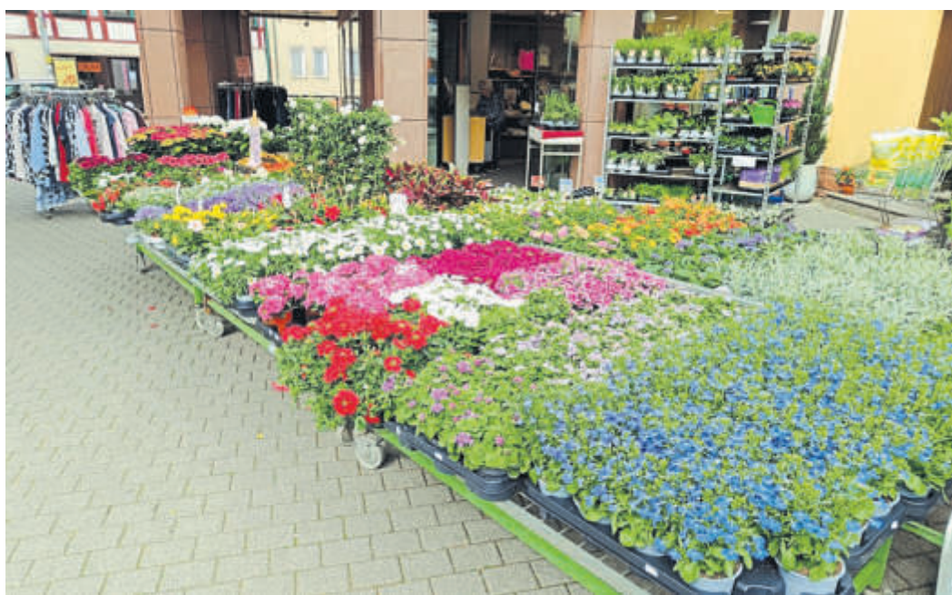
Ein hübscher und liebgewonnener Anblick: Eine große Auswahl an Blumen und Pflanzen vor dem Modehaus Rech.

Sohn Thomas führt also eine Tradition fort, die, so der Senior-Chef, „Schlüchtern nicht verlieren darf“. Auch er hofft, dass in der Bergwinkel-Stadt weiterhin Blumen-Schönheiten vor dem Modehaus angeboten werden. Wer auf der Suche nach farbenfrohen Blumen und hübschen Pflanzen ist, für den heißt es: Auf zu Rechts Blumen, schauen, kaufen und Freude daran haben.