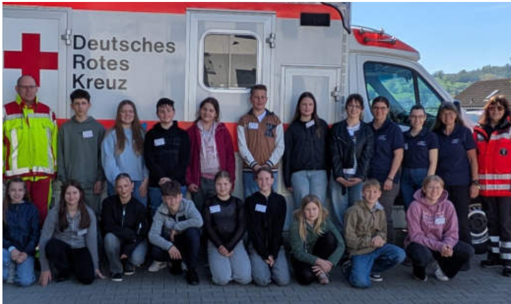
Anlässlich des bundesweiten Girls' & Boys' Day öffnete das Deutsche Rote Kreuz auch in Schlüchtern die Türen für Schülerinnen und Schüler.

Ziel des Aktionstages war es, jungen Menschen praxisnahe Einblicke in die vielfältigen Aufgaben des DRK zu ermöglichen und Interesse für soziales Engagement sowie berufliche Perspektiven beim Roten Kreuz zu wecken. Zahlreiche Teilnehmende nutzten die Gelegenheit. Dabei stand nicht das Zuschauen, sondern vor allem das aktive Mitmachen im Mittelpunkt. Von Grundlagen der Ersten Hilfe über Einblicke in den Rettungsdienst bis hin zu praktischen Übungen bot der Girls' & Boys' Day ein abwechslungsreiches Programm mit echtem Praxisbezug. Ein besonderer Schwerpunkt lag auf der Vorstellung der Arbeit im Rettungsdienst. An beiden Standorten konnten die Jugendlichen einen Rettungswagen besichtigen, dessen Ausstattung kennenlernen und erfahren, welche Ab-