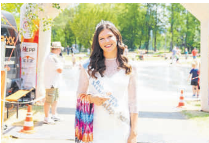
Ein Ehrenamt mit Strahlkraft. Für die Repräsentanz der Kurstadt wird eine engagierte Nachfolge gesucht.

BAD SODEN-SALMÜNSTER – Die Kurstadt Bad Soden-Salmünster schreibt die Position der Salzrepräsentanz neu aus. Gesucht wird eine engagierte Persönlichkeit für das Ehrenamt der Salzprinzessin oder