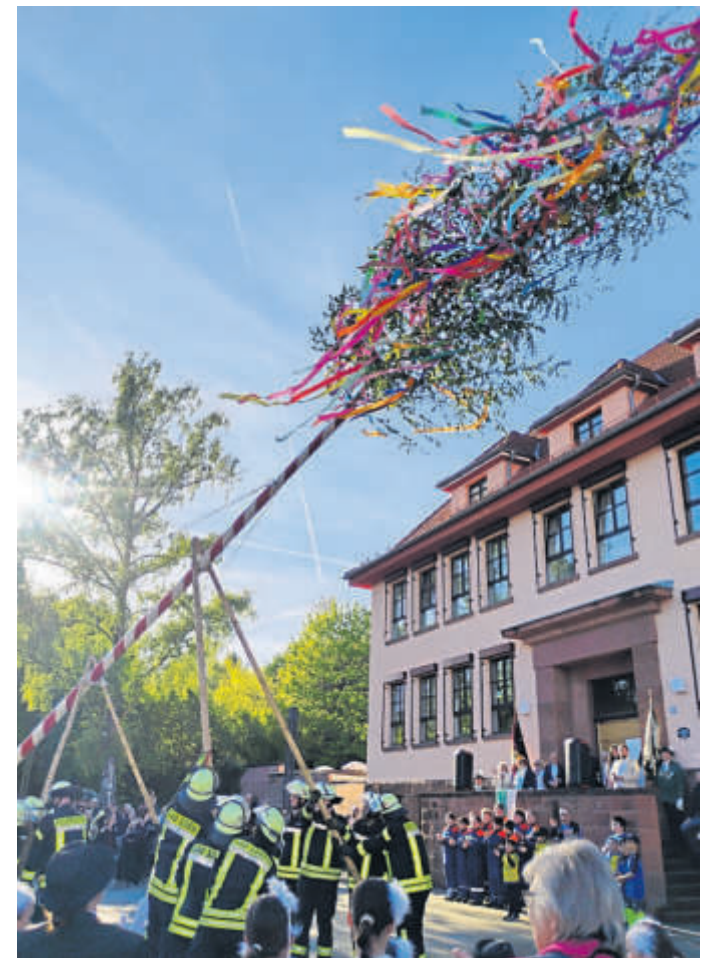
Mit vereinten Kräften hieften die Feuerwehrlaute den Maibaum in die Höhe.