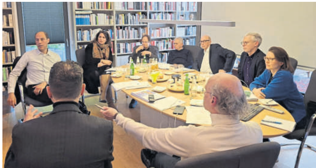
Der neu konstituierte Beirat wird zukünftige Projekte des Vereins „Freunde der Synagoge in Schlüchtern“ fachlich begleiten und unterstützen.