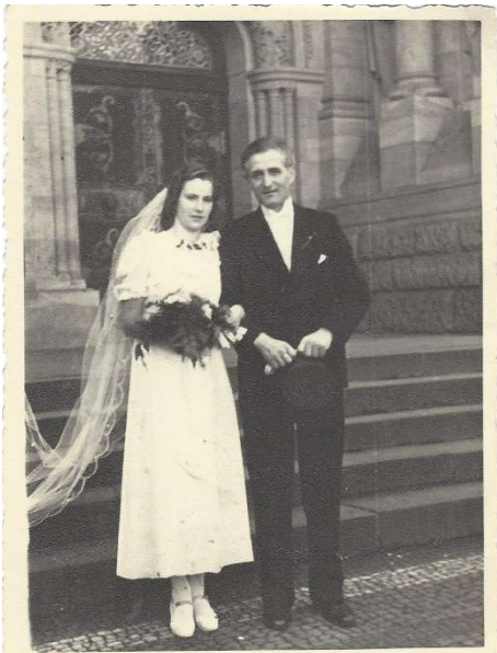
Kirchliche Trauung in Bad Homburg am 28.09.1946