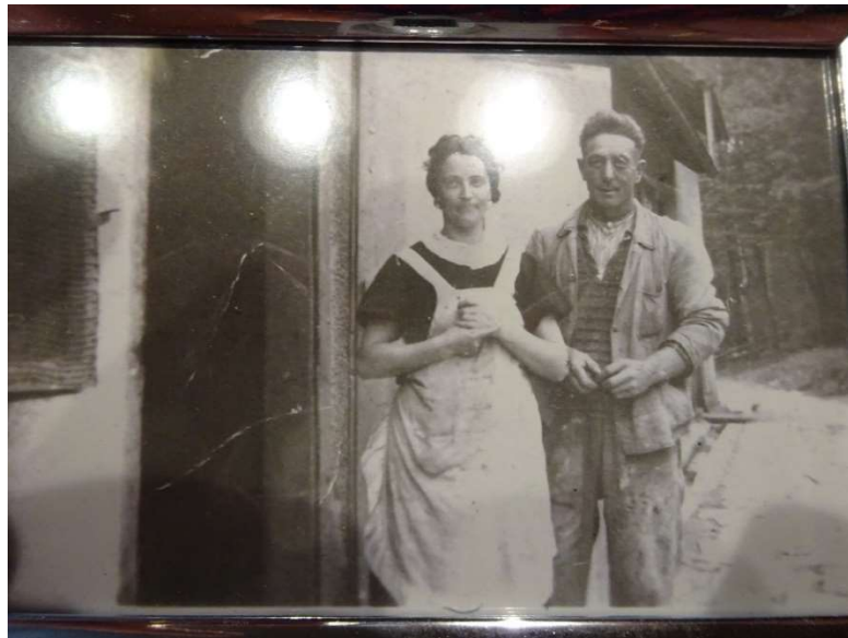
Hier das Ehepaar