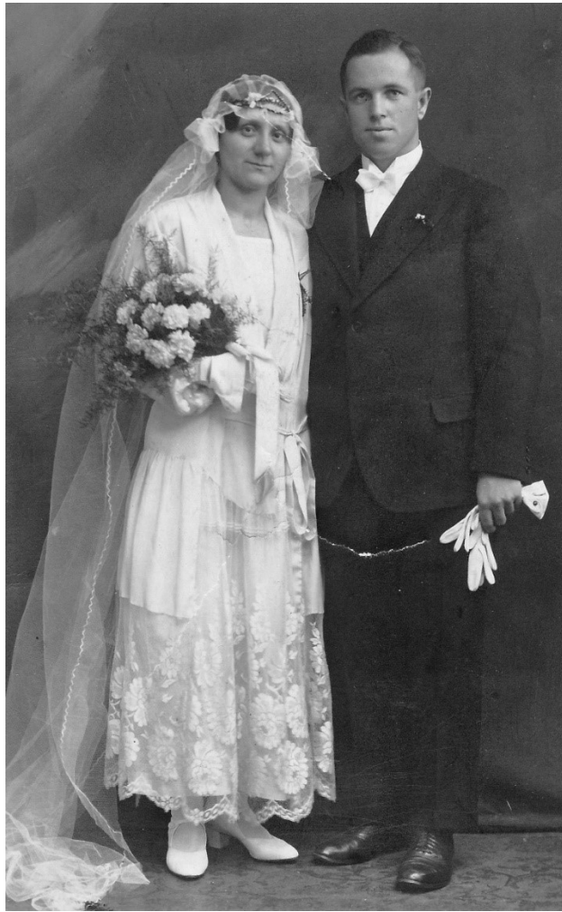
Hochzeit am 06.10.1932 in Oberursel