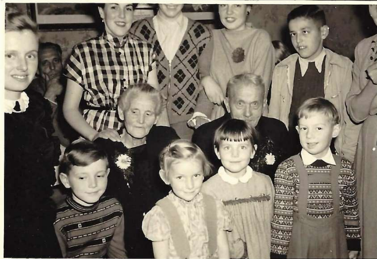
Diamantene Hochzeit am 27.10.1954