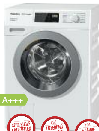
Miele Waschmaschine WDB 330 WPS

Finanzkauf 0% Jahreszins 12 Monate / 66,58 € monatlich