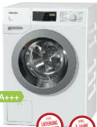
Miele Waschmaschine WDD 035 WCS