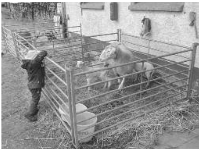
Foto unten: Die Lämmerschlupp-Kinder dürfen beim Füttern der Flaschenlämmer helfen - Bericht auf der linken Seite

Das TheodoBo gibt in seinem neusten Programm folgende Antwort: Das alles! Die Widersprüche und Gegensätze, die sich eigentlich nicht