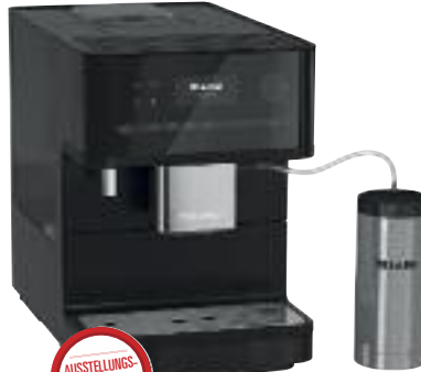
Miele Kafeevollautomat CM6350 schwarz

Finanzkauf 0% Jahreszins 12 Monate / 54,08 € monatlich