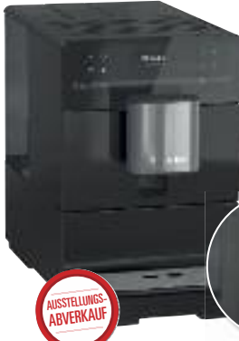
Miele Kafeevollautomat CM5300 schwarz