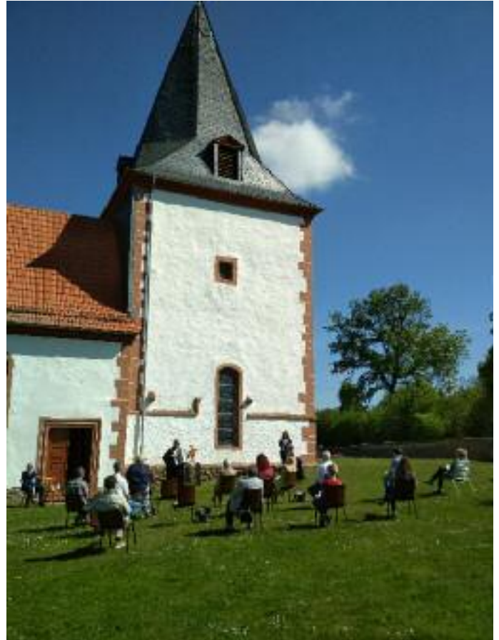
Foto oben: Himmelfahrtsgottesdienst der Kirchengemeinde Kirchbracht/Lichenroth

Die standesamtliche Trauung findet am 06.06.2020 in Oberndorf statt. Aus gegebenem Anlass findet die Trauung nur im engsten Familienkreis statt.