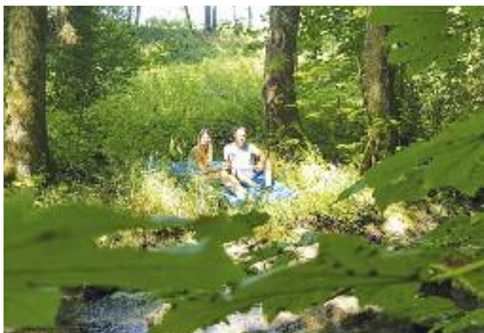
Foto: Picknick am Reichenbach in Birstein - siehe Bericht auf S. 15