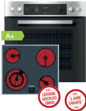
Miele Einbau-Herdset H2267-1EP / KM 6003