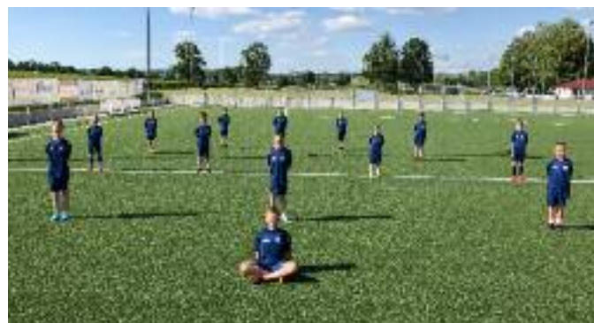
Foto oben: die E-Junioren der JSG Birstein beim ersten Training letzten Freitag - Bericht auf Seite 5.