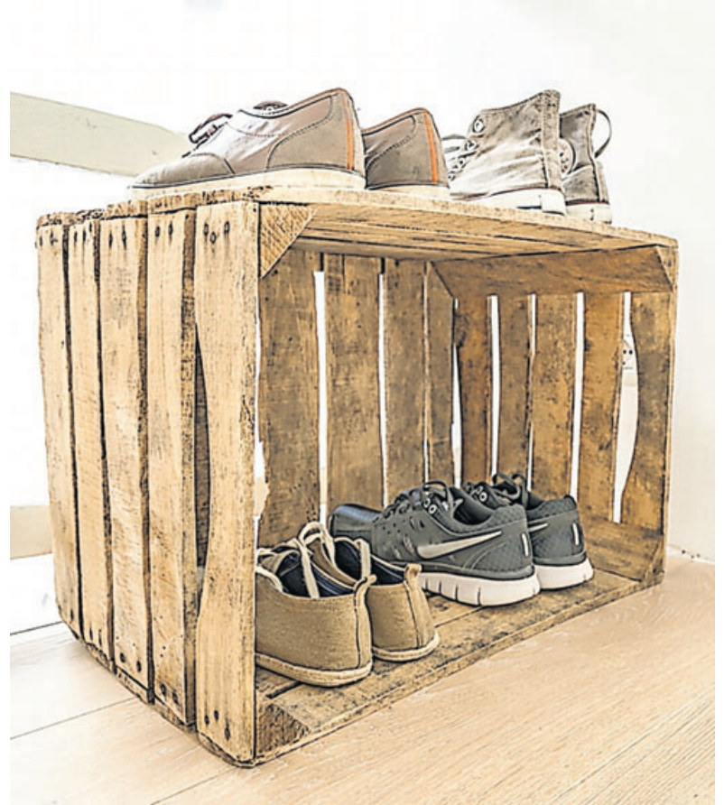
Im Trend: Vintage-Flair durch Fundstücke.

Viele alte Holzmöbel sehen mit Gebrauchsspuren sogar noch schöner aus. Liebhaber des „Shabby Chic“-Stils schwärmen von der besonderen Patina alter Möbelstücke. In modernen Wohnungen mit frisch gestrichenen Wänden bilden diese Möbel mit ihren Kratzern und Dellen oder abgeblättertem Lack einen interessanten Kontrast.