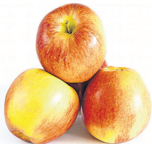
Äpfel sind gesund, es sei denn ...

Wenn fruchtzuckerhaltige Lebensmittel mit Eiweiß wie Joghurt oder Quark oder Fett kombiniert werden, ist Fruktose bekömmlicher. Geeignet sind auch Lebensmittel, die neben Fruktose Traubenzucker (Glukose) enthalten. Sind beide im passenden Verhältnis enthalten (etwa in Bananen und Brokkoli), wird Nah-