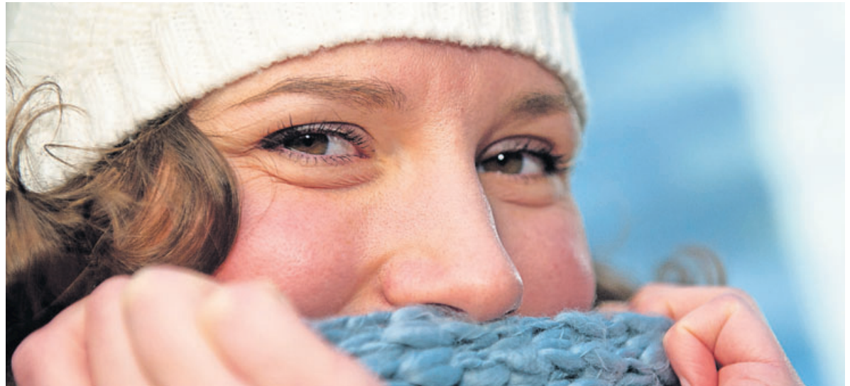
Bei Frost braucht die Haut eine Extraportion Pflege – Öle oder fettreiche Cremes sind dann eine gute Wahl.

Der VKE-Kosmetikverband in Berlin empfiehlt, der Haut neben der täglichen Pflege ab und an et-