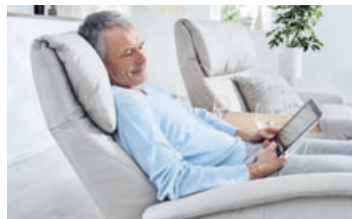
Mit der individuellen Einstellung für den Kopf wird das Lesen oder das Fernsehen noch bequemer.