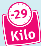
Svenja Grabe 63486 Bruchköbel

„Durch easylife habe ich gelernt auf meinen Körper zu achten und ihm das zu geben, was er wirklich braucht!“