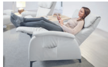
Platzsparend und optimal für kleine Räume – die Herz-Waage-Position ist jetzt auch in Sitzgarnituren möglich.