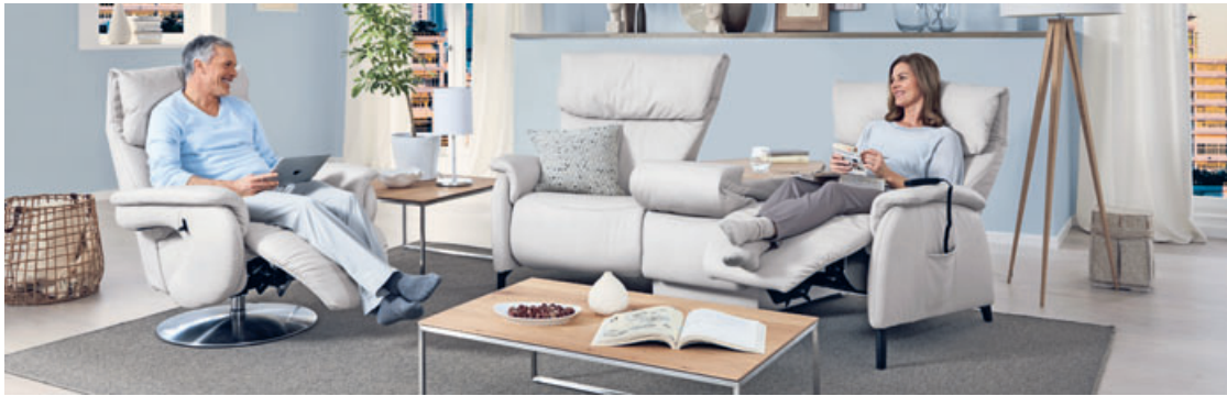
Ob Sessel, Sofa oder Wohnlandschaft – zahlreiche von Polster Aktuell entwickelte Innovationen sind in vielen Polstermöbeln zu finden und beflügeln den Komfort. Einfach mal in aller Ruhe ausprobieren und bei Gefallen den 500-Euro-Kennenlerngutschein* nutzen.