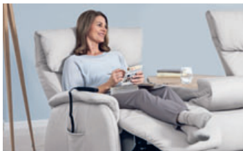
Bequemlichkeit auf Knopfdruck: Relaxfunktionen sind jetzt auch in Designsofas zu haben.

und zwar platzsparend. Während die Kopfstütze sich langsam senkt, rollt sich das Fußteil nach oben und zwar so hoch, wie man das von Relaxsesseln kennt. Dann liegen die Füße ebenso hoch wie der Oberkörper. Diese Haltung bewirkt eine optimale Durchblutung und Entlastung für Herz und Kreislauf. Eine weitere wichtige Rolle spielen die Topperauflagen. Sie haben sich im Matratzenbereich bewährt, und sorgen nun als oberste Lage der Orthopädi-