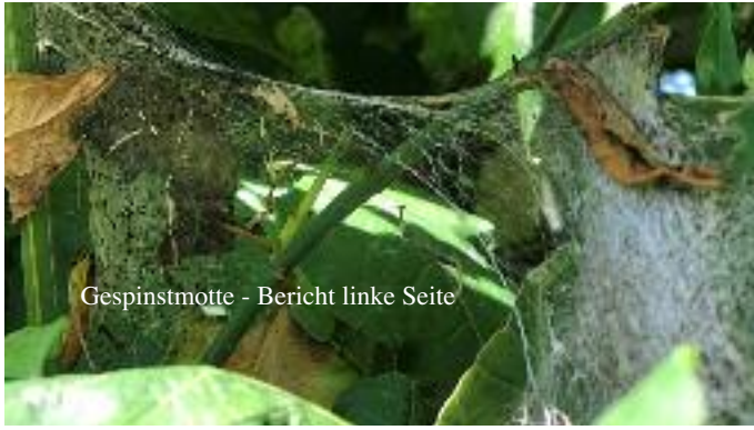
Gespinnstmotte - Bericht linke Seite