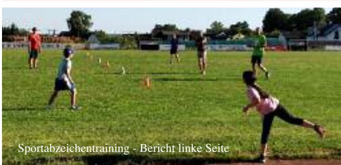
Sportabzeichentraining - Bericht linke Seite