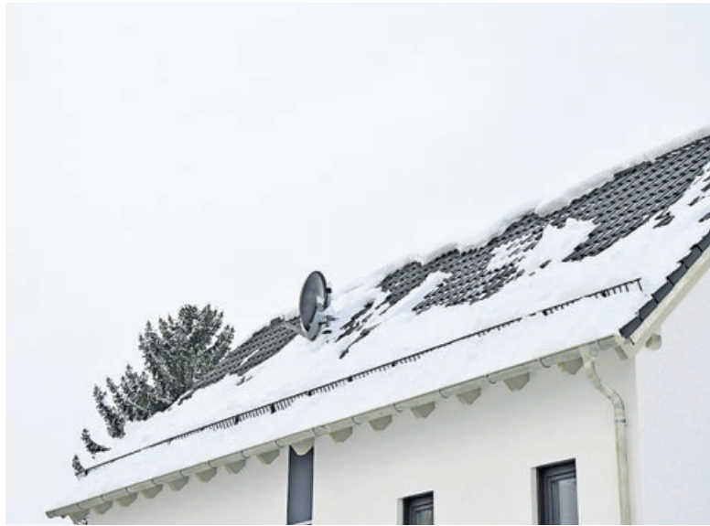
Schnell abtauender Schnee auf dem Dach kann ein erster Hinweis auf einen Optimierungsbedarf der Dämmung sein.

Expertenschätzungen zufolge können Kleinf Feuerungsanlagen – also Heizungen – für bis zu 16 Prozent der Feinstaubbelastung verantwortlich sein. Neben einer Optimierung der Verkehrslogistik ist also auch die Optimierung der Gebäudedämmung ein wichtiger Schritt zur Umweltentlastung. Denn je weniger mit einer guten Wärmedämmung geheizt werden muss, desto geringer ist der Primärenergiebedarf und damit der