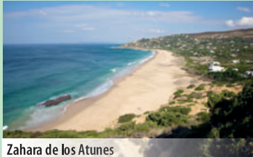
Zahara de los Atunes