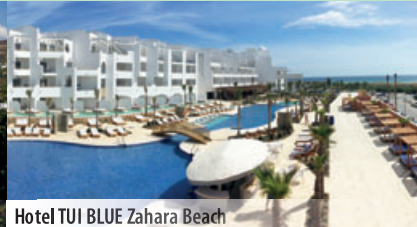
Hotel TUI BLUE Zahara Beach