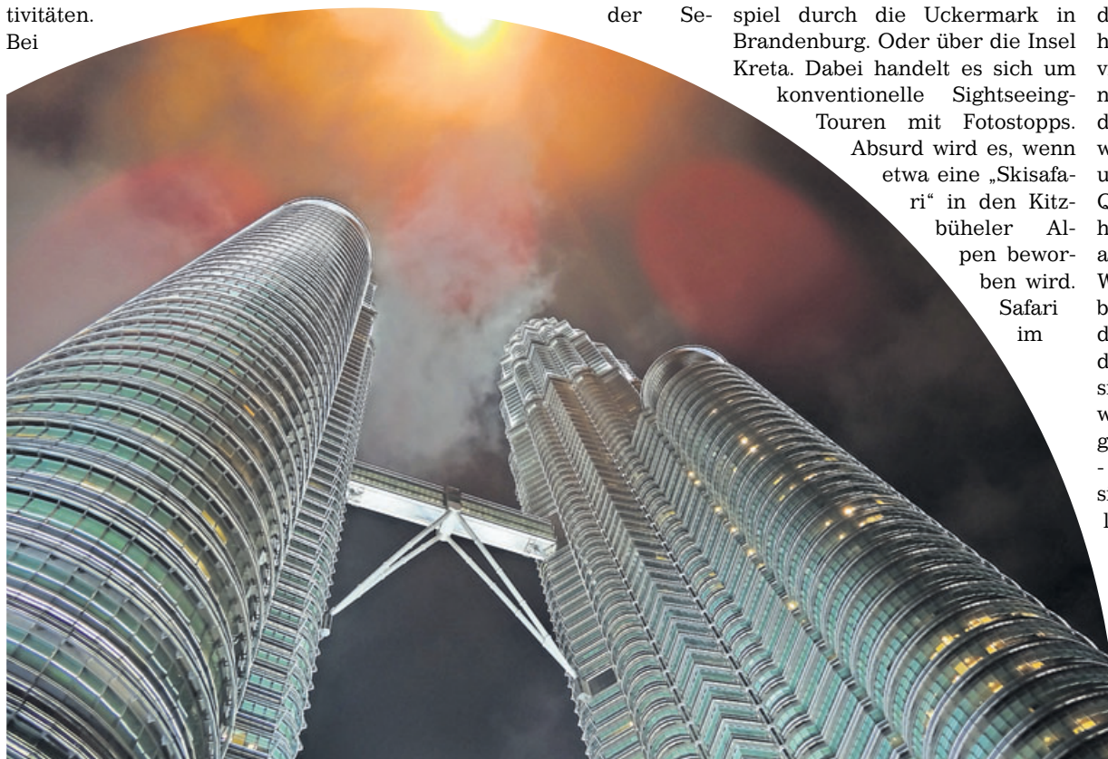
Die Petronas Towers in Kuala Lumpur: Wenn es um asiatische Reiseländer geht, ist von „Tradition und Moderne“ die Rede - was sich zweifellos überall finden lässt.

- Tradition und Moderne: Ein Klassiker aus dem Reisekatalog. Was liest der Profi aus den Schlagworten? „Widersprüchliches in unharmonischer Weise aufeinander treffend, aber als gewollt gestaltet verkauft“, sagt Kirstges. In der Tat dürfte es kein Land auf der Welt geben, in dem Tradition und Moderne nicht nebeneinander existieren. Das Begriffspaar klingt aufregend, ist aber nichtssagend.