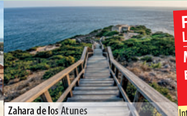
Zahara de los Atunes

Für Schnellbucher Limitiertes Kontingent Mo 11.05. - Mo 18.05.2020 EZZ € 230,-* € 559,- p.P. anstatt € 831,- Internet-Code: A20AHANG