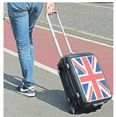
Für Großbritannien-Reisende aus den EU-Staaten ändert sich erst einmal nichts.