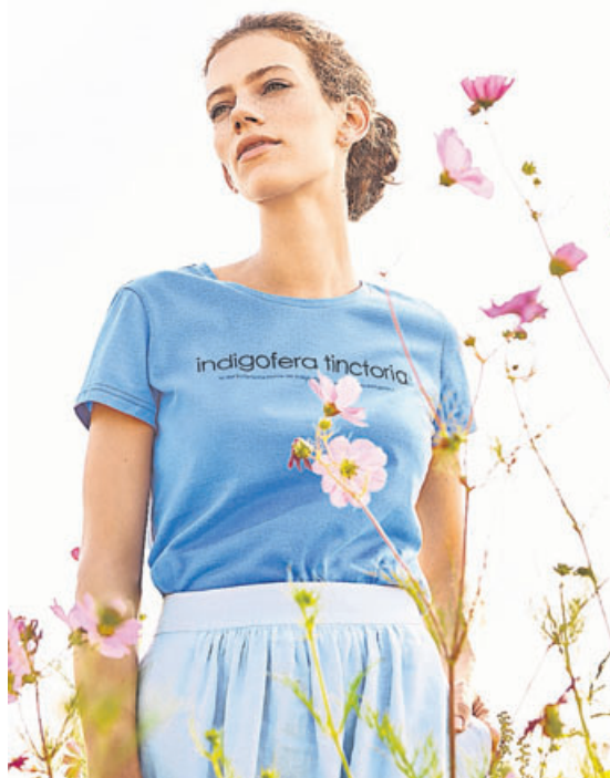
Hessnatur zum Beispiel produziert seine Mode gemäß den Anforderungen des Global Organic Textile Standards (GOTS) und der Fair Wear Foundation.