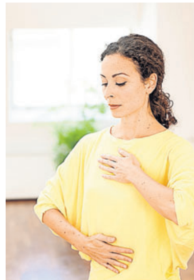
Atemübungen sind typisch für ein Achtsamkeitstraining.

Die Übung der Achtsamkeit kann uns helfen, Gelassenheit und innere Ruhe zu entwickeln in einer Welt, die von vielen als beschleunigt und unsicher erlebt wird. Allein durch das Smartphone haben wir die Möglichkeit, uns permanent abzulenken. Das machen wir ja auch. Wenn man drei Minuten auf die Bahn warten muss, kommt automatisch der Griff nach dem Smartphone. Diese Zerstreuung hat Aus-