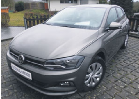
VW Polo „Comfortline“ 1.0 TSI 70 kW/95 PS DSG

Klimaanlage, Einparkhilfe vorne/hinten, Nebelscheinwerfer mit Abbiegelicht, Radio „Composition Media“ mit Bluetooth, Multifunktions-Lederlenkrad, Vordersitze beheizbar