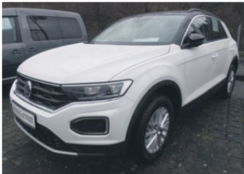
VW T-Roc 1.5 TSI 110kW/150PS DSG

Multifunktions-Lederlenkrad mit Schaltwippen, Sitzheizung vorne, Außenspiegel anklappbar, Radio „Composition Media“ mit Bluetooth, App Connect, Reserverad, Diebstahlalarmanlage, Mittelarmlehne vorne, Fernlichtassistent, ACC inkl. City-Notbremsfunktion und „Front Assist“, Climatronic, Licht- + Sichtpaket, Einparkhilfe vorne/hinten, Dachreling schwarz, Navigationssystem Discover Media, Winterpaket, LED-Scheinwerfer, Verkehrszeichenerkennung, Anhängerkupplung abnehmbar