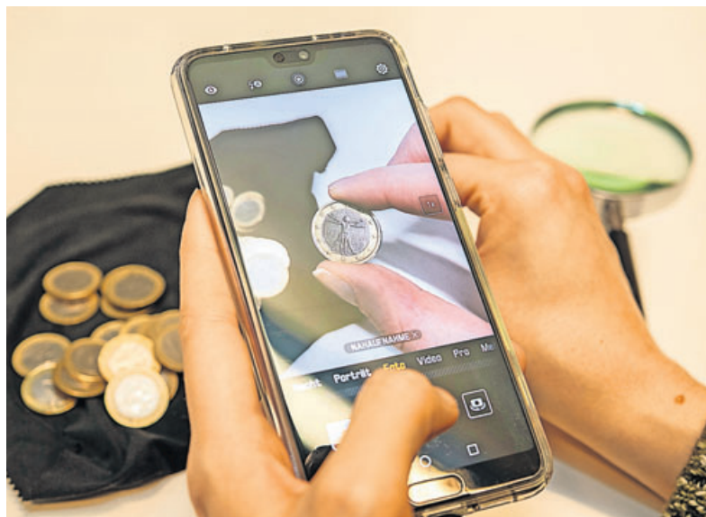
Ein Foto kann helfen herauszufinden, ob es sich wirklich um eine Fehlprägung handelt.

Falsches Material und Verschiebungen steigern den Wert