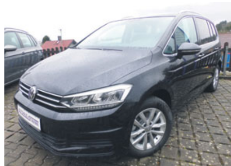
VW Touran 1.5 TSI Maraton Edition 110kW

Anhängerkupplung elektrisch, Climatronic, Navigationssystem Discover Media, LED-Scheinwerfer, 7 Sitze, PDC vorne/hinten, ACC adaptiver Tempomat bis 210km/h, „Front Assist“, erweiterte Garantie 4 Jahre/80.000km, ergoActive-Sitz, Seitenscheiben hinten+Heckscheibe abgedunkelt, Multifunktions-Lederlenkrad, Dachreling silber eloxiert