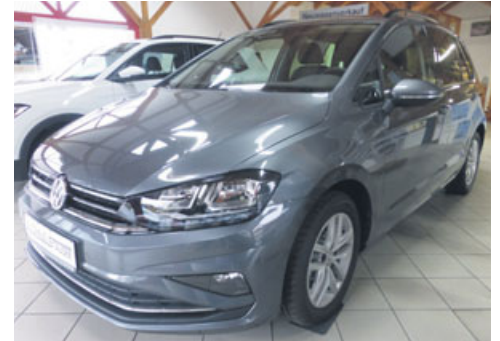
VW Golf Sportsvan „Comfortline“ DSG

Climatronic, PDC vorne/hinten, Radio „Composition Media“, Navigationssystem „Discover Media“, Bluetooth, ACC bis 210km/h „Front Assist“, Geschwindigkeitsregelanlage, Dachreling, ErgoActive Sitz mit Sitzheizung vorne, Licht- + Sichtpaket, Nebelscheinwerfer, Indiumgrey Metallic, nach Abgasverfahren WLTP2/EURO6 DG