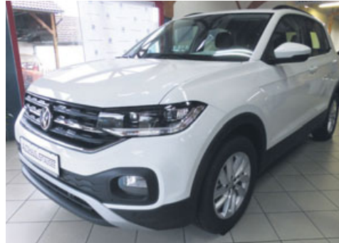
VW T-Cross Life 1.0 TSI 95 PS (70kW) 5-Gang-Schaltgetriebe

Scheinwerfer LED, Parksensoren vorn/hinten, Climatronic, Regensensor, Coming/Leaving Home, Multifunktions-Lederlenkrad, Alarmanlage, Radio „Composition Media“, Fußgängererkennung, LM-Felgen Belmont 16