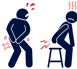
Juckreiz oder Schmerzen sind häufig Symptome bei Hämorrhoiden

Was viele nicht wissen: Jeder hat Hämorrhoiden! Hämorrhoiden sind Gefäßpolster, die zusammen mit den Schließmuskeln den Darmausgang abdichten. Vergrößern sich die Hämorrhoiden dauerhaft, weil sich Blut in ihnen staut, sprechen Mediziner vom Hämorrhoidalleiden – im Volksmund oft nur „Hämorrhoiden“ genannt. Eine Ursache hierfür kann zum Beispiel regelmäßiges zu starkes Pressen beim Stuhlgang sein. Sind die Hämorrhoiden vergrößert, reibt der Stuhl daran. Dies führt zu Entzündungen. In der Folge treten unangenehme Symptome wie Brennen, Juckreiz, Nässen bis hin zu leichten Blutungen auf. Viele Betroffene behandeln ihr Hämorrhoidalleiden mit Salben. Doch es gibt ein Arzneimittel namens Lindaven (Apotheke, rezeptfrei), das