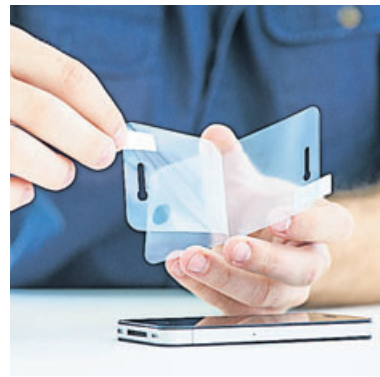
Das Aufbringen einer Display-schutzfolie sieht kompliziert aus – ist es aber nicht.

Die Entscheidung für ein Produkt sollte man vor allem vom gewünschten Härtegrad der Schutzschicht abhängig machen,