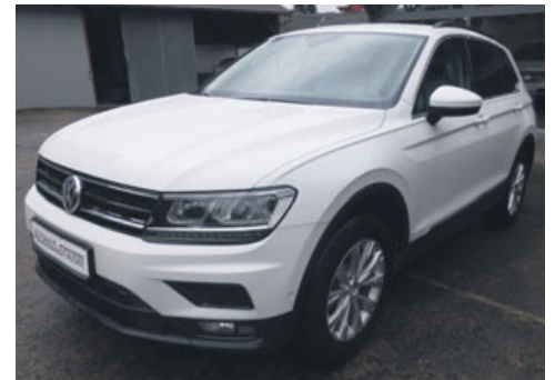
VW Tiguan 1.5 TSI 150PS DSG Comfortline

Fernlichtassistent, ACC bis 210km/h „Front Assist“ + City ANB, Verkehrszeichenerkennung, Diebstahlwarnanlage, Multifunktions-Lederlenkrad, Seitenscheiben + Heckscheibe abgedunkelt, „Keyless-Entry“, Climatronic, LED-Scheinwerfer, Alufelgen 17“, Navigationssystem Discover Media, Winterpaket, Spiegelpaket, Verkehrszeichenerkennung, Einparkhilfe vorne/hinten mit Rückfahrkamera, Parklenkassistent