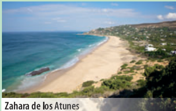
Zahara de los Atunes