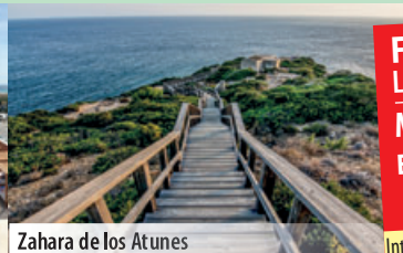
Zahara de los Atunes