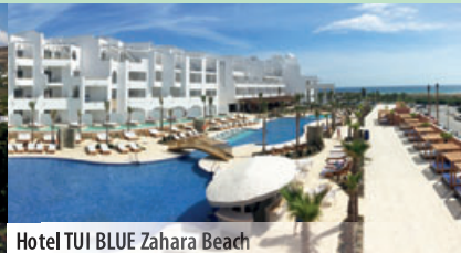
Hotel TUI BLUE Zahara Beach