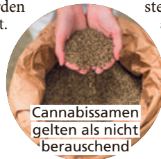
Cannabissamen gelten als nicht berauschend

Cannabis gilt als eine der ältesten traditionellen Pflanzen. Schon vor Tausenden von Jahren wurden ihre Blüten vielfältig genutzt. Wissenschaftlern ist es nun gelungen, aus den Samen einer speziellen Cannabispflanze ein wertvolles Öl zu gewinnen. Das Geniale: Cannabissamen haben keine berauschende Wirkung! Seitdem es das hochwertige Öl als Rubaxx Cannabis frei verkäuflich in der Apotheke gibt, findet es großen Anklang bei Verbrauchern.