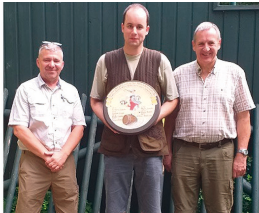
Gespannte Beobachter des Turniers