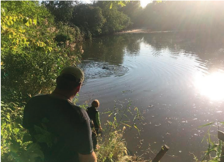
HZP 2019 – Wasserprüfung in Mainhausen

So konnte der 20./21. September kommen und es waren für die Herbstzuchtprüfung 8 Hunde gemeldet. Sieben erschienen dann am Freitagnachmittag zum ersten Prüfungsteil, der Wasserarbeit. Am nächsten Morgen sollte die Prüfung dann in Revieren um Gelnhausen mit Feldarbeit und Schleppen fortgesetzt werden – doch dazu kam es dann nicht mehr. Es gab ein von uns allen noch nie erlebtes „Desaster von Mainhausen“ – tatsächlich fiel ein Hund nach dem anderen am Wasser durch, so dass zuletzt kein einziger bestanden hatte. Auf die Weiterprüfung im Feld am nächsten Tag verzichteten dann alle, das Bestehen dieser Prüfung war ja für niemanden mehr möglich. Auffällig war, dass bei keinem einzigen der Hunde der Grund des Durchfallens bei sonst immer wieder mal vorkommender mangelnder Wasserpassion oder fehlender Schussfestigkeit im Wasser zu suchen war, sondern dass alle beim selbstständigen Bringen versagten. Und Bringen ist nun mal reine Übungssache, keine Anlage! Schade. Manchmal ist es natürlich einfach auch Tagesform oder schlicht Pech. Erfreulich war dann doch, dass einige der Hunde weiterübten und in den nächsten Wochen noch auf späteren Prüfungen bei anderen Vereinen die HZP bestehen konnten, eine DD-Hündin wurde sogar bereits zwei Tage später Suchensiegerin beim ersten Frankfurter Jagdclub.