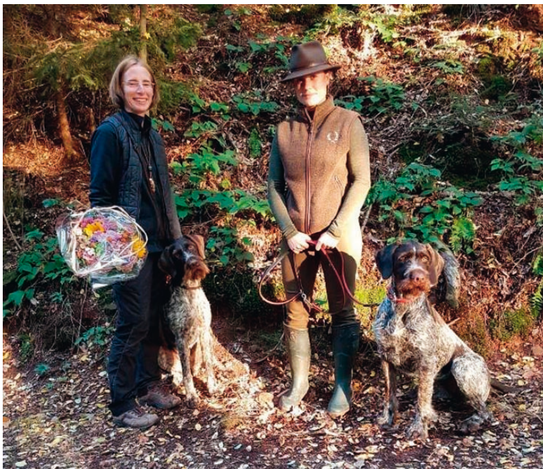
Zwei glückliche Führerinnen der BP KJV GN