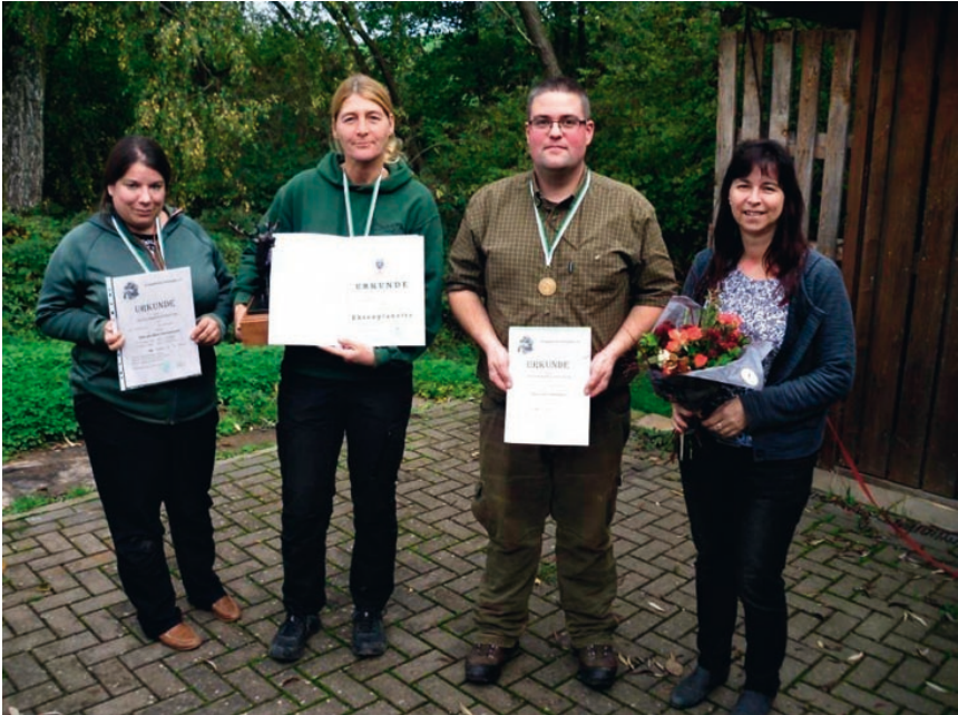
So sehen Sieger aus! VGP Gelnhausen 2019