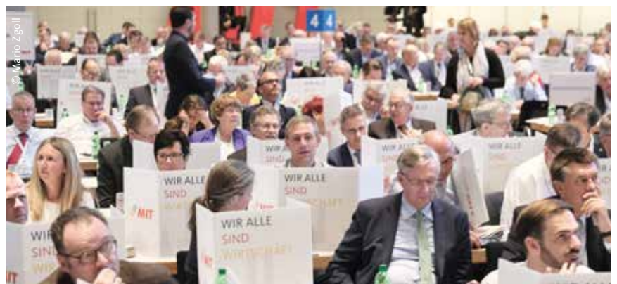
Die Delegierten der MIT Hessen auf dem Bundesmittelstandstag während einer Abstimmung