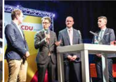
Schon Tradition: das Valentinstreffen der Kelheimer CDU mit dem Landesvorsitzenden der CDU Hessen und Ministerpräsident Volker Bouffier in der Stadthalle.