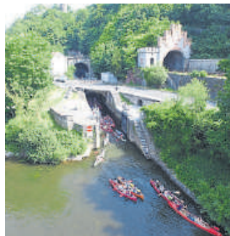
Der Schiffstunnel

Gleich am Beginn der Paddeltour steht mit dem Weilburger Schiffstunnel ein europaweit einzigartiges Erlebnis auf dem Programm. Danach geht es in gut 2,5 Stunden Paddelzeit die vielen Windungen der Lahn folgend bis zur ersten Ausstiegsmöglichkeit in Förfurt. Diese Paddeltour ist auch für Familien mit kleinen Kindern und Ungeübte gut zu bewältigen und bietet Abenteuer und Natur pur. Auf der weiteren Strecke zwischen Förfurt und Aumenau präsentiert sich einer der schönsten und romantischsten Lahnabschnitte. Nach gut einer weiteren Stunde Paddelzeit ist der Ausstieg in Aumenau erreicht und die Paddler können sich im Biergarten des Piratenlagers stärken und erholen. Weitere Ausstiegsmöglichkeiten für das Flussabenteuer im Kanu sind Villmar oder Runkel. Die Rückfahrt von allen Ausstiegstellen nach Weilburg ist problemlos mit der Lahntalbahn möglich. Diese verkehrt stündlich