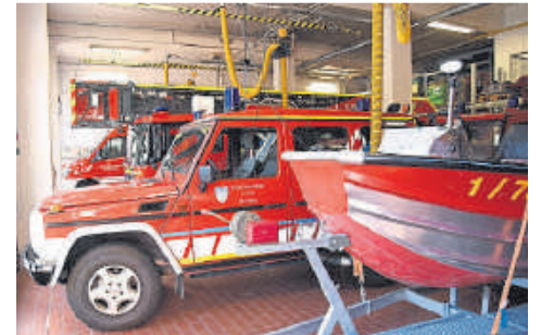
Blick in die Gerätehalle.