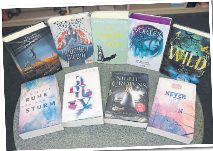
Blick auf einige Jugendbücher.