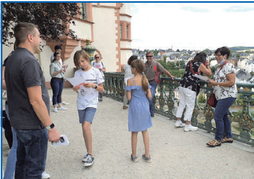
Interessante Weilburger Stadtführungen