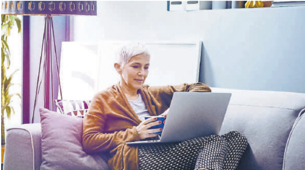
Mit dem neuen Finanzplaner hat man ein digitales Haushaltsbuch direkt im Online-Banking auf der Couch.

(ksk). Es ist gar nicht so einfach, immer genau zu wissen, wie es um die eigenen Finanzen steht. Wer nicht all seine Einnahmen und Ausgaben dokumentiert oder aber regelmäßig seine Ein- und Ausgänge auf dem Konto beobachtet, verliert da schnell den Überblick. Und überhaupt: Wer viele Konten gleichzeitig führt, steht ohnehin vor einem Wust an Buchungen. Finanzplanung braucht einfach Zeit und Muße. Mit dem Sparkassen Finanzplaner sieht das ganz anders aus. Er fungiert als digitales Haushaltsbuch. Alles passiert hier ganz automatisch: Die wichtigsten Informationen zu den Einnahmen und Ausgaben findet man mit dem Finanzplaner ganz übersichtlich im Online-Banking der Kreissparkasse Weilburg. Der Finanzplaner der Sparkasse analysiert alle von im Online-Banking eingebundenen Konten und Kre-