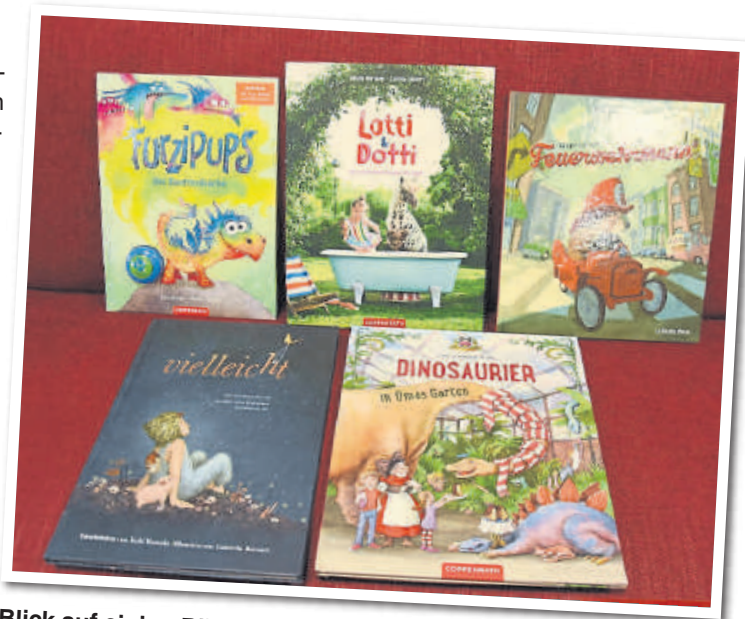
Blick auf einige Bilderbücher.