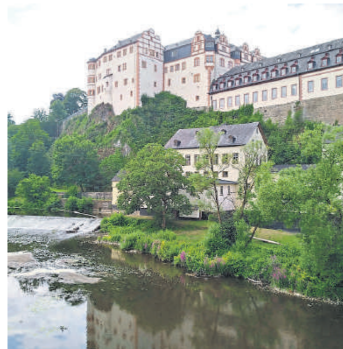
Blick auf ein Weilburger Industriedenkmal unterhalb des Schlosses.

Themenstadtführung Stadt-Land-Fluss am Sonntag, 23. August: Stadt-Land-Fluss – diese drei Begriffe charakterisieren Weilburg und seine Umgebung. Informiert wird etwa darüber, wie die Stadt Weilburg gebaut wurde und welche Auswirkungen die Stadtrechte mit sich brachten. Aber auch wer die Menschen waren, die in der Stadt lebten und leben. Auch die Lahn, die Weilburg rund 1,8 Kilometer umschließt und für die Menschen und die Stadt schon immer ein wichtiges Bindeglied war, wird in den Blick genommen. Die Stadtführung wird gestaltet von Gertrud Barkowski. Die Kosten betragen 5 Euro pro Person bei einer Dauer von etwa 90 Minuten. Treffpunkt ist um 15 Uhr auf dem Marktplatz. Für alle Stadtführungen wird aufgrund der begrenzten Teilnehmerzahl auf maximal 12 Personen um Voranmeldung unter: info@kvv-weilburg.de oder telefo-