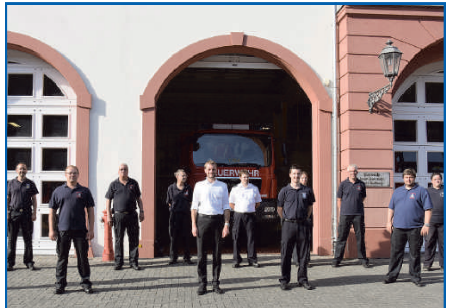
Stadt dankt Feuerwehr mit einer Prämie