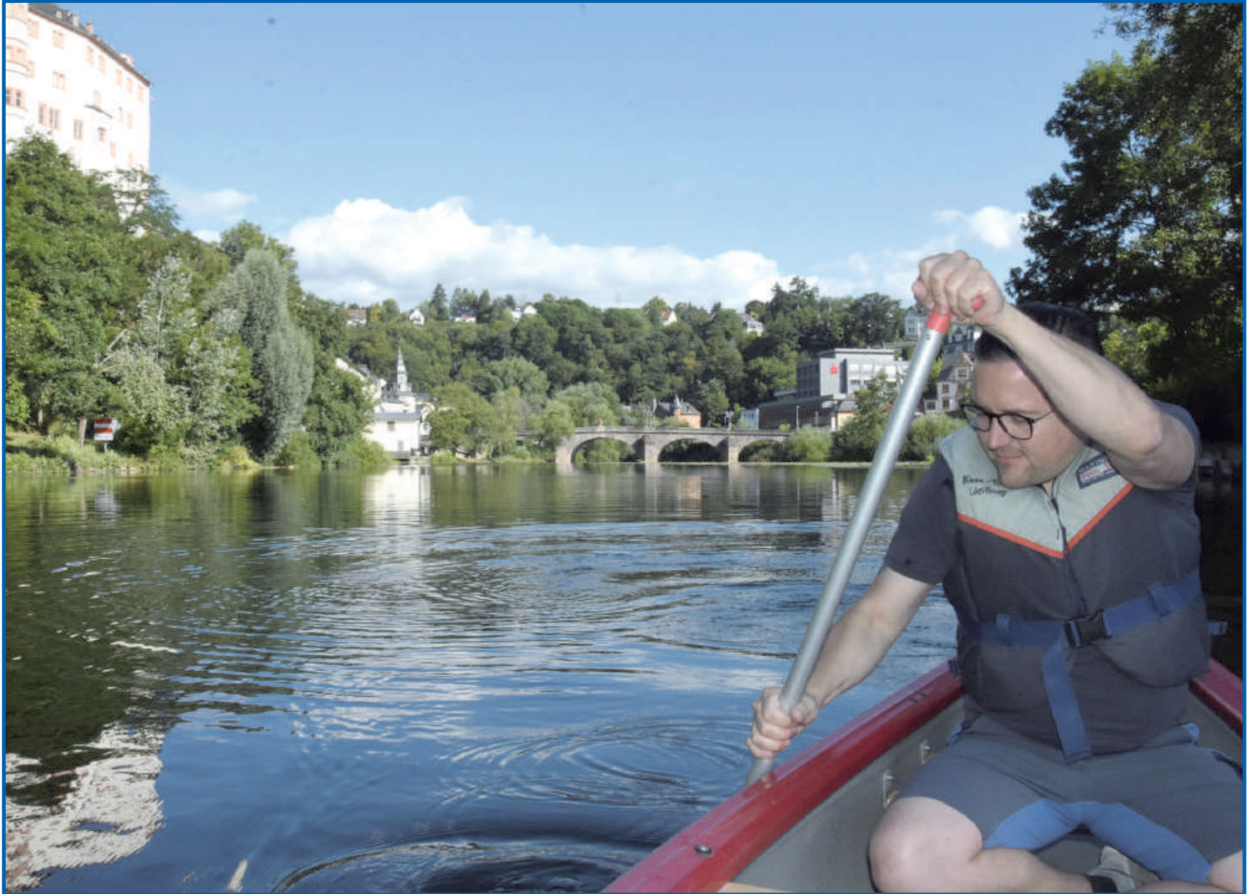
Spaß beim Wasserwandern auf der Lahn