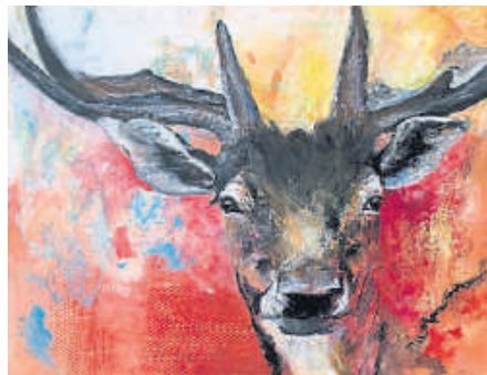
Arbeit von Doris Happ.

Ebenfalls am 14. August findet um 14 Uhr die Ausstellungseröffnung „Odyssee – A Journey it must be“ von Katrin Kampmann statt. Die Künstlerin lädt dazu ein, mit ihr auf eine Reise durch verschiedene Phasen ihres Schaffens zu gehen, aber auch in die Farbwelt und Geschichten, denen wir auf ihren Bildern begegnen. Gemeinsam treffen wir kämpfende Astronauten, reisen mit Virgil in die Unterwelt, sehen tanzende Roboter, die Freizeit haben und auch genießen wollen,