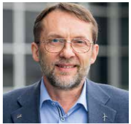
Ihr Volker Bouffier MdL Ministerpräsident und Landesvorsitzender der CDU Hessen

Ich hoffe sehr, dass auch Sie gut durch die Krise kommen und trotz dieser einen schönen Sommer haben. Bleiben Sie gesund, bleiben Sie uns gewogen und werben Sie für unsere CDU.