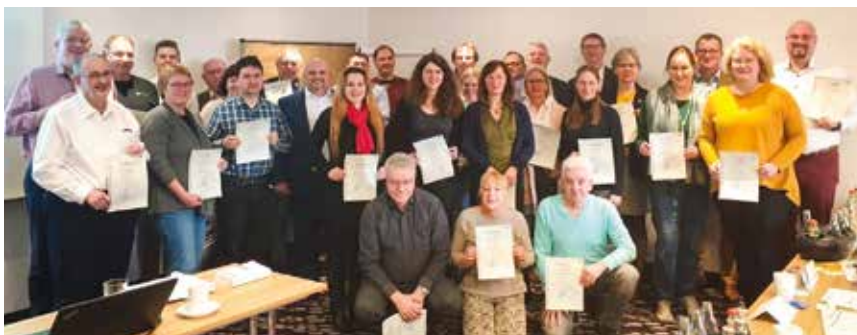
Seit Anfang Mai nahmen rund 1.800 meist ehrenamtliche Wahlkampfshelferinnen und Wahlkampfshelfer an 15 Online-Schulungen der KPV teil.

Wir wünschen Ihnen für den anstehenden Wahlkampf viel Energie, Kraft und Erfolg und freuen uns darauf, Sie vielleicht bei einer der zahlreichen Veranstaltungen der Kommunalpolitischen Vereinigung in Hessen zu sehen. ■