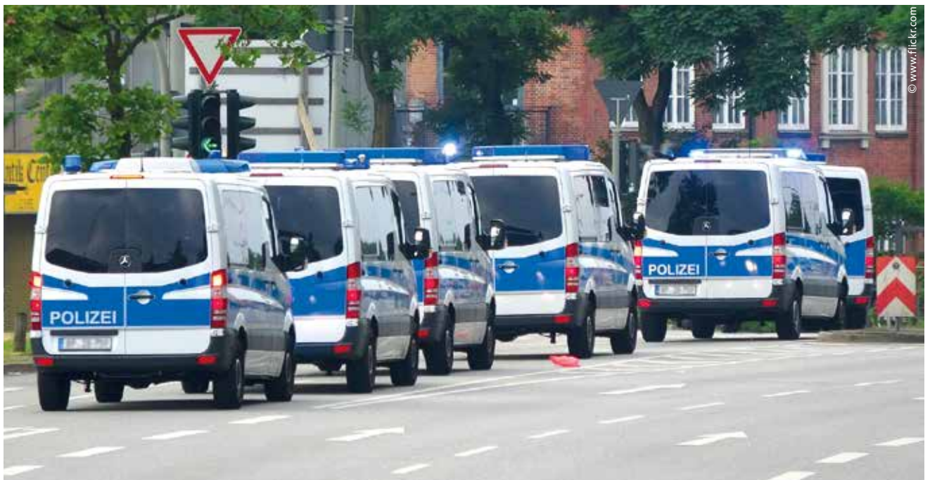
Die Gewalt gegen Polizeibeamte nimmt nicht nur zu, neu ist auch die Inszenierung in sozialen Medien. Das aggressive Verhalten gegen die Polizei wird dort dokumentiert und unverhohlen gefeiert.