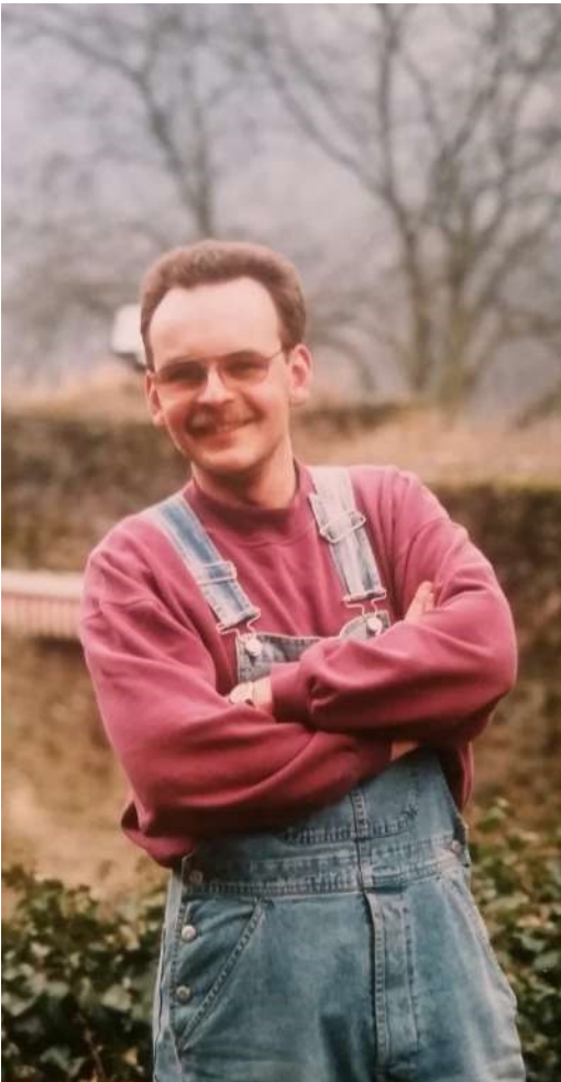
Der Humor der Rockmusiker

Ein Bild von Dir habe ich immer noch vor Augen: Als wir mal in Bad Soden spielten und es um 18 Uhr kurz zu regnen begonnen hatte, sind alle vorhandenen Zuschauer unter deinen Mixer-Pavillon gestürmt. Du standest in einem Pulk von Leuten in enger „Tuchföhlung“. Dann hast Du nur zu Bernd und mir herübergeschaut und Deine linke Augenbraue hochgezogen, wie Du das sehr oft gemacht hast, wenn Dir irgendetwas auf den Keks ging oder nicht stimmte. Das werde ich nie vergessen! Deine linke Augenbraue war schon immer ein sehr deutliches Zeichen!“