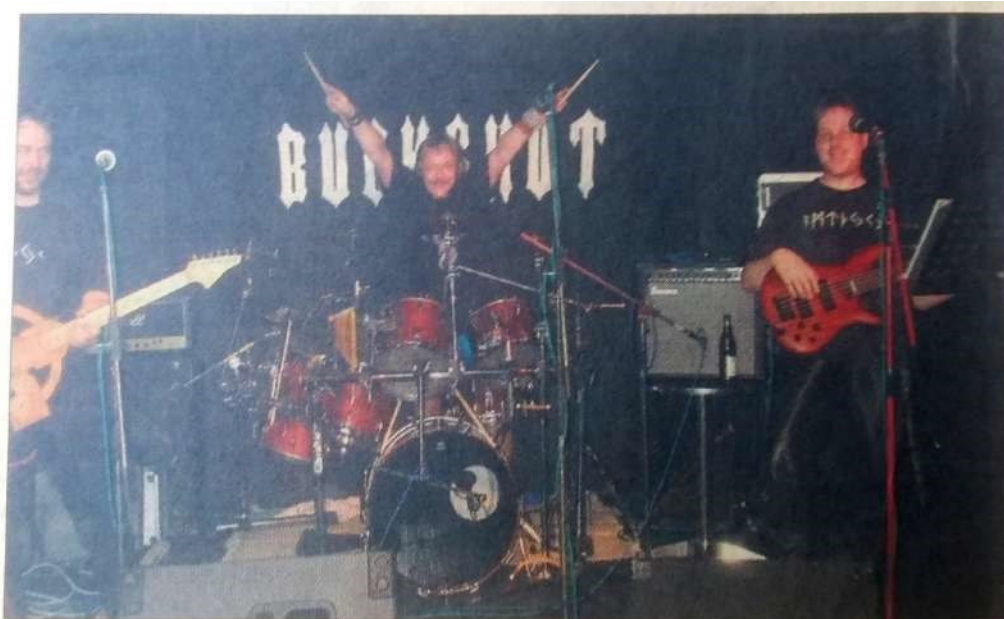
Zwar ein bisschen älter geworden, dennoch sorgte die Rockband „Buckshot“ im Kelkheimer Jazzclub für super Stimmung.