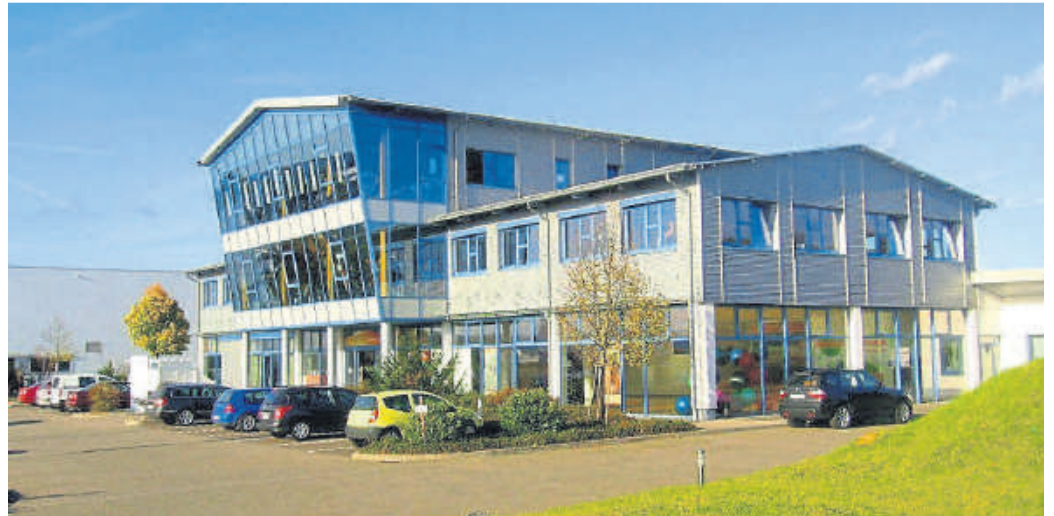
Das Gesundheits- und Fitnesscenter pur-life.

Eckardt gehört mit seinem Angebot deutschlandweit zu den führenden Anbietern im Bereich Gesundheit. Mit seinen Seminaren und Vorträgen ist er mittlerweile über die deutschen Grenzen bekannt und berät Groß und Klein-Unternehmen im Bereich Mitarbeiter-Gesundheitsförderung und Unternehmensgesundheit. Sollte Inte-