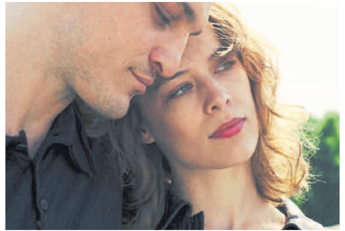
Szene aus dem Film „Undine“.

Die Wanderung beginnt am Samstag, 26. September, um 11 Uhr; Treffpunkt ist der Naturpark-Wanderparkplatz Schützenberg in Weilburg-Odersbach. Eine Anmeldung auf www.naturpark-taunus.de ist erforderlich.