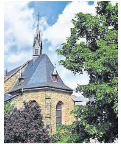
Die Karlskirche