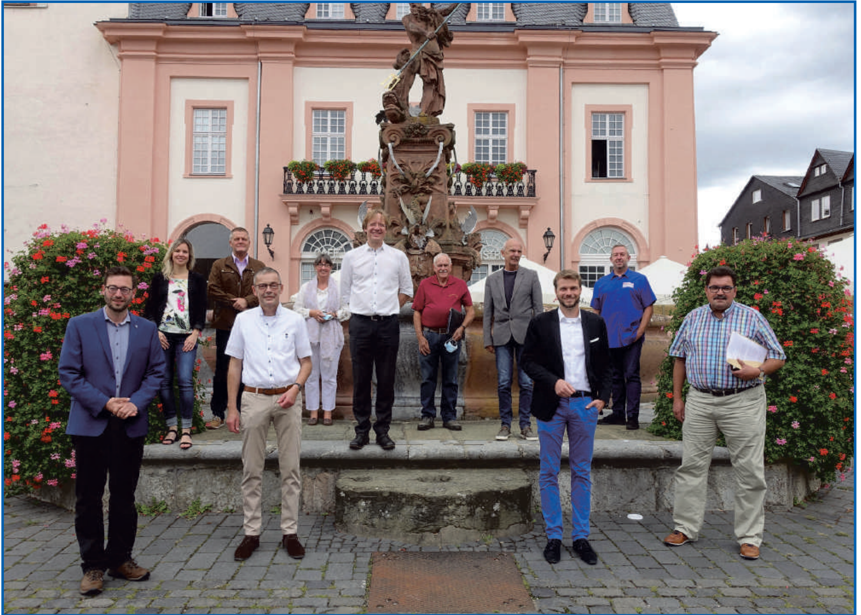
Tag des offenen Denkmals am 13. September