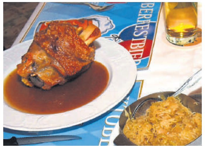
Bayrische Spezialität: Knusprige Haxe