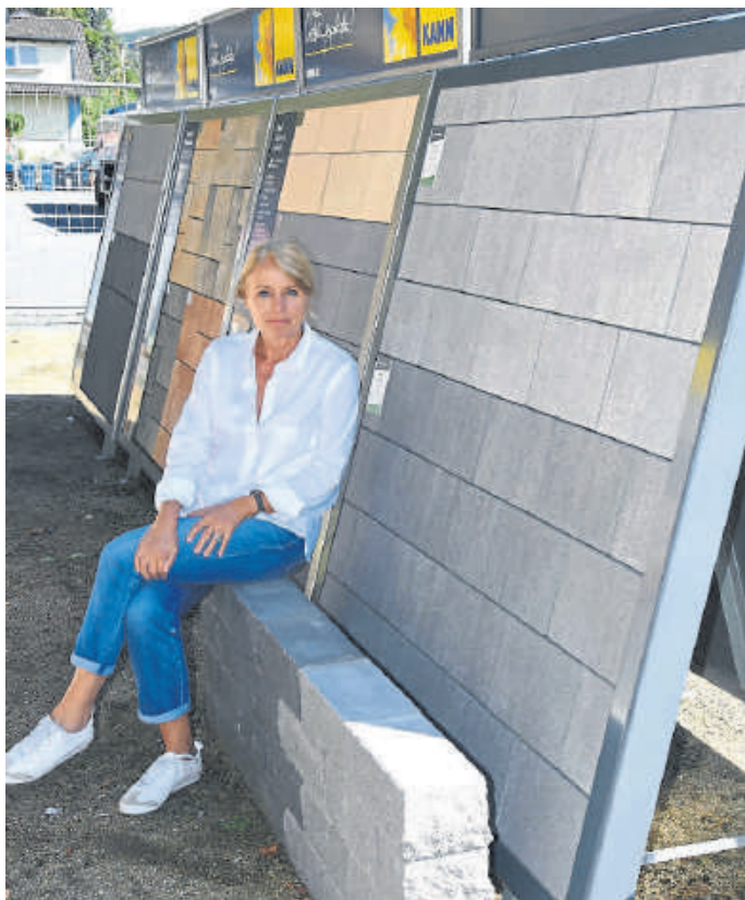
Firma Stroh zeigt die neuen Pflastersteine mit passender Mauer der Produktlinie „Malibu“.

Hermann Stroh GmbH, Löhn-berger Weg, 35781 Weilburg, Tel. 06471/92720, www.stroh-baustoffe.de