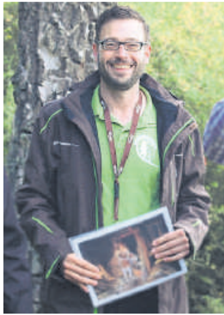
Christian Radkovsky

An fünf Stationen, an denen jeweils ein kleiner Imbiss gereicht wird, wird so die keltische Geschichte wieder lebendig. Im Preis von 22 Euro (Kinder bis 14 Jahre: 17 Euro) sind die Füh-