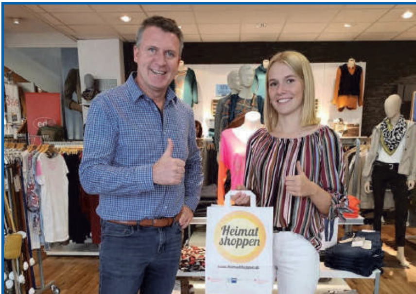
Heimatshoppen am 11. und 12. September