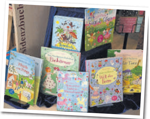
Malen, Basteln, Rätseln