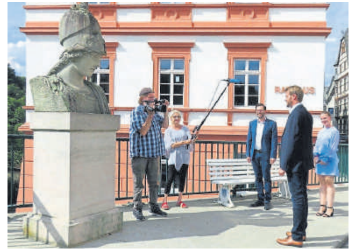
Dreharbeiten neben dem Rathaus für den Tag des Offenen Denkmals.

Am Wochenende des Denkmaltags, 12. und 13. September, werden die Öffnungszeiten auf 10 bis 16 Uhr erweitert. Viel Spaß beim Erkunden!