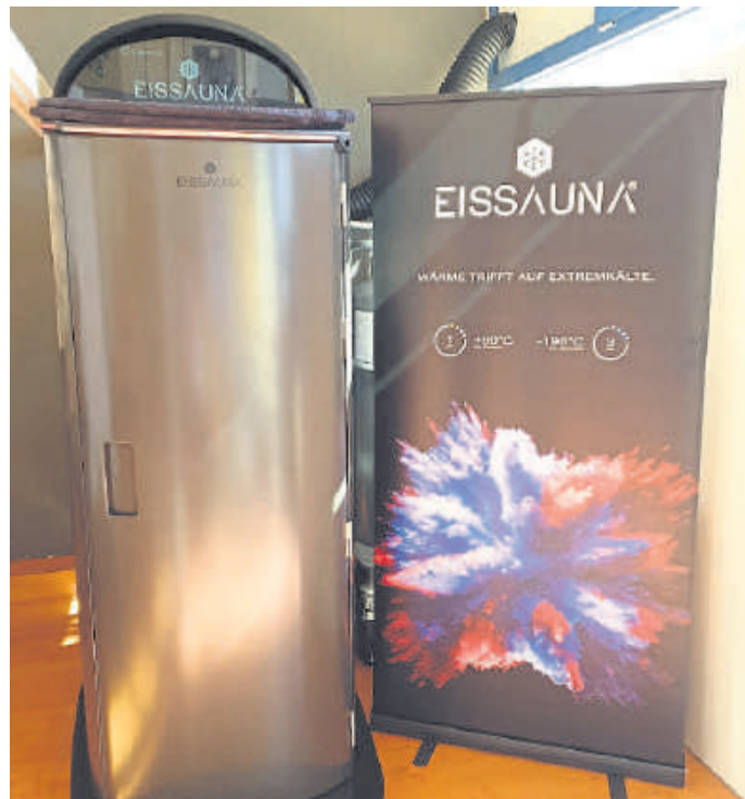
Blick auf die neue Kälte-Kammer.

Kontakt: Pur-life, Viehweg 6, 35781 Weilburg, https://pur-life-weilburg.de