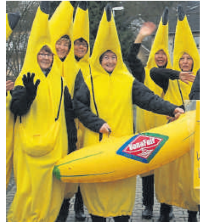
„Faire Früchtchen“ werden in Weilburg unterwegs sein.

(bach). Vom 11. bis 25. September finden bundesweit die Faire Wochen unter dem Motto „Gutes Leben“ statt. Wie müssen nachhaltige Produktions- und Konsummuster aussehen, die möglichst vielen Menschen in Nord und Süd ein gutes Leben ermöglichen? Das Team der Weilburger Weltläden beteiligt sich mit drei Aktionen. Am 15., 17., 22. und 24. September werden in der Zeit von 10 bis 12 und von 14 bis 18 Uhr in der Stadt und den Weltläden faire bio Bananen verteilt und die Bevölkerung befragt, was für sie „gutes Leben“ bedeutet. Eine weitere Aktion ist die Veröffentlichung eines Videos, das sicher zur Vorfreude auf eine Wein- und Schokoladen-fairkostung zu Hause führen wird. Die Kombination köstlicher Schokoladen und korrespondierender Weine aus Fairem Handel führen zu einem besonderen Geschmackserlebnis. Dieses Video wird über verschiedenen Medien verbreitet, unter anderem unter www.weltladen-weilburg.de .