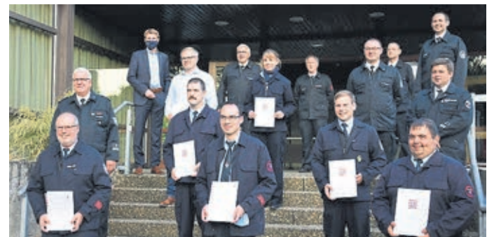
Gruppenbild nach der Ehrung.

Langjährige Feuerwehr-Aktive ausgezeichnet