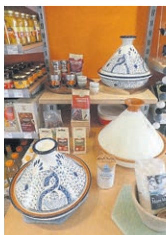
Verschiedene Tajines und eine feine Auswahl an Gewürzen.

(red). Das Team des Weilburger Weltladens stellt heute als Produkt des Monats Oktober die Tajine aus Tunesien vor. Die Tajine ist ein traditioneller Dampfkochtopf aus Nordafrika. Mit dem Topf aus Lehm wird das Gericht bei gleichmäßigen Temperaturen langsam und schonend gegart. Dadurch bleiben Aromen und Nährwerte besser