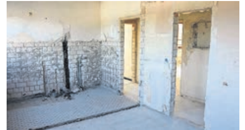
Die ehemalige Hausmeisterwohnung wird zurückgebaut.