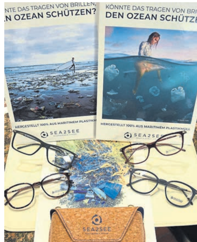
So sehen die neuen Brillen aus.

Heute umfasst das Brillensortiment von Sea2see über 135 Sonnenbrillen und optische Fassungen – erhältlich in mehr als 3000 Optikgeschäften auf der ganzen Welt. Die Fassungen werden nach den höchsten Qualitätsstandards in Italien hergestellt, und die Kollektion umfasst eine Reihe frischer, moderner Brillenformen wie quadratische Fassungen, Pilotenform und Wayfarer-Stil.