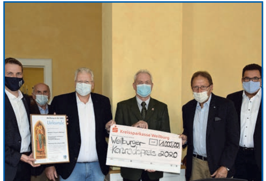
Verleihung des Konradpreises 2020