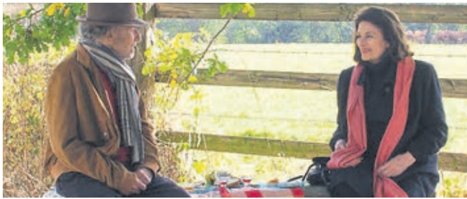
Szene aus „Die schönsten Jahre eines Lebens“.