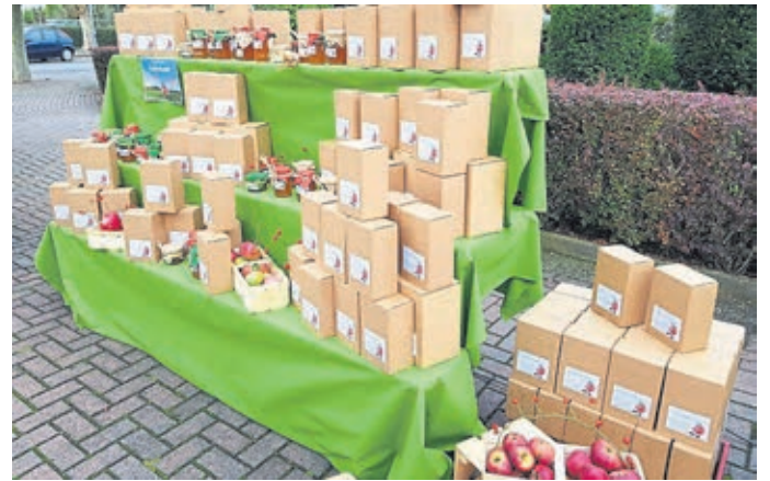
Der Apfelsaft ist sehr beliebt.