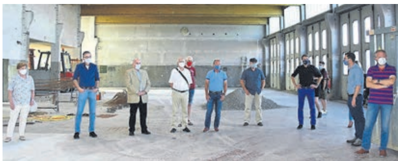
In der großen Halle werden sechs Fahrzeugbuchten eingerichtet.