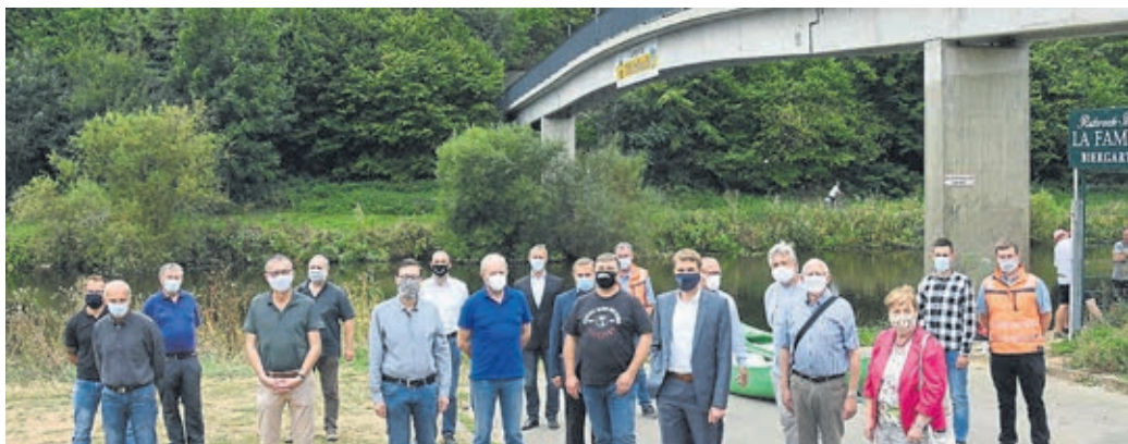
Gruppenfoto vor der sanierten Brücke zwischen Kirschhofen und Odersbach.