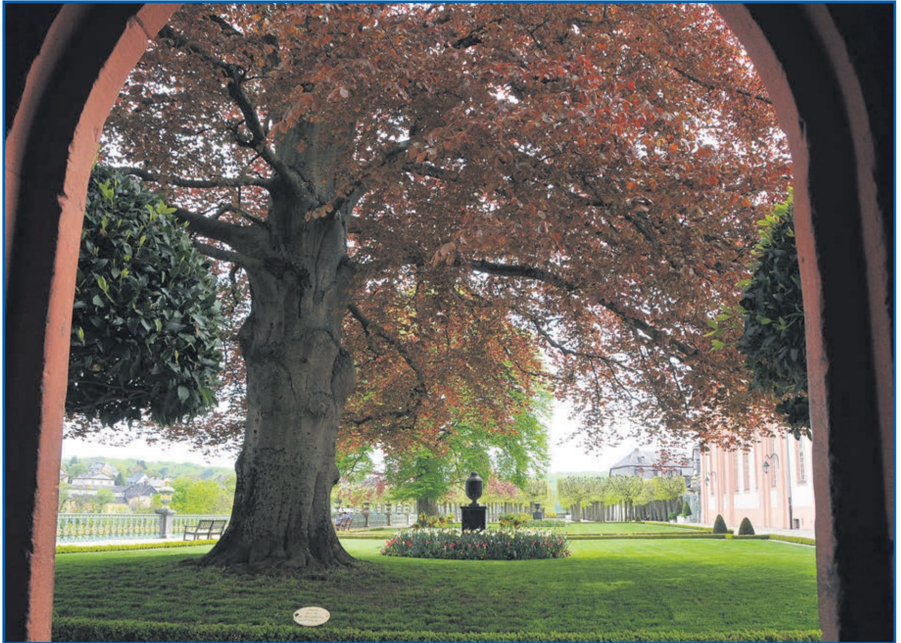
Herbst im Weilburger Schlossgarten