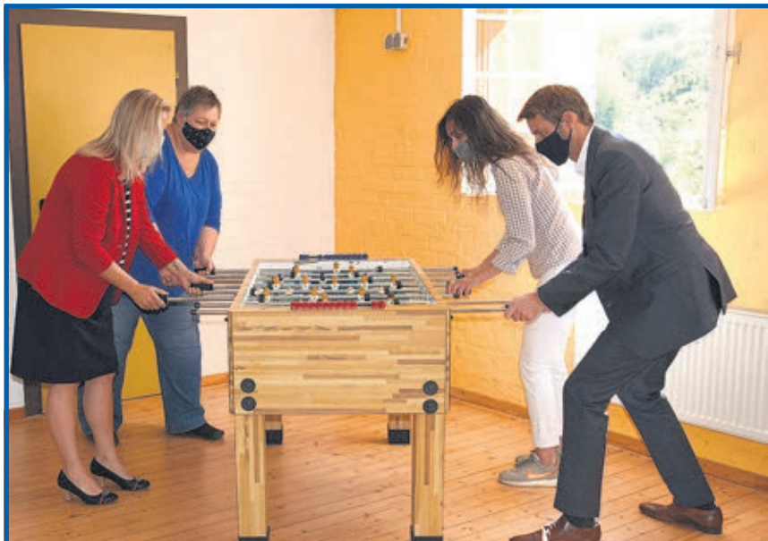
Neues Jugendzentrum eröffnet