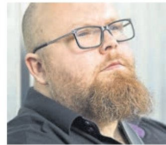
Andreas Kümmert

Vorschau: Am Dienstag, 24. November, ab 20 Uhr ist Andreas Kümmert, der Gewinner von „The Voice of Germany 2013“ mit der wahnsinnig tollen Stimme, in der „Scheune mit dem blauen Dach“ zu erleben. Unkostenbeitrag 33 Euro. 40 Karten gibt es ab dem 4. Oktober im Vorverkauf in der Residenz-Buchhandlung Weilburg.