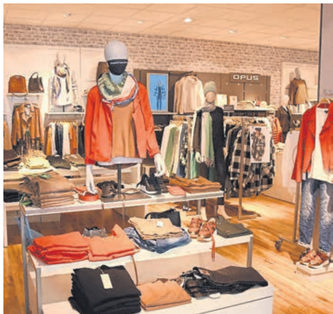
Blick auf die neuen Kollektionen.

Gertis Mode, Neugasse 7 (Altstadt), 35781 Weilburg, Tel. 06471/923860