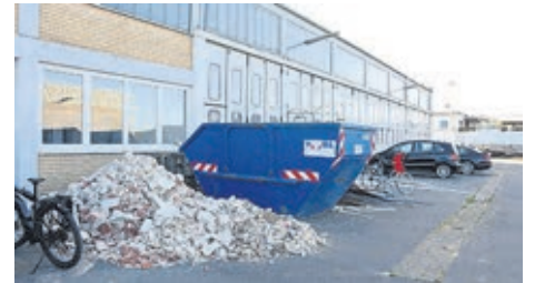
Blick auf die Halle von außen.