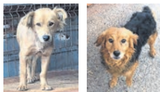
3-jährige Hündin (links) und 4-jähriger Rüde.