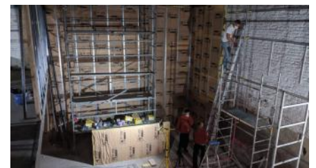
Auf dem Bau