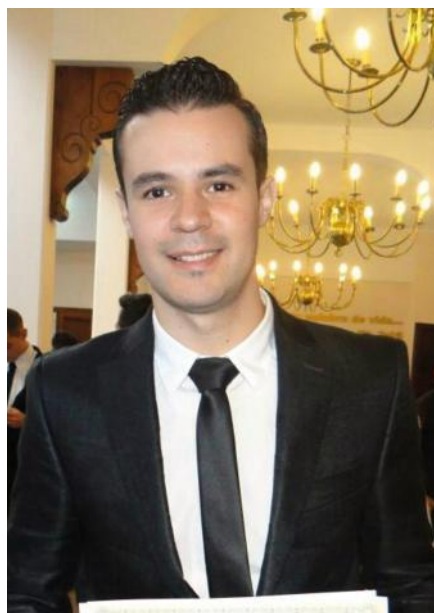
Universitätsabschluss in Costa Rica