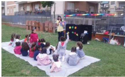
Good News Club

tegischer Bedeutung. Ich war nicht nur für den Dienst vor Ort verantwortlich, sondern auch für die nationale Arbeit tätig. Dabei konnte ich problemlos mehrere Provinzen Italiens erreichen und Gemeinden bei der Organisation von Programmen für Kinder wie 'Good News Clubs' helfen und Trainingskurse für Leiter durchführen. Es war nicht einfach, eine Pionierarbeit in den Abruzzen zu beginnen, nicht nur wegen des neuen Umfeldes, sondern auch wegen der Schwierigkeit, das Vertrauen der Nachbarn zu gewinnen. Für sie war es schwer zu verstehen, was ich tat. Heute, nach drei Jahren, erlauben einige Nachbarn ihren Kindern, an Good News Clubs teilzunehmen, selbst wenn ihr Denken und ihre Traditionen sie davon abhalten, sich mit der Bibel zu beschäftigen. Mit den Gemeinden vor Ort konnte ich von Anfang an gut zusammenarbeiten. Gott erlaubte mir, alle Aktivitäten zu entwickeln, die nicht nur für Kinder, sondern auch indirekt für Erwachsene bestimmt waren. Ich erlebte, wie mein Dienst wuchs und bessere Schulungen benötigt wurden. Daher fühlte ich mich herausgefordert, mein Vorbereitungs-niveau zu erhöhen. Dies war der Grund, warum ich überlegte, einen Master-Abschluss