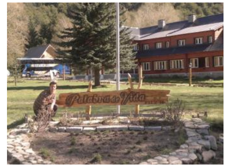
Bei Palabra de Vida in Argentinien

2 Jahre lang betete ich und bat um Rat, welchen Weg ich einschlagen sollte. Während dieser Zeit erinnerte ich mich an viele Situationen, die Schritt für Schritt in meinem Herzen bestätigten, dass ich mich nicht von meinen Gefühlen leiten lassen soll-