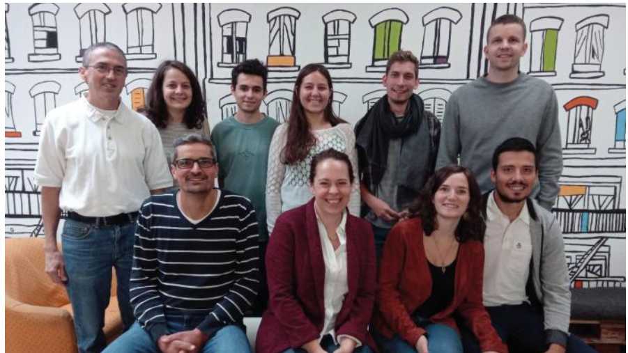
FEU Team 2019-2020