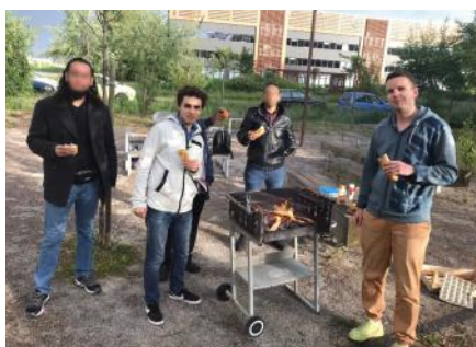
Grillen auf dem Unigelände