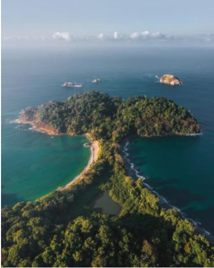
Whale Beach Costa Rica