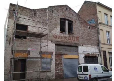
Haus der Gemeinde

Durch die Pandemie ist unser Plan, den Gemeindesaal bis Ostern 2020 fertig zu haben, natürlich nicht realisierbar gewesen, aber es geht weiter und wir werden dann hoffentlich ab September den Saal nutzen können, und die Wohnung über dem Saal bis Ende des Jahres fertiggestellt haben. Da wir bald einen Saal haben werden, sind wir als Gemeinde dabei zu überlegen, wie wir Gemeinde verstehen und wie wir unsere Mission, die Menschen um uns zu erreichen, leben können.