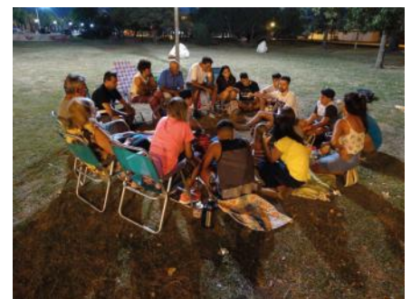
Evangelisation im Park in Rosario Argentina

te, sondern dass der Herr mich direkt führte. Kluge Ratschläge von geistlichen Menschen ermutigten mich, im Glauben voranzugehen. Aber obwohl auch fleischlich gesinnte Menschen versuchten, mich zu beeinflussen, wurde ich immer sicherer, dass mein Weg in den vollzeitlichen Dienst führt.