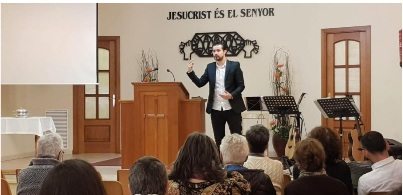
Predigt dienst in Barcelona