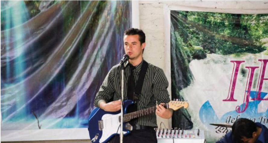
Missionseinsatz in Peru