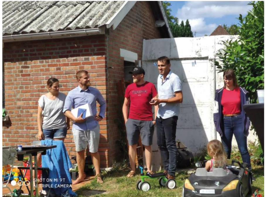
Verabschiedung von Sutherlands

Das Café L'Autre Estaminet mussten wir in der Corona-Zeit natürlich auch schließen und wir sind dankbar, dass wir staatliche Hilfen für die laufenden Mietkosten etc. bekommen konnten. Natürlich diskutierten wir auch eifrig wie, unter welchen Auflagen und auch mit welchen Freiwilligen, wir das Café wieder