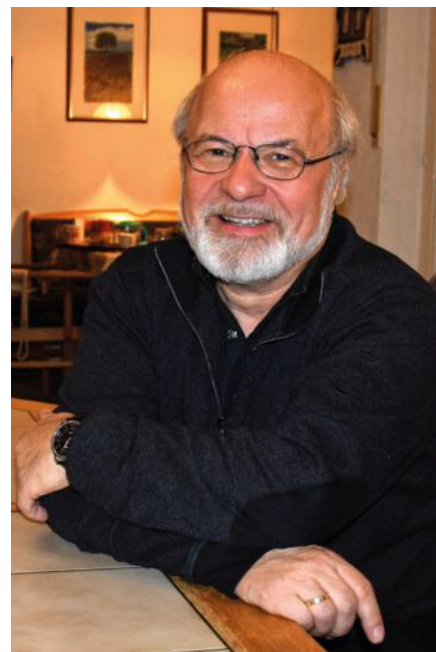
Anselm Schönfeld fotografierte am Tag der Gründungsversammlung