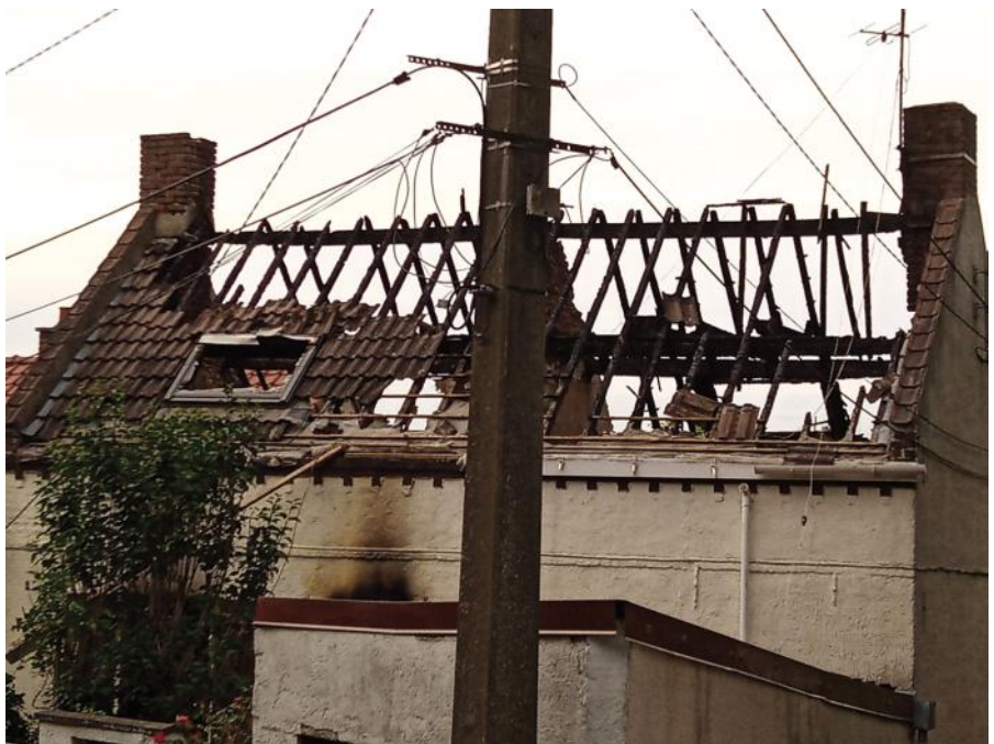
Benzingers Haus nach dem Anschlag

aufmachen könnten. In all dem konnten wir Gottes gute Führung sehen: wir durften drei französische Freiwillige begrüßen, die jetzt unser Team vervollständigen. Bereits eine Woche nach der offiziellen Erlaubnis Cafés und Restaurant zu öffnen, konnten auch wir den Betrieb in unserem Café, dem L'Autre Estaminet, wieder aufnehmen. Wir freuen uns