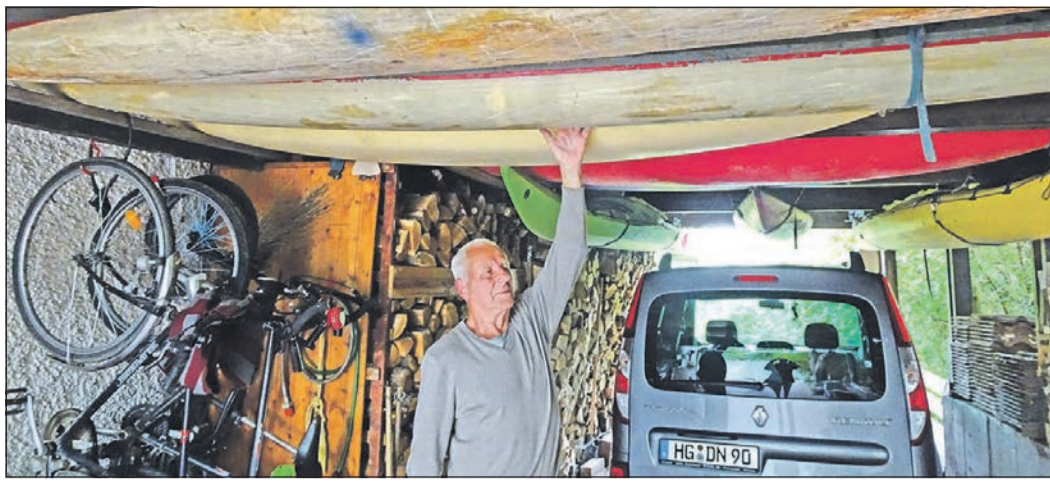
Boote aus fünf Jahrzehnten Kanusport präsentieren sich sauber aufgereiht unter dem Carportdach von Hans Windecker.