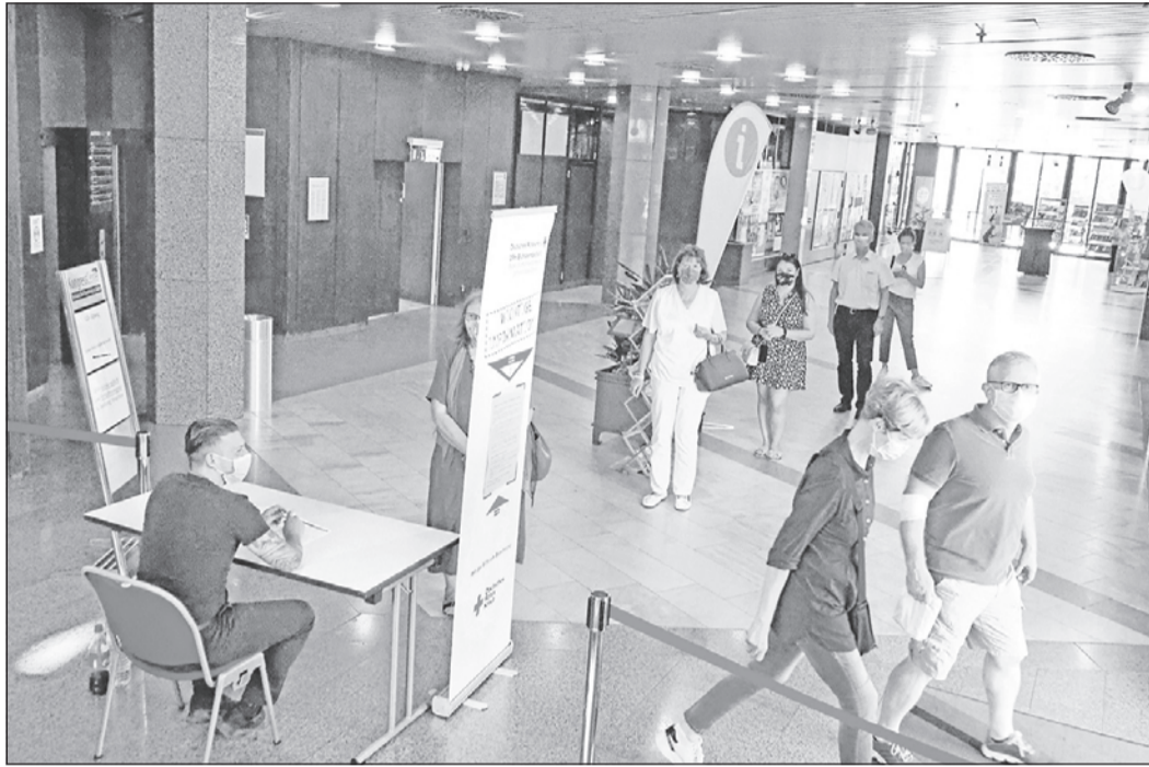
Trotz Terminvereinbarung müssen einige Spender eine kurze Wartezeit in Kauf nehmen.

Wer selbst Interesse an „Tele-Gym“ hat oder meint, dass es etwas für die Eltern ist, kann sich unter Telefon 06172-12950 oder per E-Mail an info@drk-hochtaunus.de an Dagmar Dörhöfer-Sünder, Kathrin Kiefer oder Ursula Villwock wenden. Dort gibt es weitere Informationen. Telefon-Gymnastik wird so lange angeboten, bis nach entsprechenden Lockerungen in der Pandemieabwehr wieder in der Begegnungsstätte trainiert werden kann.