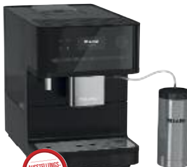
Miele Kafeevollautomat CM6350 schwarz

Finanzkauf 0% Jahreszins 12 Monate / 54,08 € monatlich