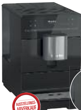
Miele Kafeevollautomat CM5300 schwarz