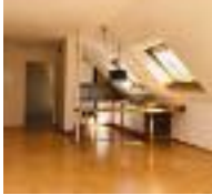
Schicke Eigentumswohnung in OF-Rumpenheim, 50 qm Wfl., - RESERVIER!