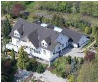
Ein richtig schönes Landhauseanwesen in Schwalmtal-Vadenrod. Alle Informationen unter der Immobilienscout24-ID: 120695565