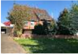
Einfamilienhaus in Lauterbach-Maar, 100 qm Wfl., 1050 qm Grundstück - VERKAUFT!