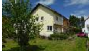
Einfamilienhaus in Bermuthshain, 192 qm Wfl., 1173 qm Grundstück - VERKAUFT!