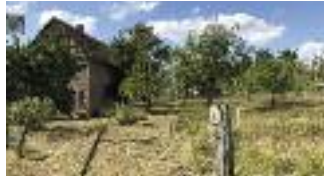
Zu verkaufen: Schönes Baugrundstück mit Abrisshaus in Lauterbach-Heblos. Alle Informationen unter der Immobilienscout24-ID: 113985527