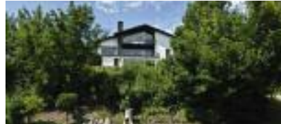
Zu verkaufen: Tolles großes Haus in Schwalmtal-Brauerschwend! Alle Infos unter der Immobilienscout ID: 121006273