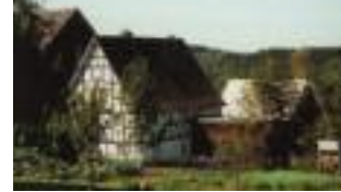
Tolles Fachwerkhaus im Vogelsberg! - VERKAUFT!