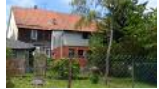
Zu verkaufen: Fachwerkhaus in Grebenhain-Crainfeld. Alle Informationen unter der Immobilienscout24-ID: 121642988