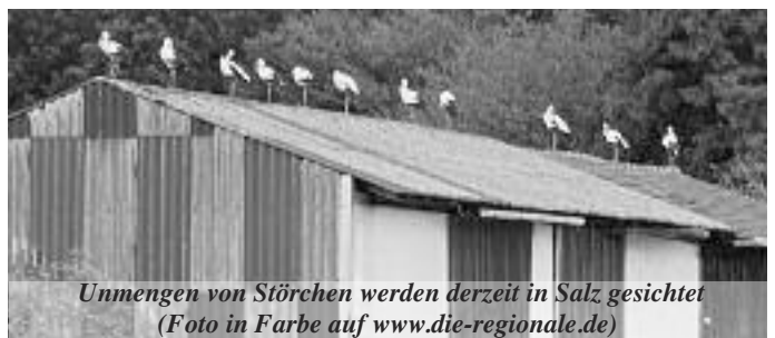
Unmengen von Störchen werden derzeit in Salz gesichtet (Foto in Farbe auf www.die-regionale.de )

Die nächsten Spiele sind am So. 23.8 um 18:00 Uhr in Staden, Do. 27.8 um 19:30 in Bellings und So. 30.8 17:00 Uhr in Ilbeshausen.