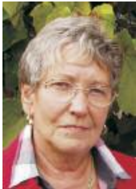
Neuenschmidten, im September 2020

Erinnert euch an mich, aber nicht an dunklen Tagen, erinnert euch an mich in strahlender Sonne, wie ich war, als ich noch konnte.