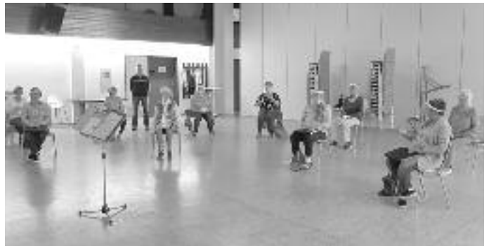
Foto oben: unsere erste Chorprobe nach Ausbruch der Corona-Pandemie am 01. September 2020.

Chorproben: Dienstag, 22. September 2020, Frauenchor ab 19:00 Uhr im Saal des Bürgerzentrums Birstein • Dienstag, 22. September 2020, Männerchor ab 19:00 Uhr im katholischen Pfarrheim Birstein