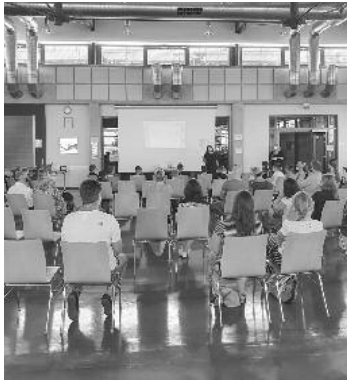
Fotos vom und im Klassenraum machen und den Eltern digital zukommen lassen.