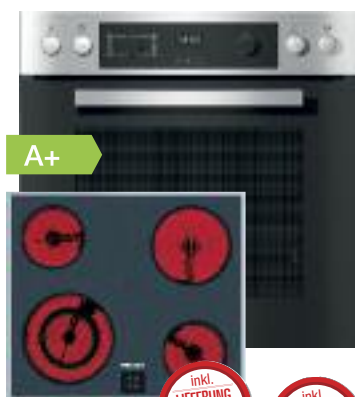
Miele Einbau-Herdset H2267-1EP / KM 6003