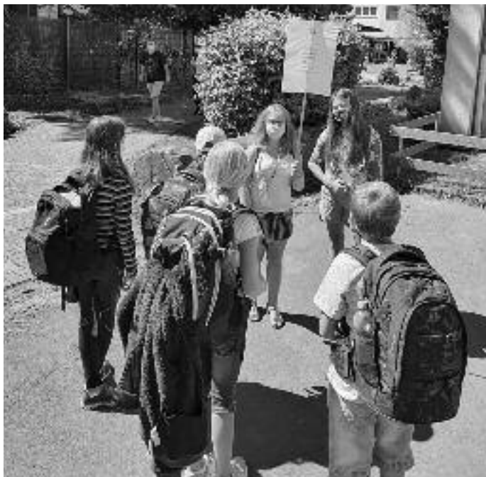
(Foto: Schülerbuspatinnen zeigen ihren neuen Mitschülerinnen und -schülern den richtigen Bus.)