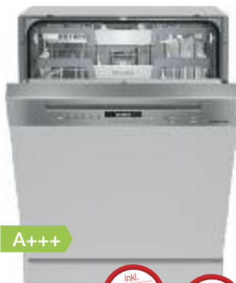
Miele Geschirrspüler G7100ScI edelstahl

Finanzkauf 0% Jahreszins 12 Monate / 58,25 € monatlich