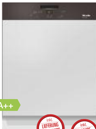
Miele Geschirrspüler G4310i braun