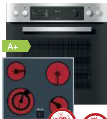
Miele Einbau-Herdset H2267-1EP / KM 6003