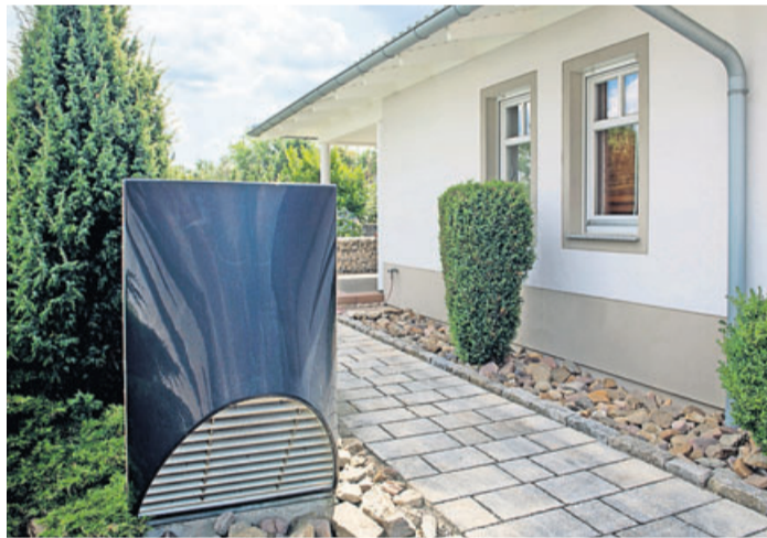
Der Lärm, den Wärmepumpen verursachen, kann in dicht besiedelten Nachbarschaften stören.

Schwerpunktthema: Gutes Handwerk aus der Region