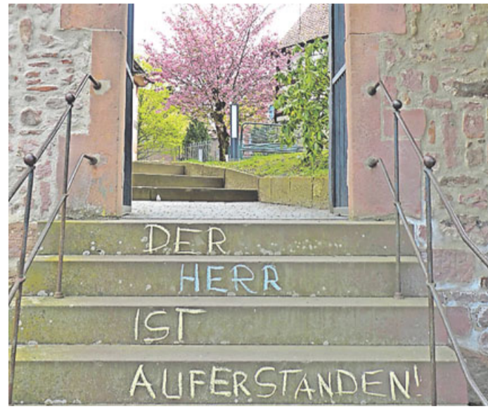
Auch am Aufgang zur Martinskirche waren die Worte zu lesen: „Der Herr ist auferstanden!“

Linsengericht. Ungewöhnliche Wege beschritt die evangelische Kirchengemeinde Linsengericht in diesem Jahr bei der Verkündigung der Osterbotschaft. Neben den Hinweisen auf die vielfältigen Gottesdienste in Fernsehen, Rundfunk und Internet, waren die Gemeindeglieder zu gleich zwei Flashmobs aufgerufen. Unter dem Motto „#osternvombalkon“ waren am ersten Ostertag Menschen eingeladen, sich musikalisch an der Verkündigung der Osterbotschaft zu beteiligen – in welcher Form und mit welchem Musikinstrument oder Stimmen auch immer. Zum Abschluss des Fernsehgottesdienstes um 10.15 Uhr im ZDF