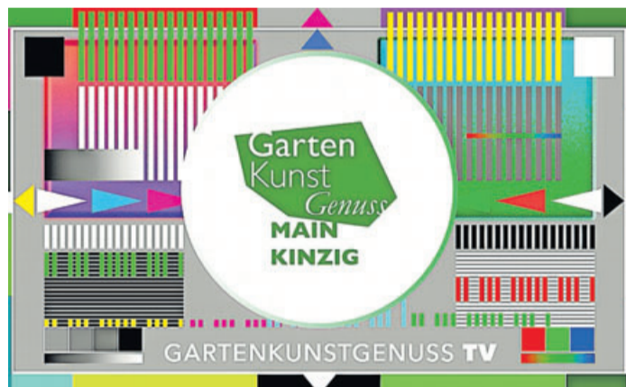
Der Main-Kinzig geht am 10. Mai auf Sendung.

Genuss‘ in diesem Jahr einfach neu und bringen den Garten ins Wohnzimmer“, erläutert Jörg Schmitz mit einem Augenzwinkern. Als Initiator und Projektleiter der Reihe hat er bereits vor zwei Jahren einen YouTube-Kanal eingerichtet. „Hier werden wir in den nächsten Wochen zahlreiche authentische Inhalte rund um den Garten präsentieren – für Menschen von Maintal bis Sinnatal, und sogar für alle Gartenliebhaber bundesweit“, so Schmitz. Dass ganz Deutschland derzeit viel Zeit zu Hause verbringt, könne der regionalen Gartenkultur sogar zu noch mehr Aufmerksamkeit verhelfen. Dabei käme es für die drei- bis fünfminütigen Bei-