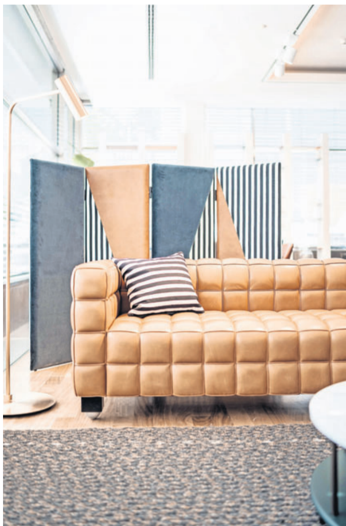
Der Raumteiler Josef von Wittmann eignet sich, um Möbel davor zu inszenieren und eine wohnliche Atmosphäre zu erzeugen.

Der klassischen Vorstellung eines Paravents entspricht Lola von Bodo Sperlein. Schönbuch produziert Varianten mit drei, vier oder fünf Elementen, an denen sich Haken, Ablagen oder Spiegel befestigen lassen. Auch das Modell Paravan für Arper setzt auf extra Funktionen – an den Raumteiler lassen sich zum Beispiel Regale, Garderoben-Elemente, White-