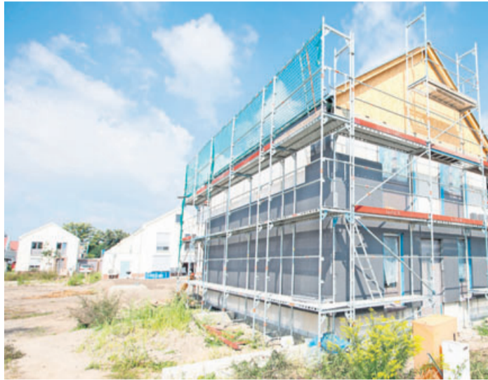
Bauherren müssen sich darauf einstellen, dass es in den kommenden Wochen auf Baustellen zu Verzögerungen kommen kann.

Die Corona-Krise betrifft immer mehr Bereiche. Allerdings sorgen die Maßnahmen gegen die Ausbreitung des Virus noch nicht überall für kompletten Stillstand. Auf den meisten Baustellen etwa wird nach wie vor gearbeitet. „Noch ist die Krise nicht konkret greifbar“, sagt Erik Stange vom Bauherren-Schutzbund.