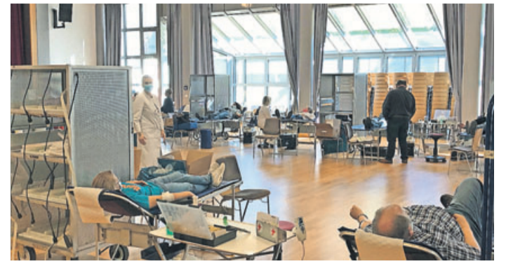
Blutspendetermine sind nur mit Terminreservierung möglich.

Schlüchtern. Eine Woche lang war in der Stadthalle Schlüchtern ein regionales Blutspendezentrum eingerichtet. Die Resonanz war sehr gut. Regulär wäre der übliche Blutspendetermin in Schlüchtern vor Kurzem gewesen. Durch die Corona-Pandemie musste der DRK-Blutspendedienst Baden-Württemberg-Hessen seinen Ablauf ändern. Die DRK-Ortsvereine Schlüchtern und Sinnthal hatten sich gemeinsam bereiterklärt, ein solches Blutspendezentrum mitzuorganisieren. In Sterbfritz musste Ende März der Entnahmeterrain gestrichen werden. In den letzten Tagen, in denen von 13 Uhr bis 18 Uhr Spender aus den Regionen Schlüchtern, Sinnthal, Steinau und Bad-Soden Salmünster die Möglichkeit hatten zum Blut spenden, kamen insgesamt 529 Blutspender. Darunter wiederum konnte man 35 Erstspender begrüßen. Möglich war die Blutspende nur mit Terminreservierung, so dass immer eine bestimmte Anzahl von Spendern und Blutspendemitarbeitern sowie ehrenamtliche Helfern im Raum waren.