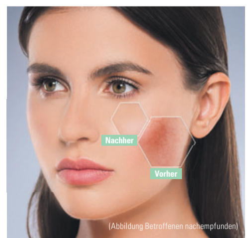
(Abbildung Betroffenen nachempfunden)

Deruba verspricht mit einem einzigartigen 3-fach-Effekt Hoffnung. Sofort-Effekt: Die mikroverkapselten Pigmente geben direkt bei Hautkontakt feinste Farbpigmente frei, die Rötungen sofort kaschieren. Langzeit-Effekt: Die Formu-