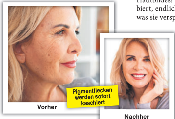
(Anwendungsfall nachempfunden, Name geändert)

Zahlreiche Betroffene vertrauen auf Lentisol. So berichtet z. B. die Anwenderin Maria S.: „Ich bin wirklich begeistert, verwende die Creme seit ungefähr 2 Wochen, deutliche Verbesserung des Hautbildes! Hab’ schon so viel ausprobiert, endlich mal eine Creme, die hält, was sie verspricht! Tolles Produkt!“