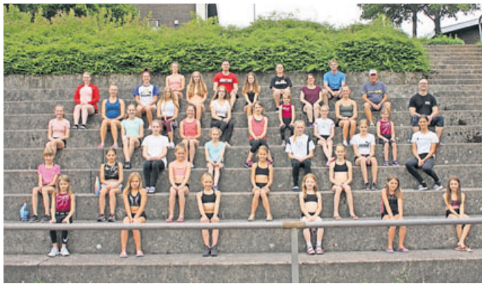
Betreuer, Trainer und Teilnehmer des Trainingslagers im Jugendzentrum Ronneburg.

In drei Häusern untergebracht und den coronabedingten Vorschriften in Unterkunft, Essensbereich und Sportstätten unterworfen, konnten sich die Betreuer und Trainer dennoch intensiv der Verbesserung schwieriger Übungsteile, vor allem aber der Grundlagenarbeit widmen. Als Übungsleiter be-