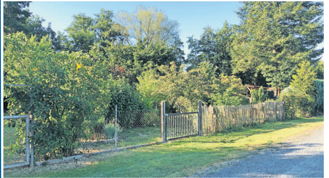
Die Pachten für Schrebergärten sollen erschwinglich sein.

Bürgerbewegung Bergwinkel bringt zwei Anträge ein