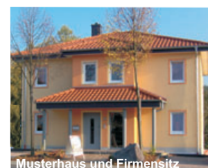
Musterhaus und Firmensitz