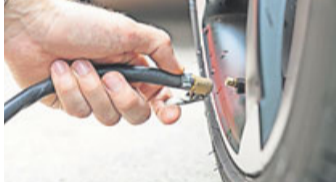
Wer viel Gepäck geladen hat, muss den Reifendruck erhöhen.

Genug Wischwasser mit Sommerreiniger im Behälter für die Scheibenreinigungsanlage? Ölstand korrekt im Motor und ausreichend Wasser im Kühler? Sowas sollten Sie prüfen, bevor Sie mit dem Auto in den Urlaub fahren, rät der ADAC Berlin-Brandenburg. Auch ein Blick auf die Reifen darf nicht fehlen. Haben die noch genug Profil? Es sollten mindestens 3 anstelle der 1,6 Millimeter Mindesttiefe sein, die der Gesetzgeber vorschreibt. Bei schwerer Beladung durch Gepäck und Insassen muss der Luftdruck erhöht werden. Die Hersteller geben entspre-