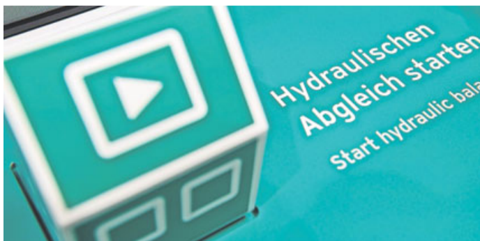
Bei einem hydraulischen Abgleich stellt der Sanitärfachmann die Heizung neu ein.

Beim hydraulischen Abgleich wird die alte Heizung neu eingestellt - und das kann im nächsten Winter einiges an Heizkosten einsparen. Das Institut rät dazu, das im Sommer zu erledigen.