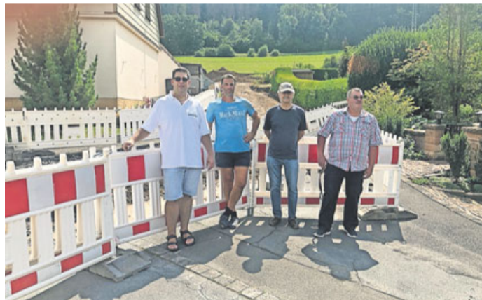
Die Mitglieder der BBB vor der Baustelle.

der Bürgerbewegung Bergwinkel auch notwendig, dass hinsichtlich weiterer Details bezüglich der Gestaltung der einzelnen Bauplätze insbesondere derer, die in unmittelbarer Nachbarschaft zu den Alteigentümern liegen, rechtzeitig zusätzliche Informationen erfolgen sollten. Während der Ortsbesichtigung haben die Mitglieder der Bürgerbewegung Bergwinkel zwei Filme gefertigt, die die Fortschritte der Bauarbeiten bestens wiedergeben und auf der Homepage der Bürgerbewegung Bergwinkel, sowie auf dem Youtube Kanal BürgerTV Bergwinkel angesehen werden können. Die Mitglieder der Bürgerbewegung Bergwinkel waren alles in allem positiv überrascht und man hofft nun, dass junge Familien sich einen lange gehegten Traum zur Errichtung eines Eigenheims mit einem wunderbaren Blick über Schlüchtern erfüllen können.