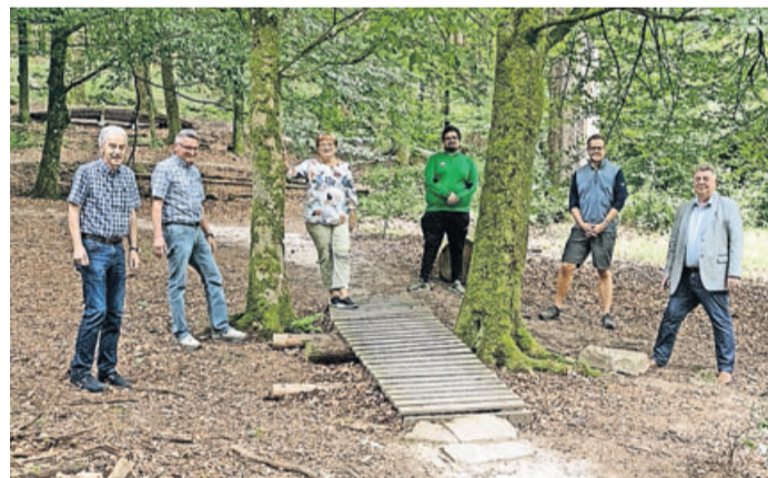
SPD Fraktionsmitglieder begutachten den Flowtrail.

Bad Soden-Salmünster. Mountainbiken hat sich längst zu einem Massensport entwickelt – besonders in Verbindung mit den sogenannten Flowtrails. Ein solches Angebot gehört als Besuchermagnet heute einfach mit dazu – Bad Soden-Salmünster hat hier Nachholbedarf. Die SPD Fraktionsmitglieder haben auf ihrer jüngsten Sitzung daher einstimmig beschlossen die Stadtverordnetenvorlage zu unterstützen, die den Magistrat unter Inanspruchnahme von möglichen Fördermitteln zu beauftragen, die Erweiterung des Streckennetzes auf Bad Soden-Sal-