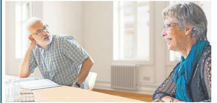
Englisch bei ELKA zu lernen, bedeutet für „Senioren“ auch in Corona-Zeiten mit Humor, Spaß und direktem Sprachtraining geistig fit zu bleiben.

Kleine Gruppen, wenig Grammatik, viel sprechen und ein besonderes Lehrmaterial, das genau auf die Lernbedürfnisse älterer Erwachsener zugeschnitten ist, stehen bei ELKA (Erfolgreich lernen. Konzepte im Alter) im Vordergrund. Ab sofort beginnen die besonderen Sprachkurse für aktive Menschen ab 50 Jahren. Vielseitige Übungen und direktes Sprachtraining von Dialogen – die übrigens jeder Teilnehmer auf CD auch daheim üben kann, machen das Lernen leicht. Erfahrene Dozenten, die überwiegend selber der Generation 50+ angehören, leiten die speziellen Englischkurse. Mit Geduld und Humor motivieren sie die Lernenden ab der ersten Stunde in kleinen Gruppen zum freien Sprechen. Hier geht es nicht darum, möglichst viele Vokabeln in kurzer Zeit auswendig zu lernen und höchstwahrscheinlich schnell zu vergessen. Mit Erfolg Englisch sprechen lernen heißt bei ELKA: Weniger ist mehr! Darum erweitern die Lernenden ihr