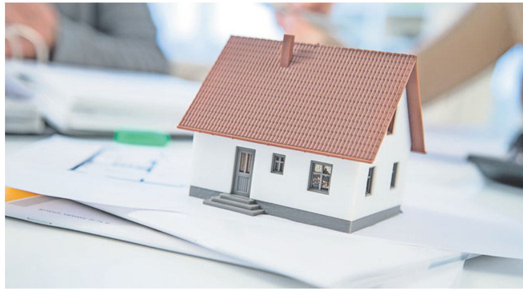
Weißer Putz, rote Dachziegel, nach Süden ausgerichtet: Manche Gemeinden schreiben detailliert vor, wie ein Neubau geplant werden darf.

Viele Gemeinden planen inzwischen lieber strenger, um