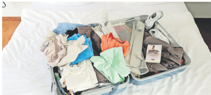
Hotelgäste in der Türkei sollen künftig eine Bettensteuer zahlen - das hat das türkische Parlament beschlossen.