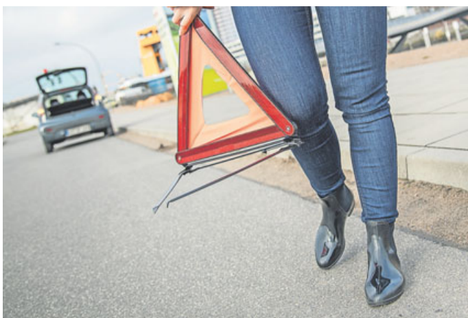
Warndreieck aufstellen, Pannenservice anrufen – so macht man es richtig. Doch manchmal werden Autopannen von Betrügern auch vorgetäuscht.

Zweifel sollten Urlauber lieber einfach weiterfahren, auch um sich im laufenden Verkehr nicht zu gefährden. Im Stadtverkehr und vor roten Ampeln sei es auf Reisen ratsam, stets Kofferraum und Türen verriegelt zu haben und die Fenster nur einen Spalt zu öffnen, rät die Verbraucher-schutzorganisation. Urlauber mit Wohnwagen oder Wohnmobil sollten bei Übernachtungen generell einen Campingplatz ansteuern, Fenster und Türen verschlossen halten und – falls vorhanden – die Diebstahlsicherung aktivieren.