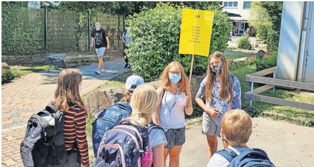
Schülerbuspatinnen zeigen ihren neuen Mitschülern den richtigen Bus.