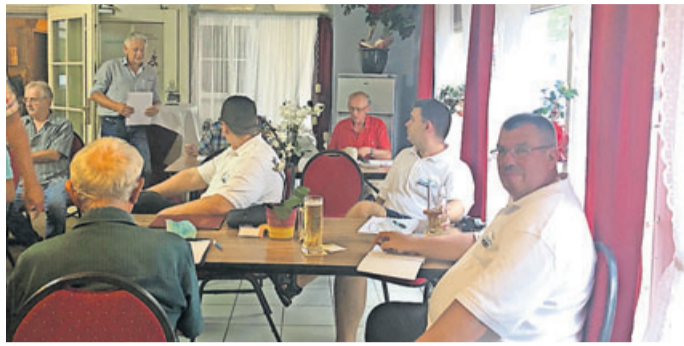
Mitgliederversammlung in der Stammgaststätte Eckebacker.